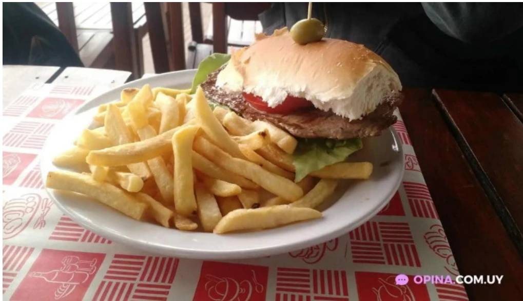
La rotonda comida y bebida