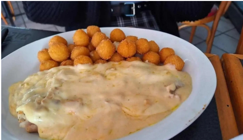
La rotonda tater tots