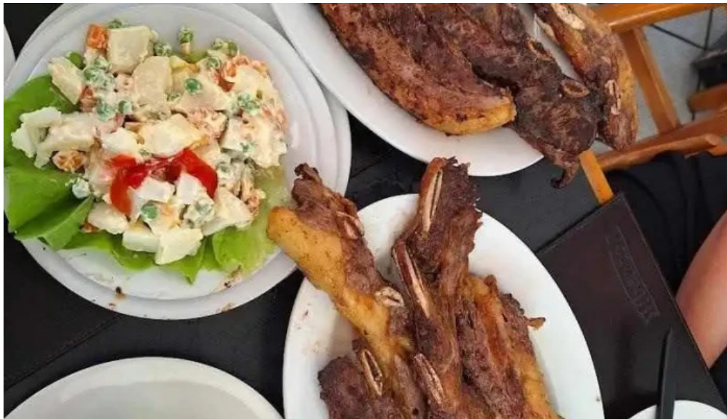
La rotonda churrasco