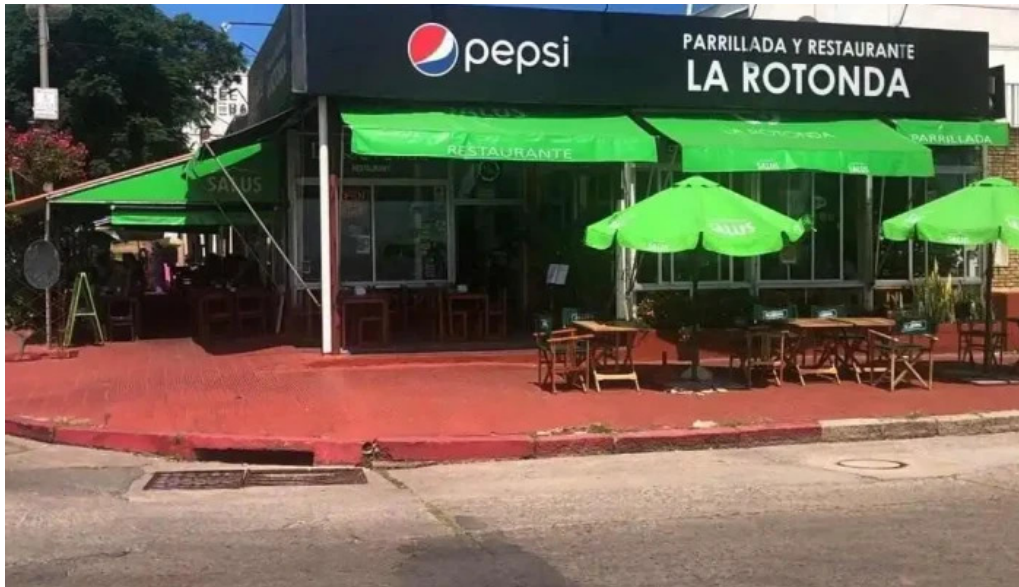
La rotonda piriapolis