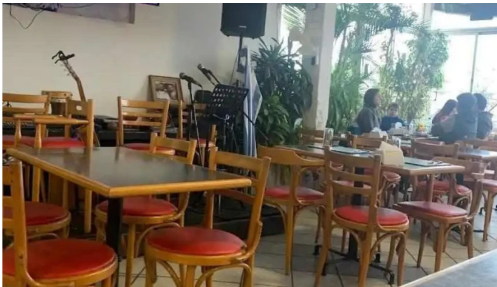
La rotonda ambiente