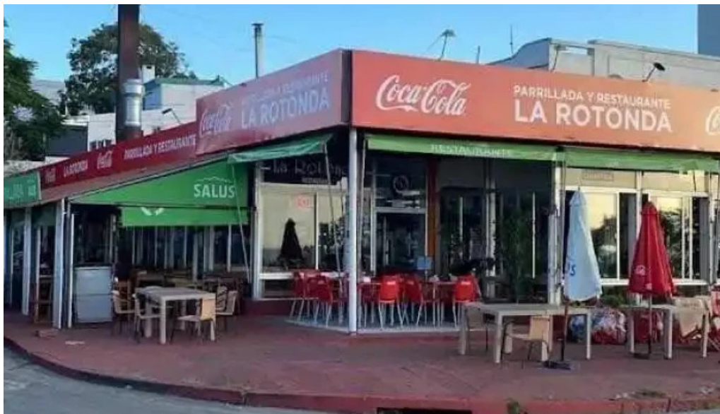
La rotonda del propietario