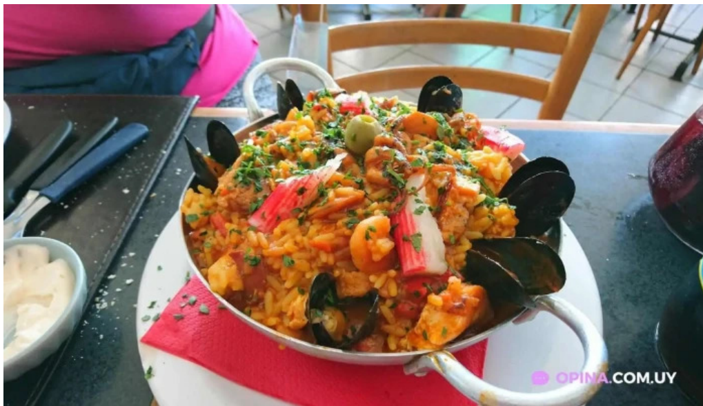
La rotonda paella