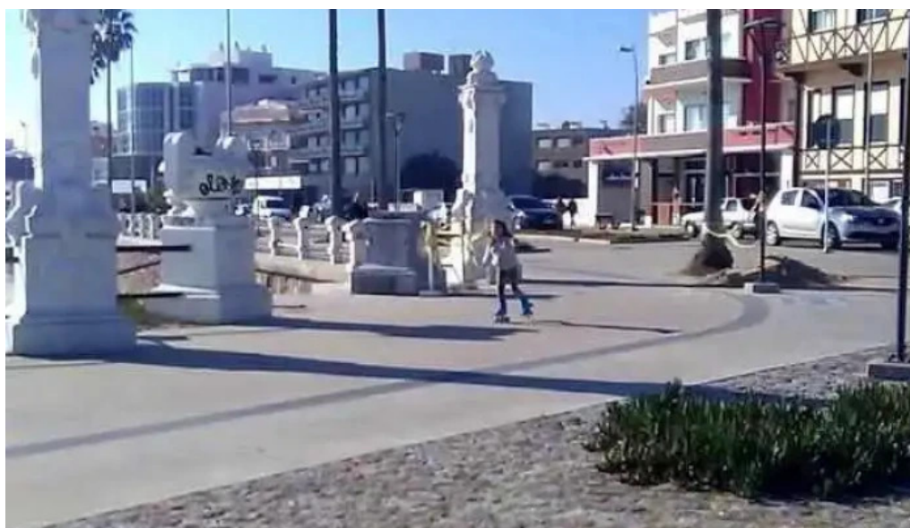
La rotonda videos