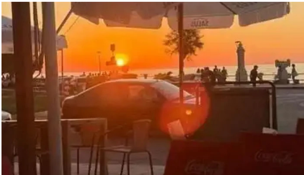
La rotonda mas recientes