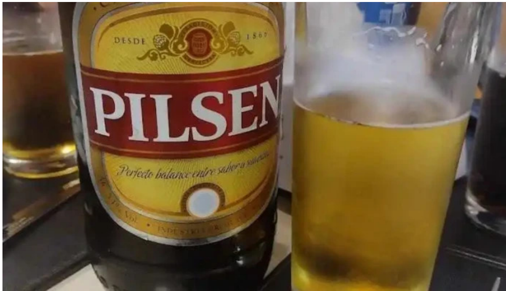
La rotonda cerveza