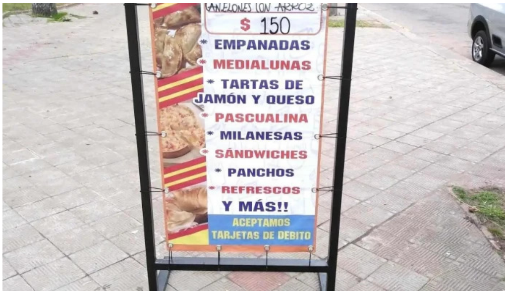
La plaza food truck menu