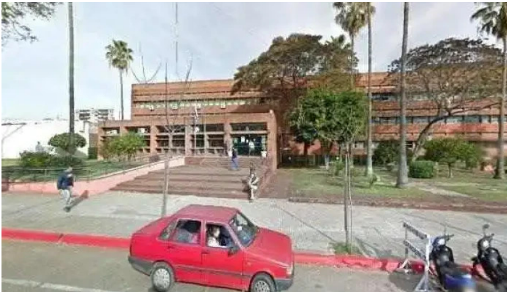
La plaza food truck street view y 360