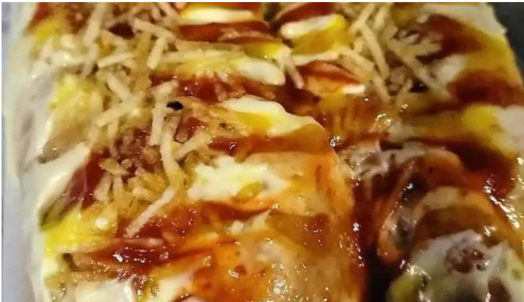
La plaza food truck salto