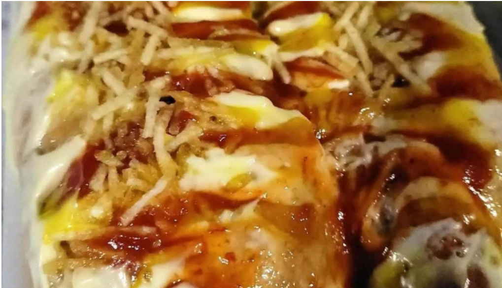
La plaza food truck todo