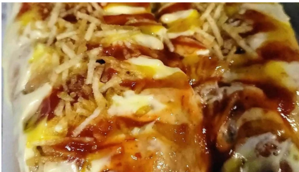
La plaza food truck comidas y bebidas