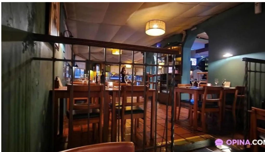
La perdiz ambiente