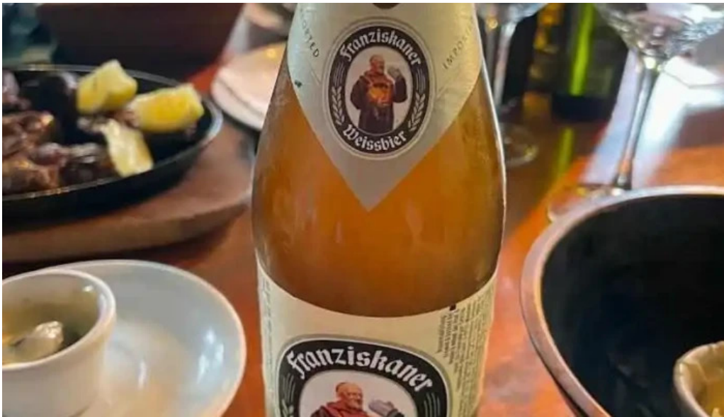
La perdiz cerveza