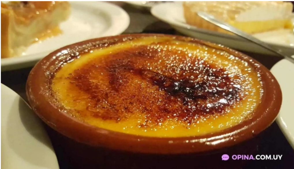
La perdiz crema catalana