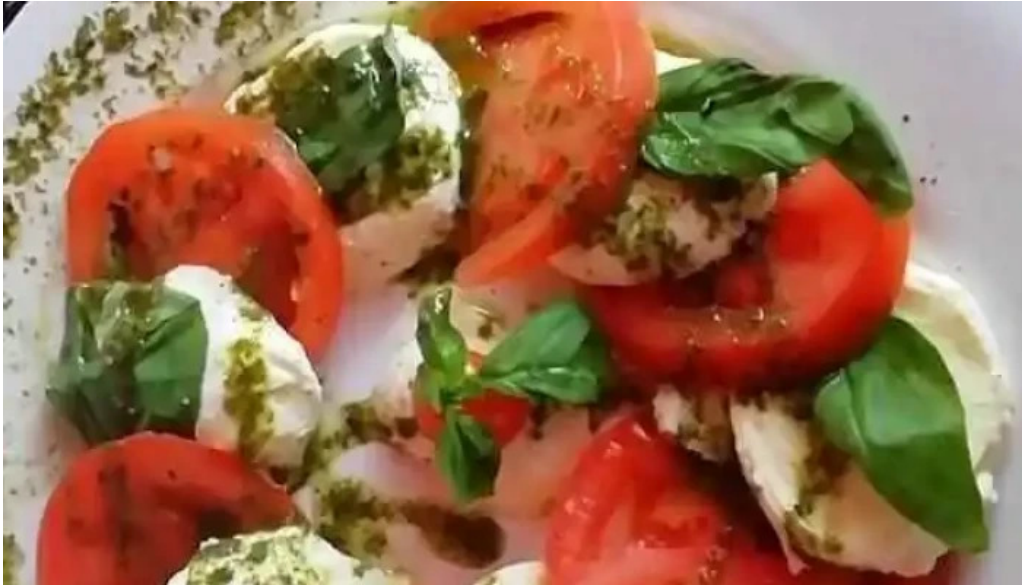
La perdiz videos