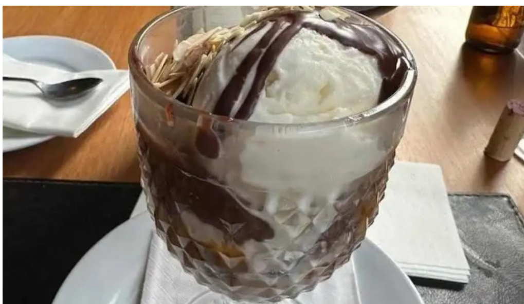
La perdiz affogato