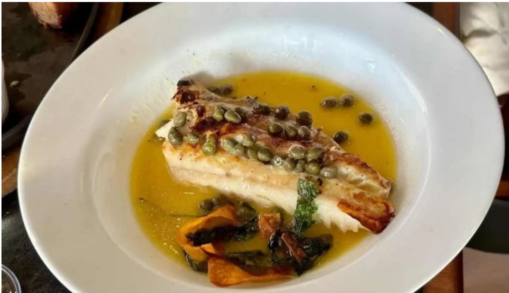
La perdiz lubina