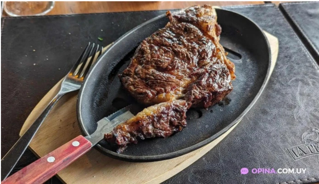
La perdiz filete