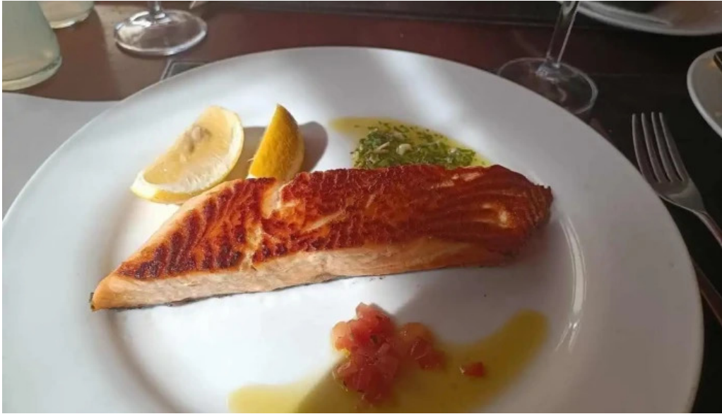
La perdiz comida y bebida