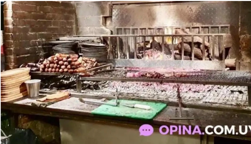
La perdiz montevideo