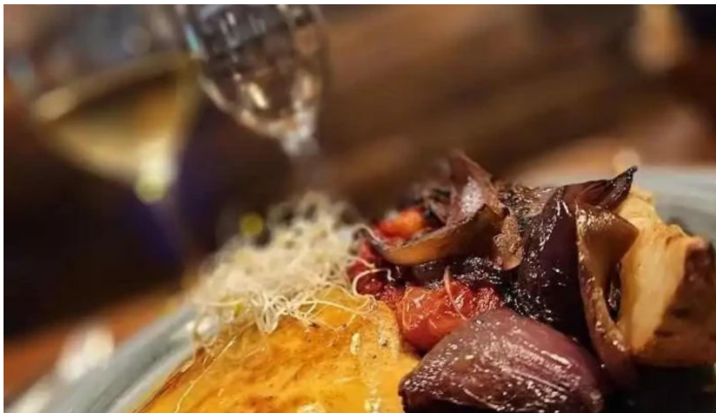
La perdiz mas recientes