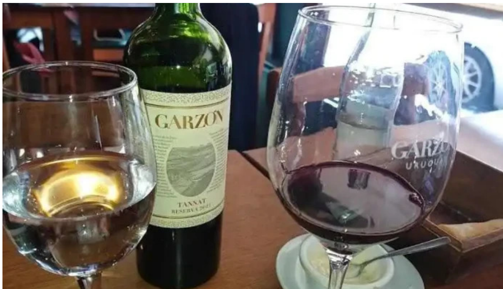
La perdiz vino