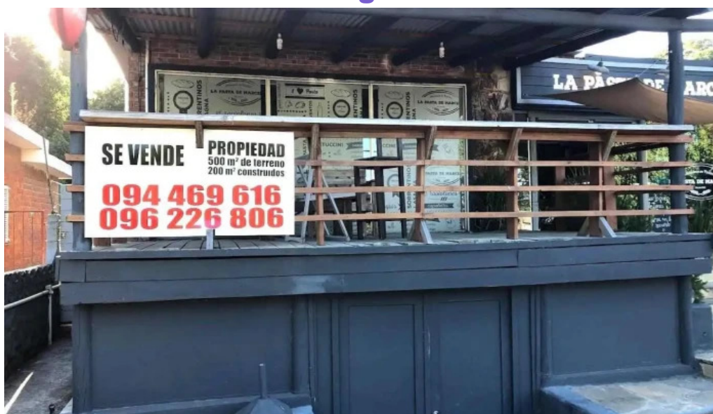
La pasta de marcelo todas