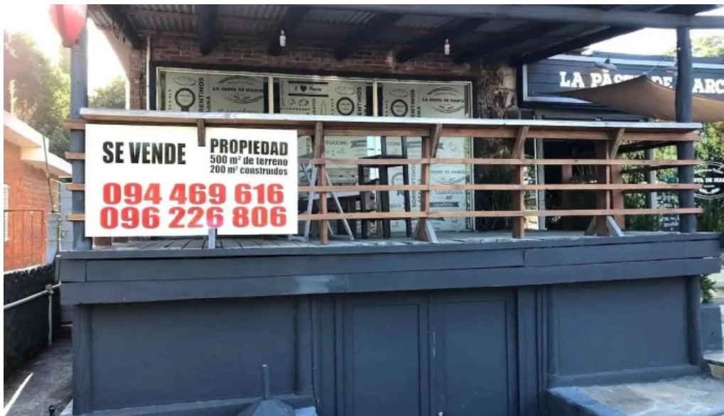
La pasta de marcelo maldonado