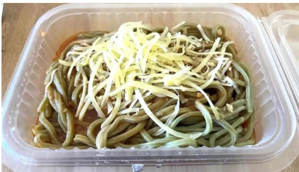
La pasta de marcelo comida y bebida