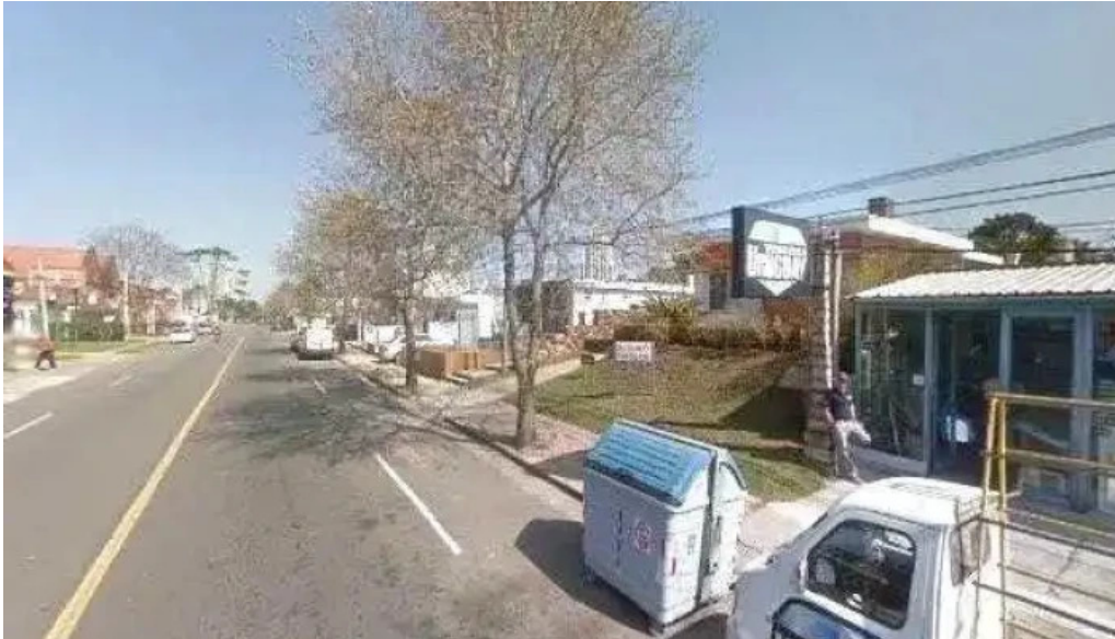
La pasta de marcelo street view y 360