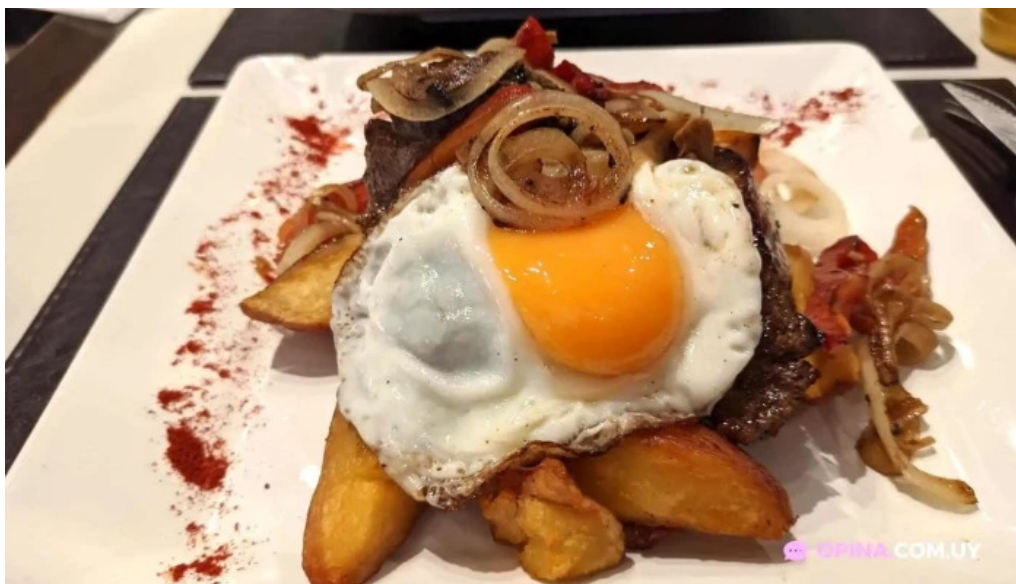
La pasiva comidas y bebidas