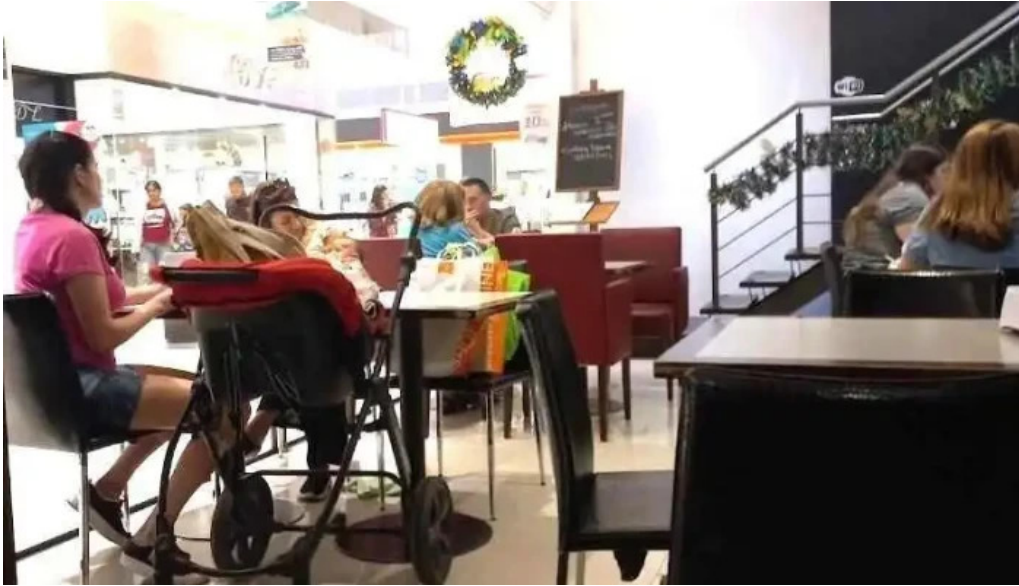
La pasiva montevideo