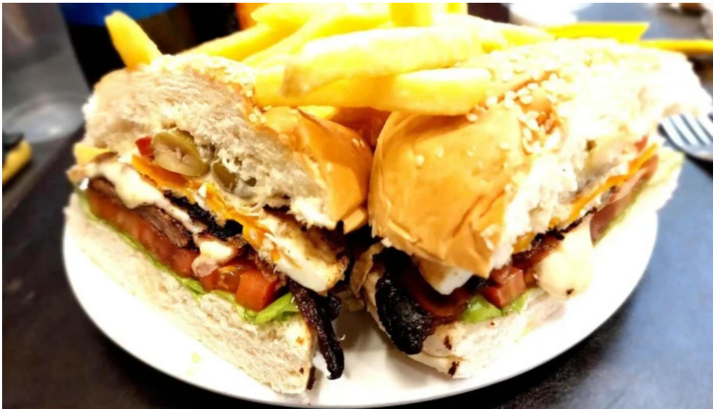
La pasiva papas fritas