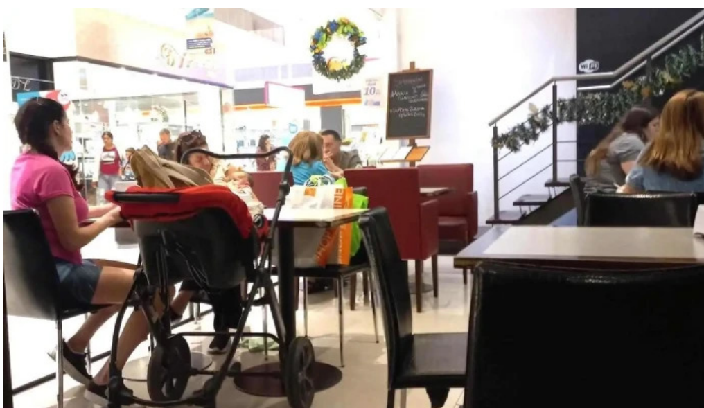
La pasiva ambiente