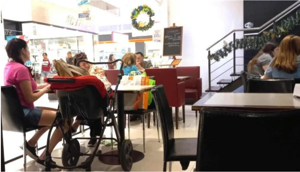
La pasiva todo