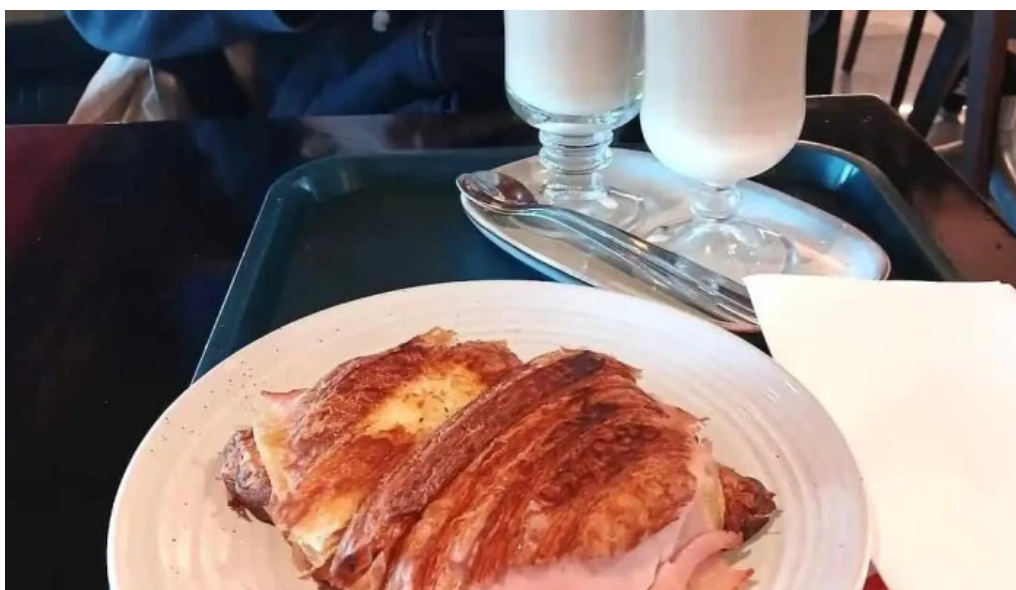
La pasiva ciudad de la costa