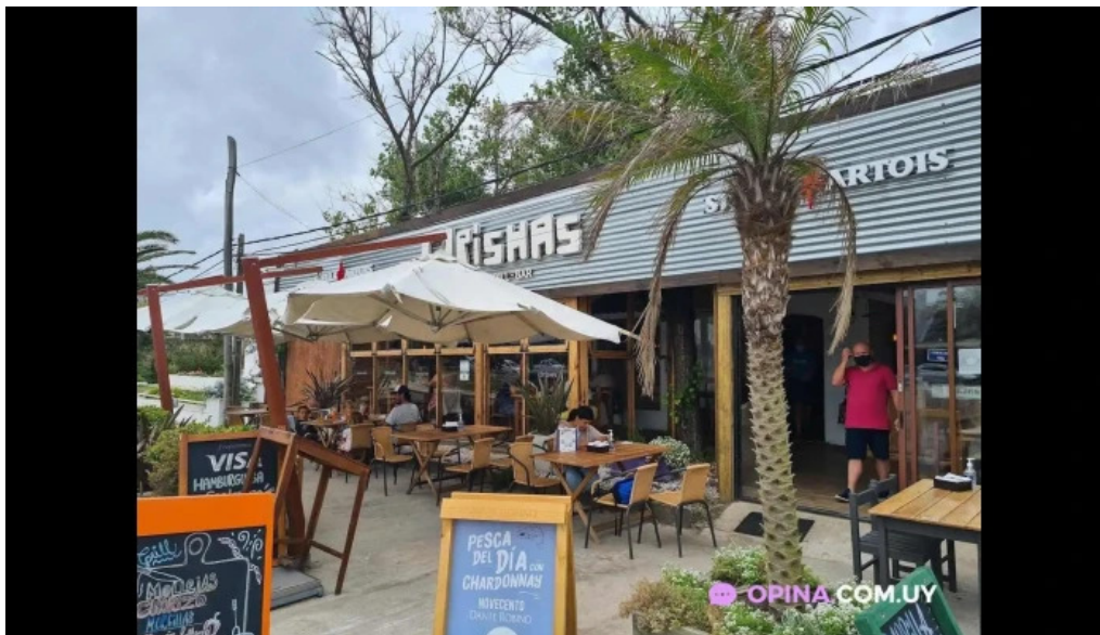
Orishas la paloma