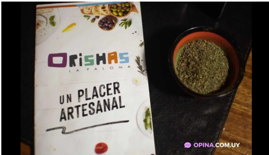
Orishas del propietario