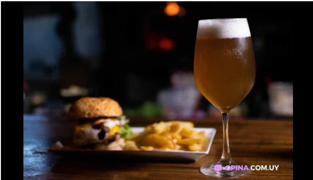
Orishas comida y bebida