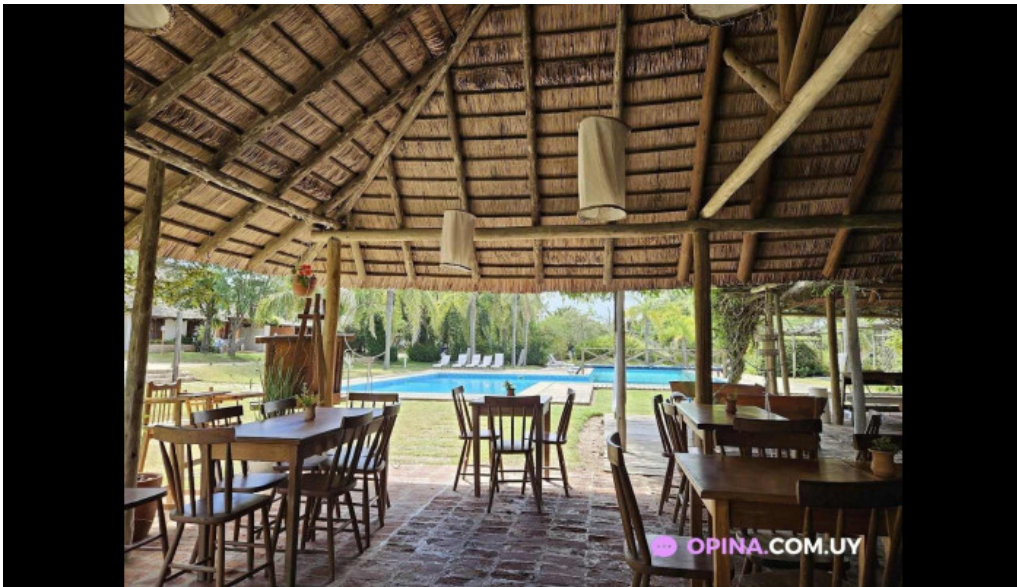
Naranjalima la paloma