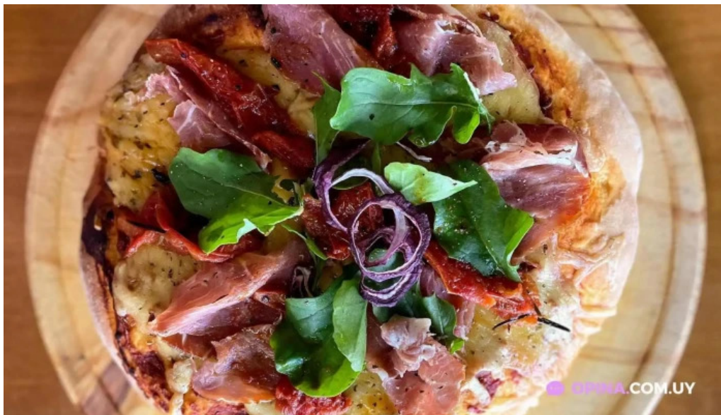
Naranjalima del propietario