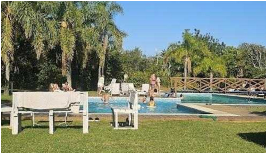
Naranjalima mas recientes