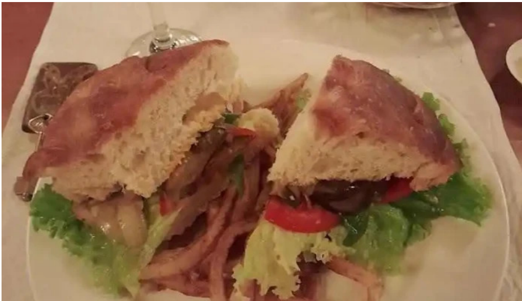
Naranjalima sandwich blt