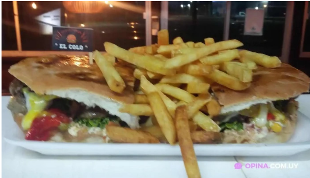
Chiviteria el colo la paloma