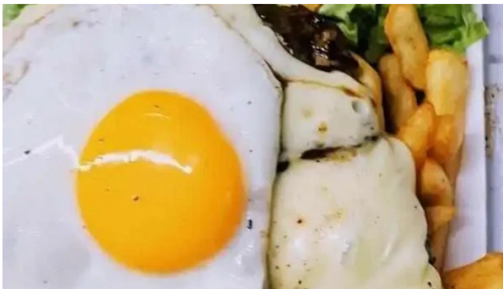
Chiviteria el colo comida y bebida