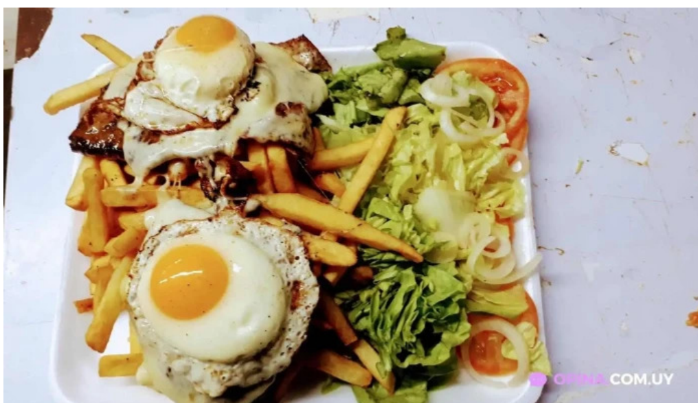
Chiviteria el colo papas fritas