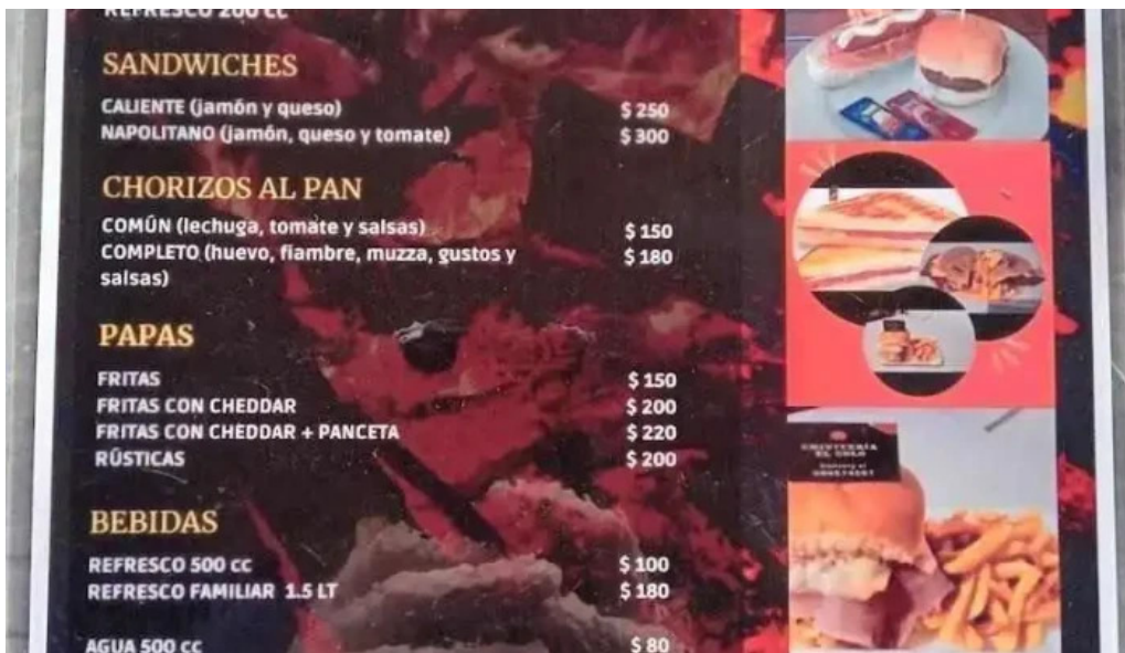
Chiviteria el colo del propietario