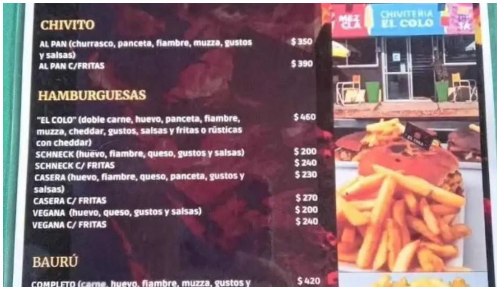
Chiviteria el colo menu