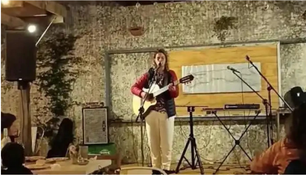
Bar la onda videos