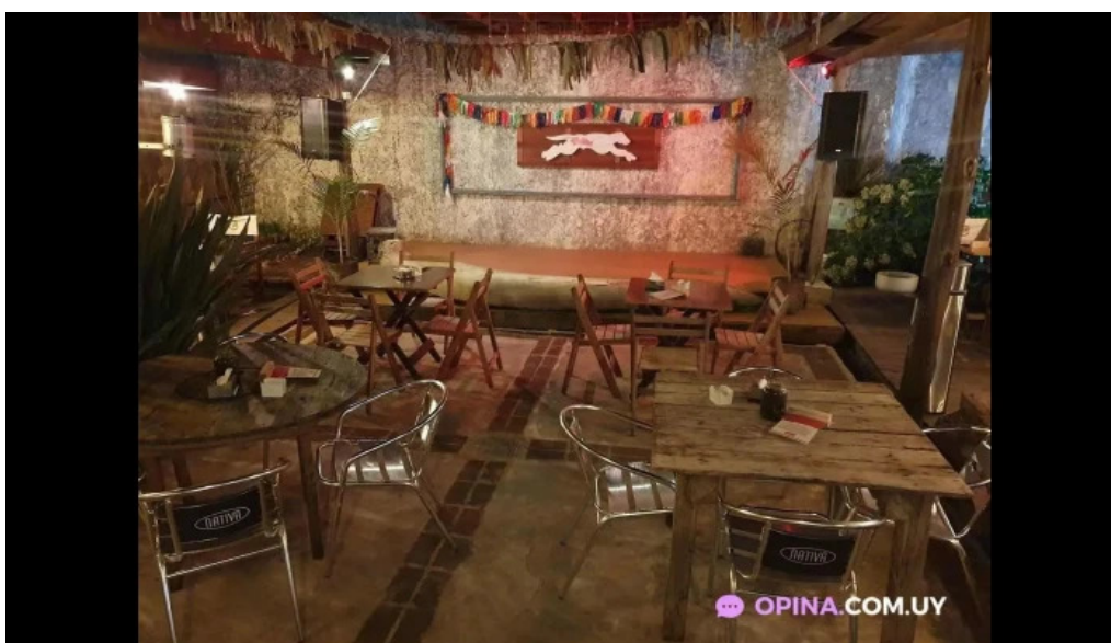
Bar la onda ambiente