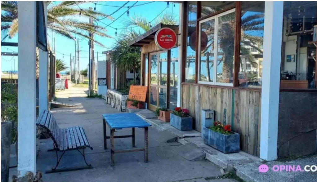
Bar la onda todas