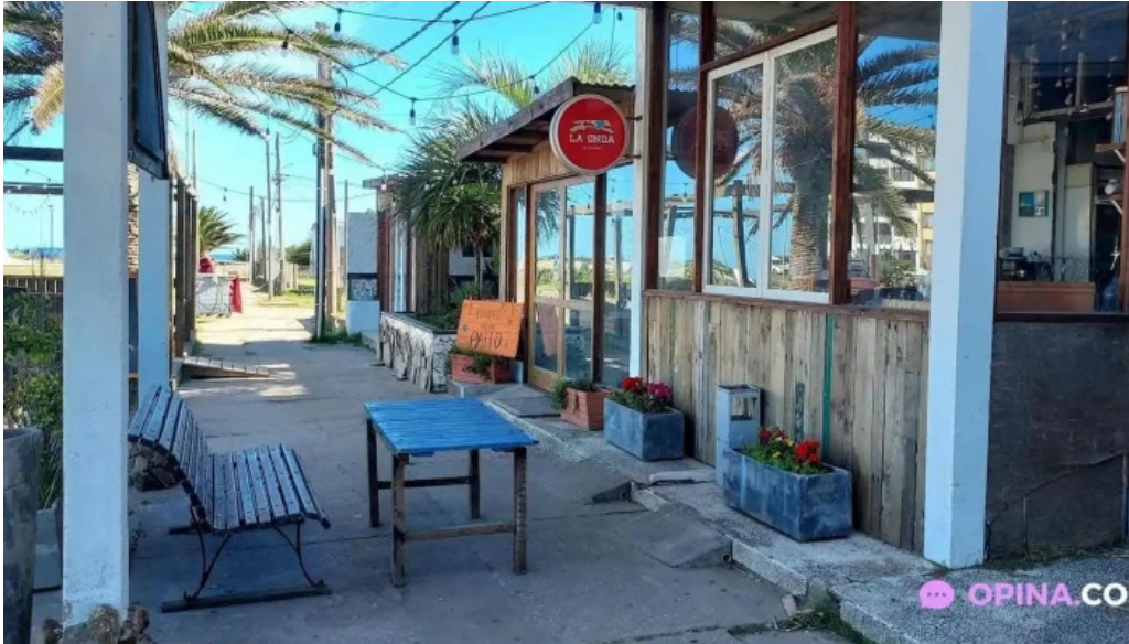
Bar la onda la paloma