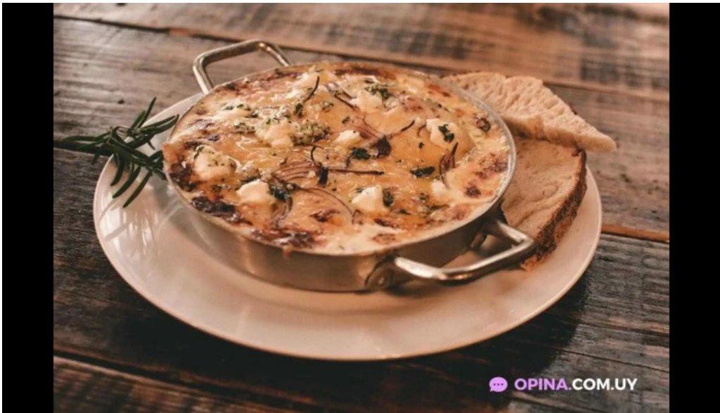
Bar la onda del propietario