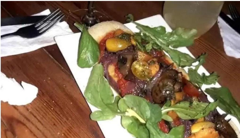
La locanda bar comida y bebida