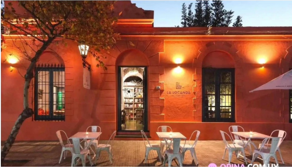
La locanda bar del propietario