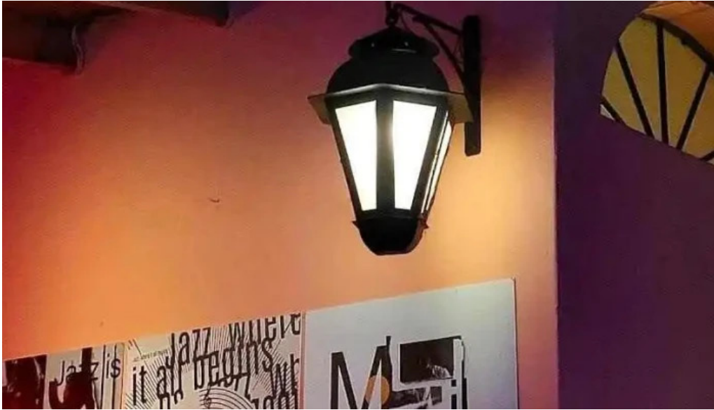
La locanda bar mas recientes