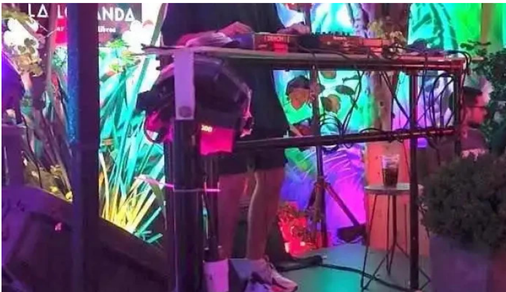
La locanda bar videos