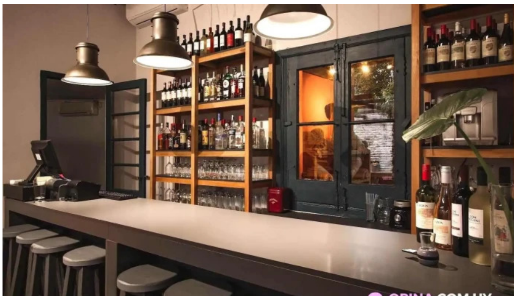
La locanda bar col del sacramento