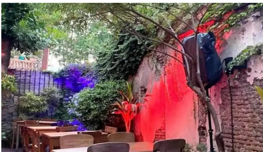
La locanda bar ambiente