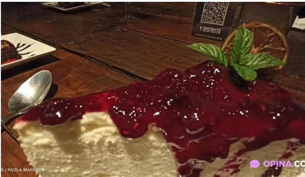
La giraldita pastel de queso