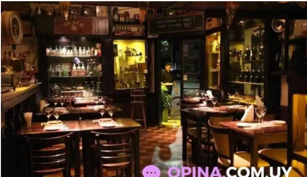
La giraldita montevideo