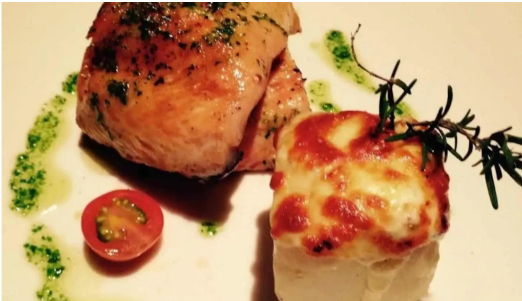
La giraldita del propietario