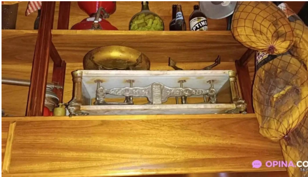
La giraldita comida y bebida