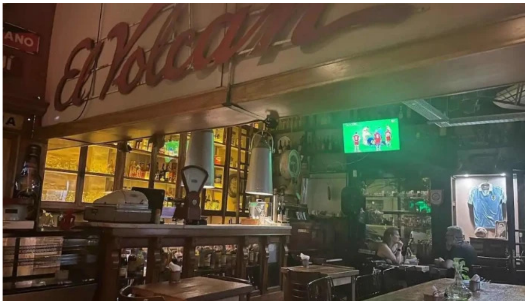
La giraldita ambiente