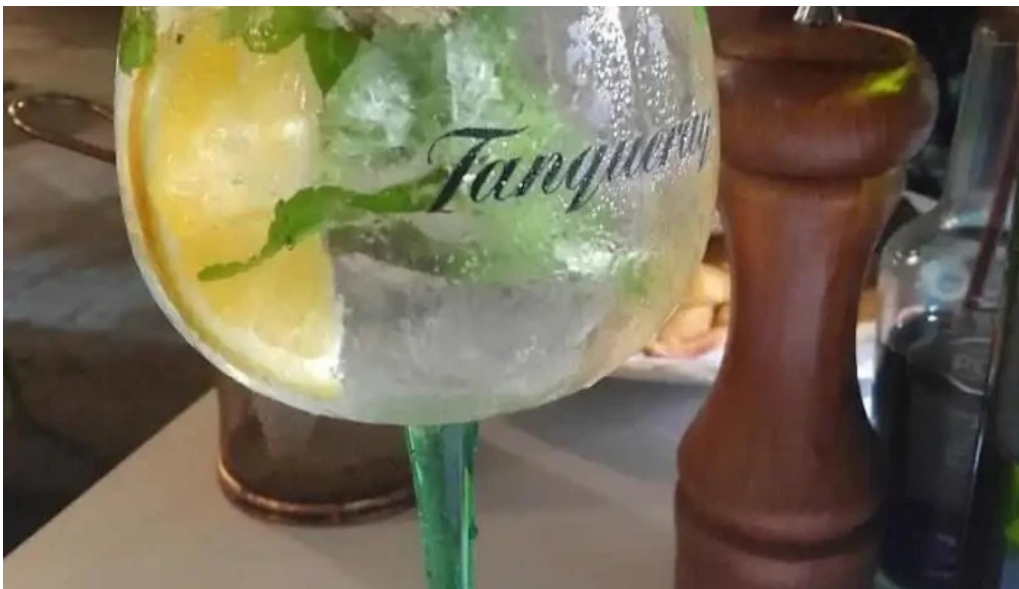
La giraldita mojito