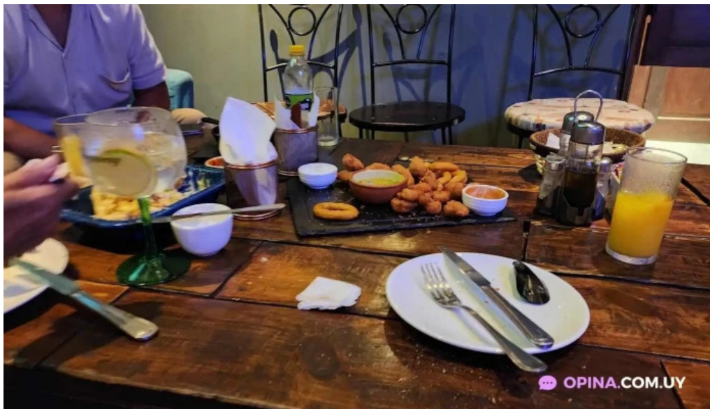
La giraldita mas recientes