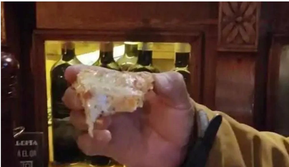
La giraldita videos