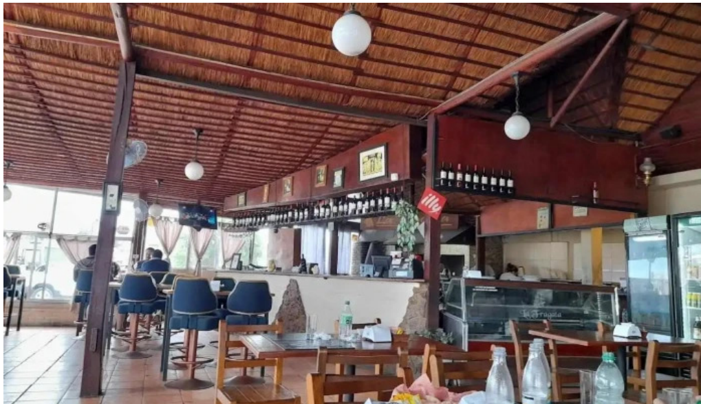
La fragata ambiente