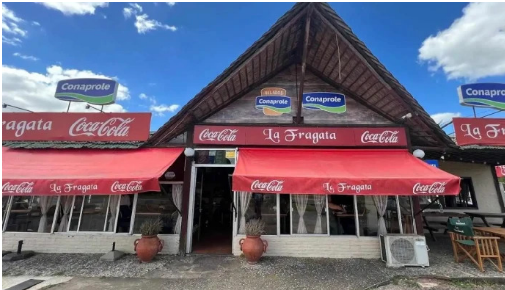
La fragata todas