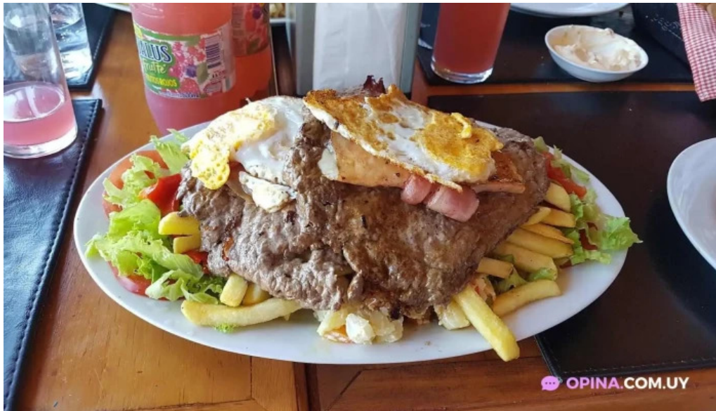
La fragata comida y bebida