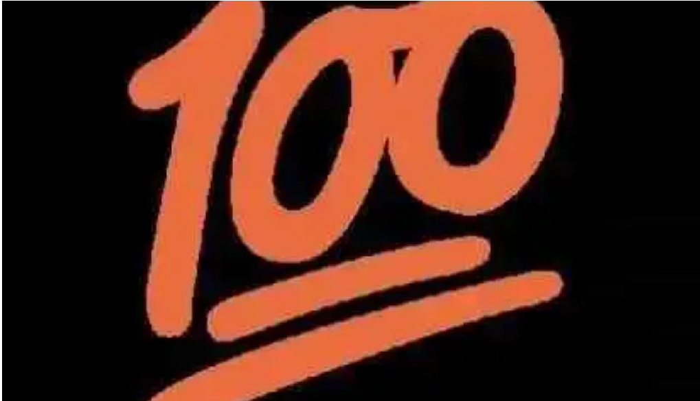
La fragata videos