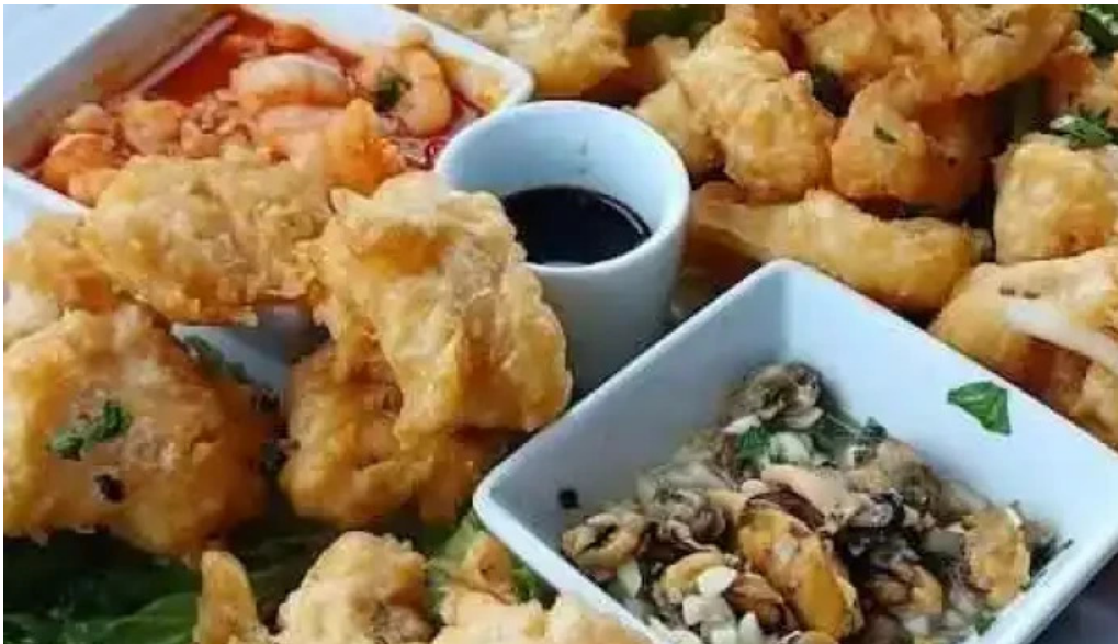
La fontaine gamba frita