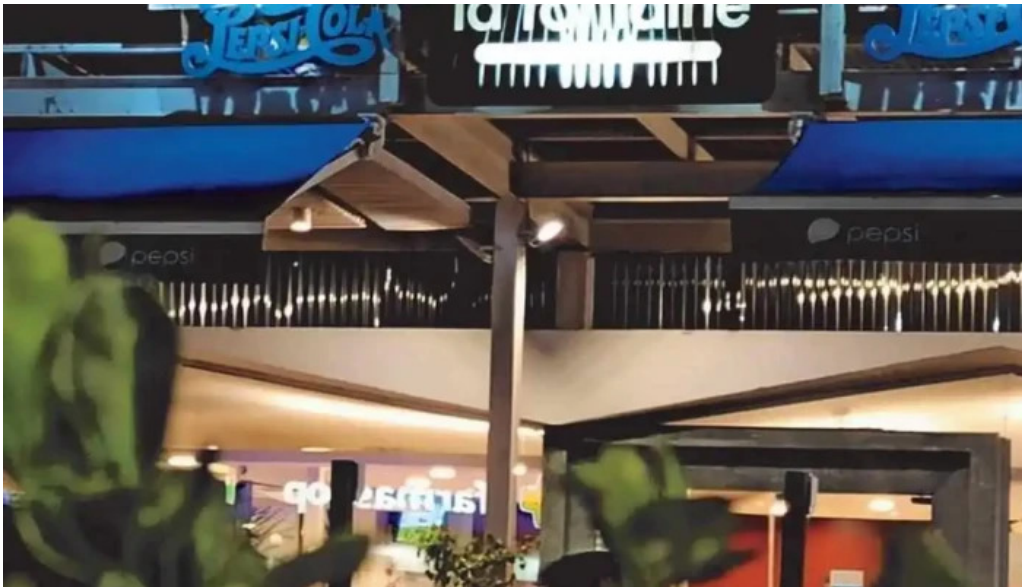
La fontaine atlantida