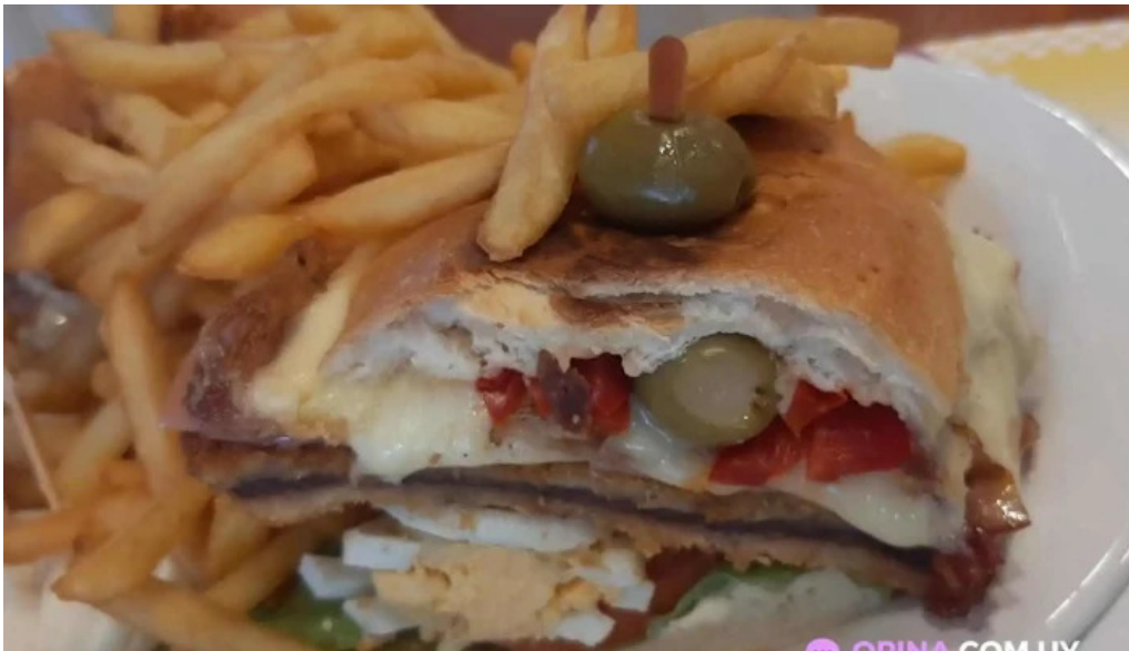
La fontaine milanesa