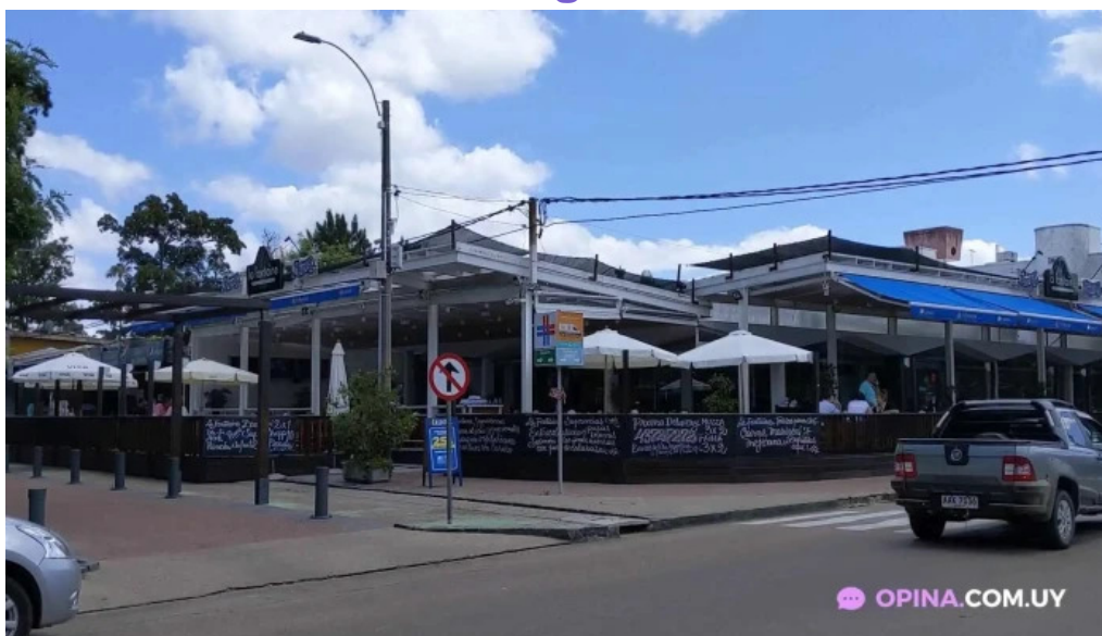
La fontaine videos