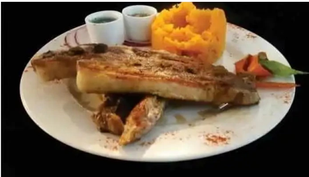
La fontaine del propietario