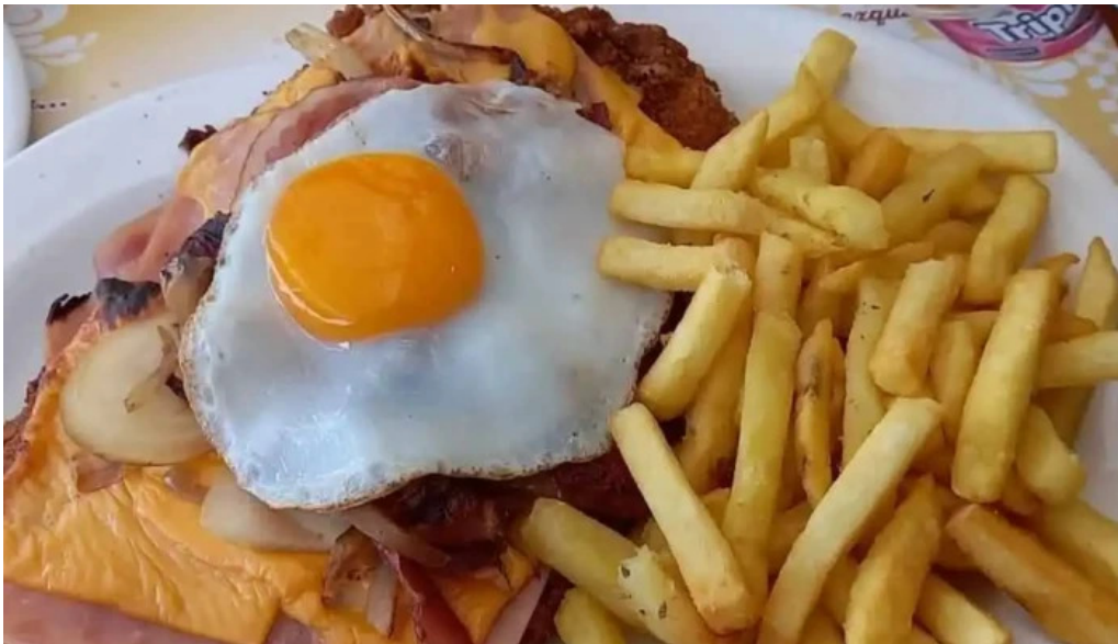
La fontaine papas fritas