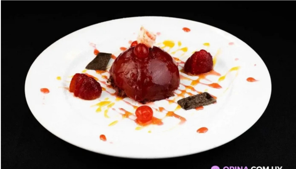
La fontaine postre