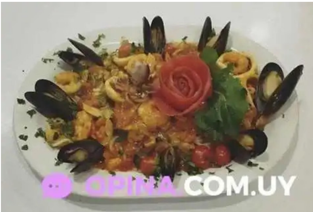
La fontaine antipasto