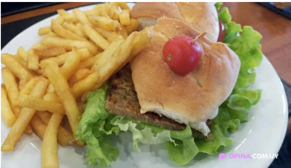
La fontaine sandwich de pollo