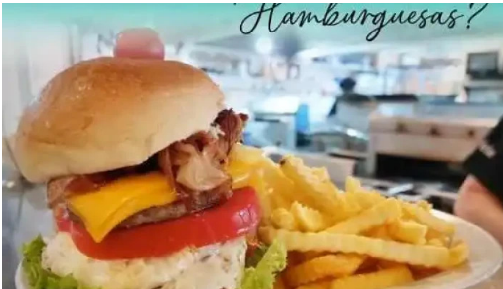
La fontaine mas recientes