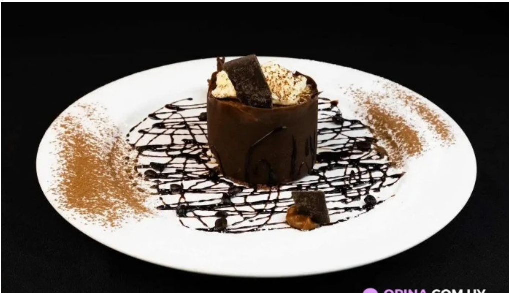
La fontaine chocolate