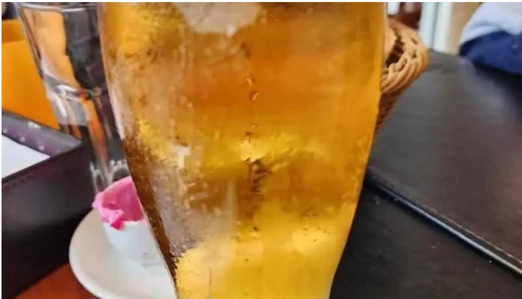
La fontaine cerveza