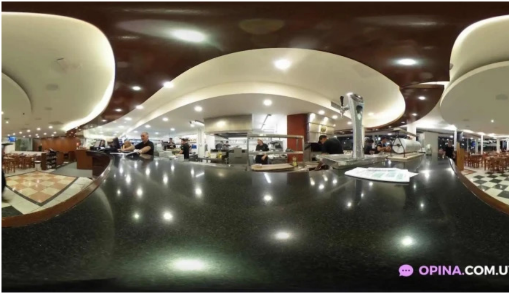
La fontaine street view y 360