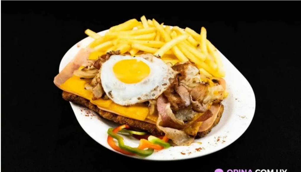
La fontaine comida y bebida