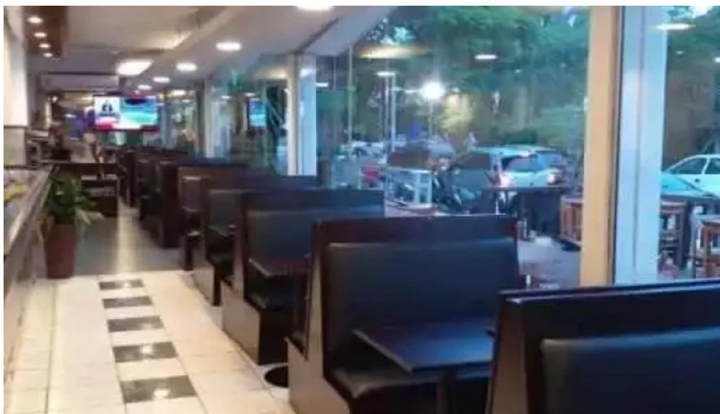
La fontaine ambiente