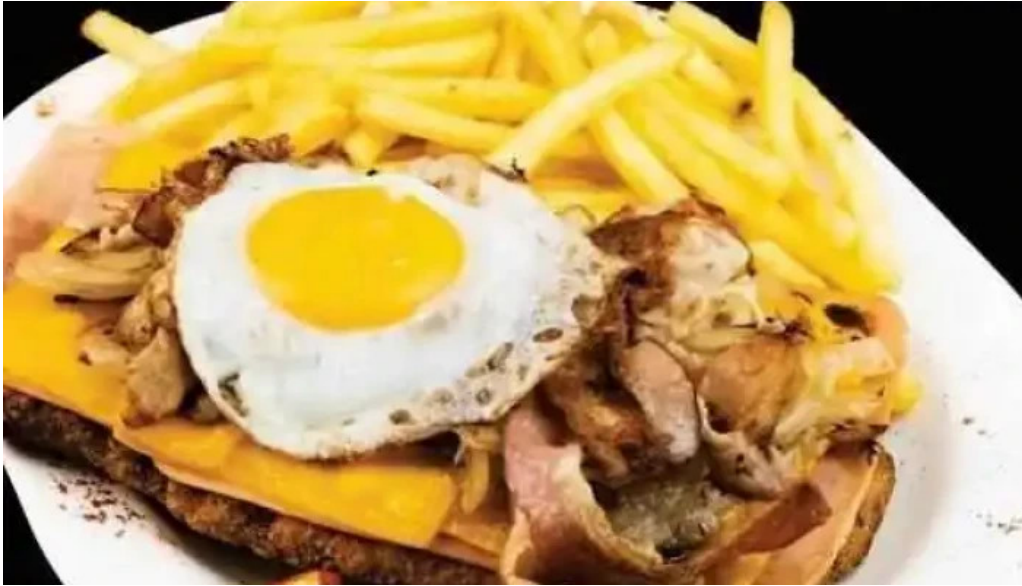
La fontaine chivito