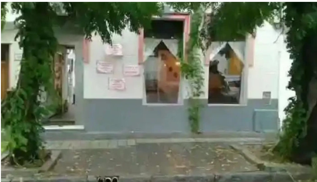
La florida videos