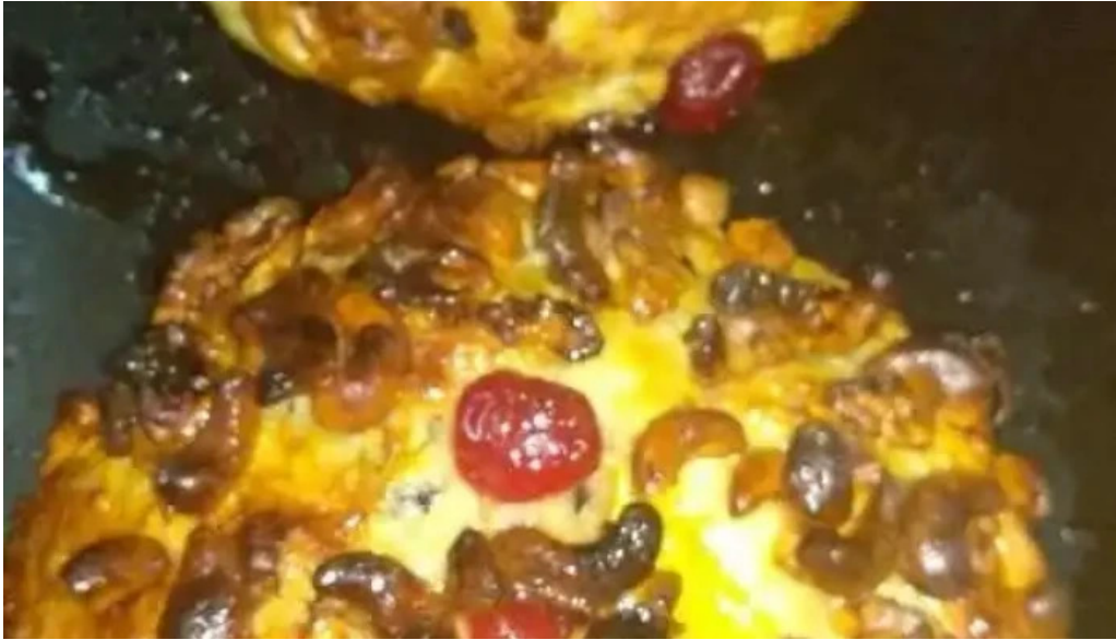
La florida comida y bebida