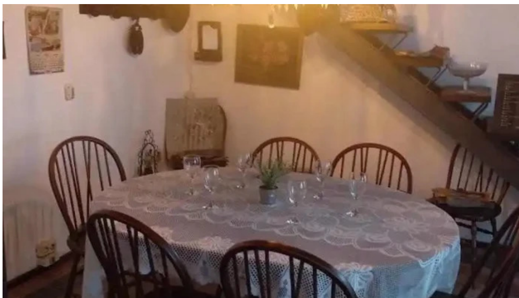
La florida ambiente