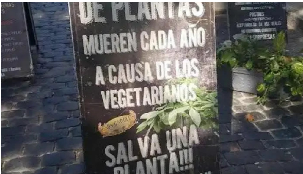
La florida menu