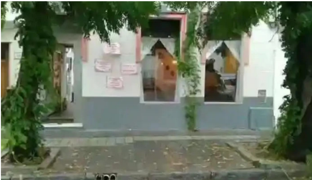
La florida del propietario