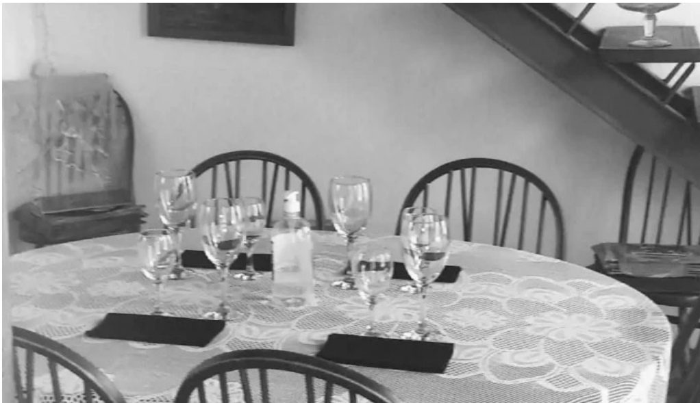
La florida col del sacramento