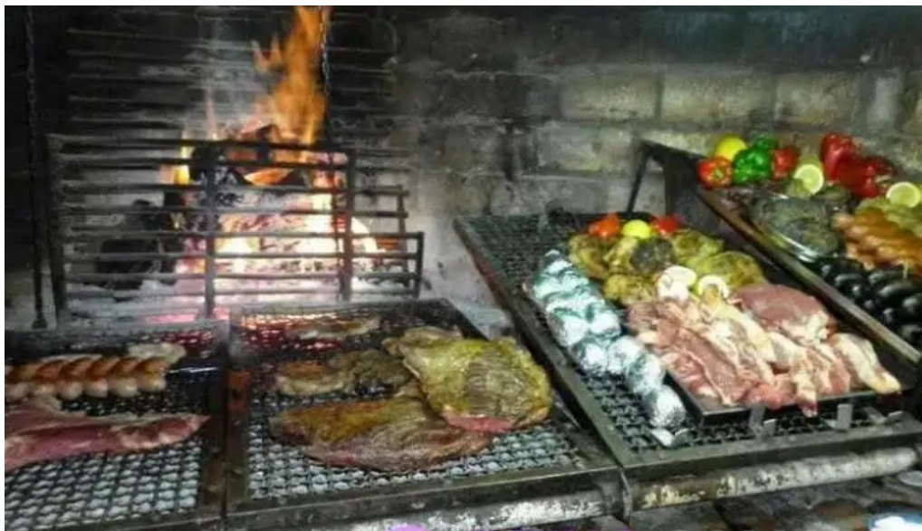
La esquina azul ambiente