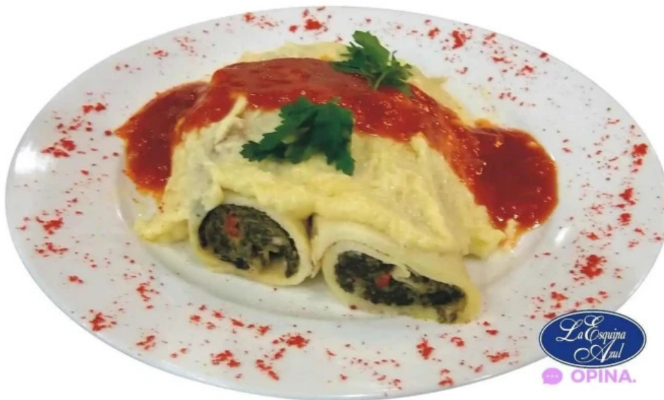
La esquina azul comida y bebida