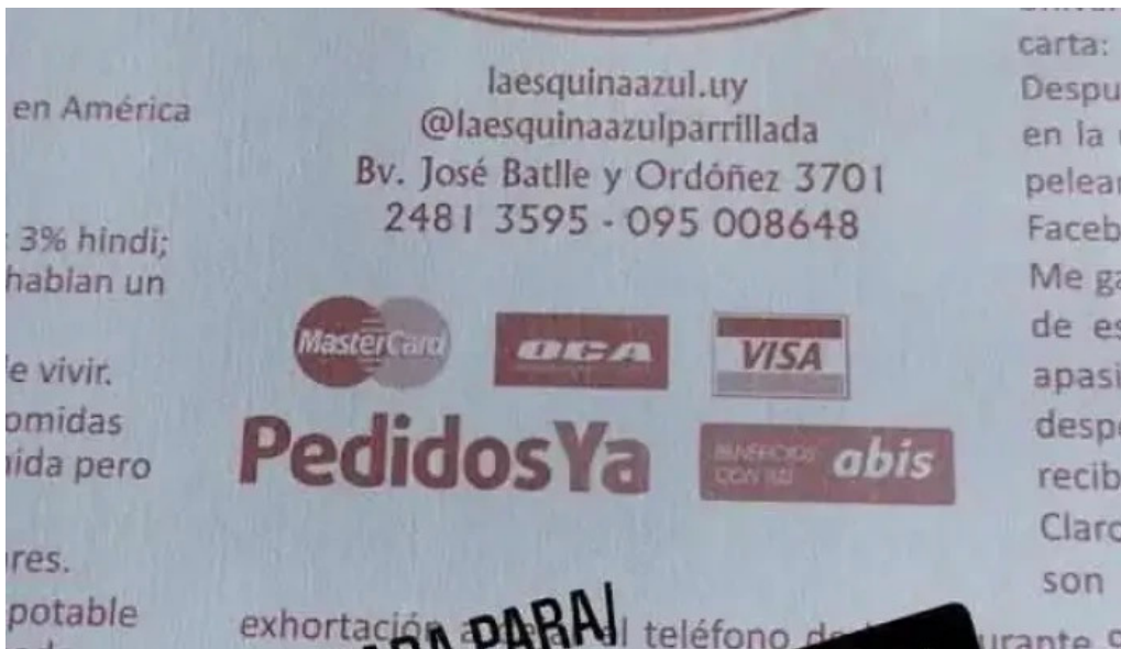
La esquina azul menu