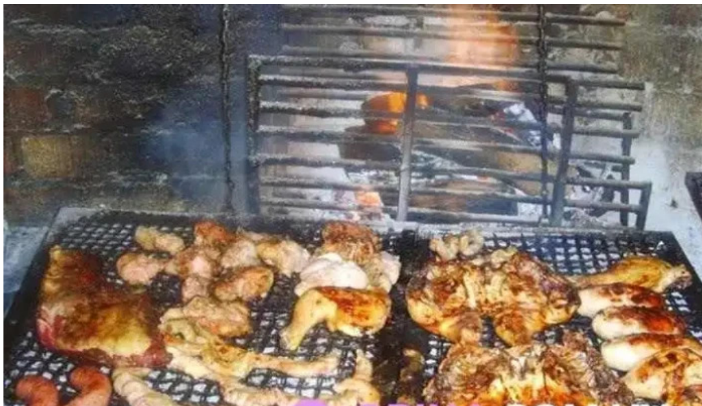
La esquina azul del propietario