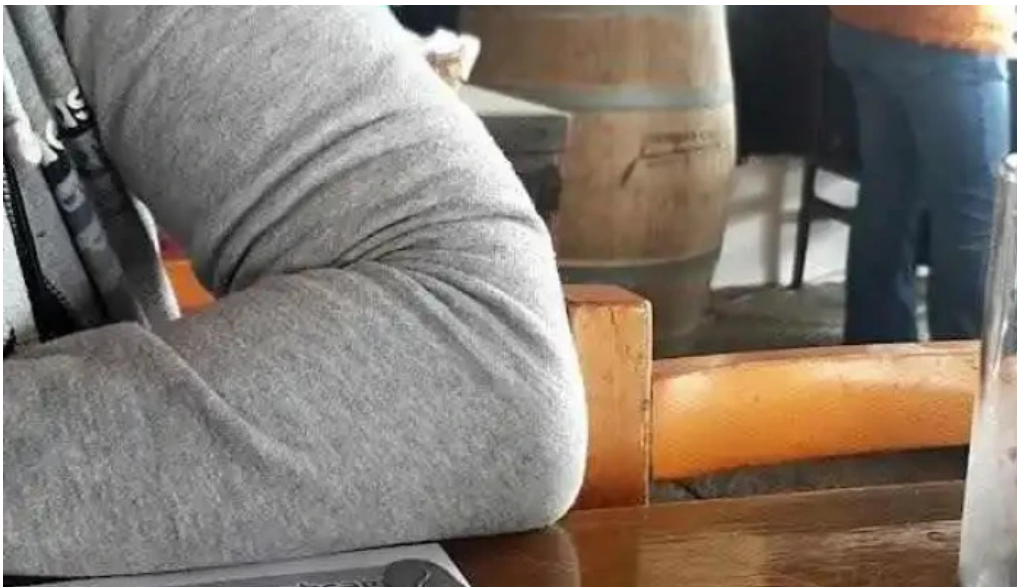
La esquina azul videos