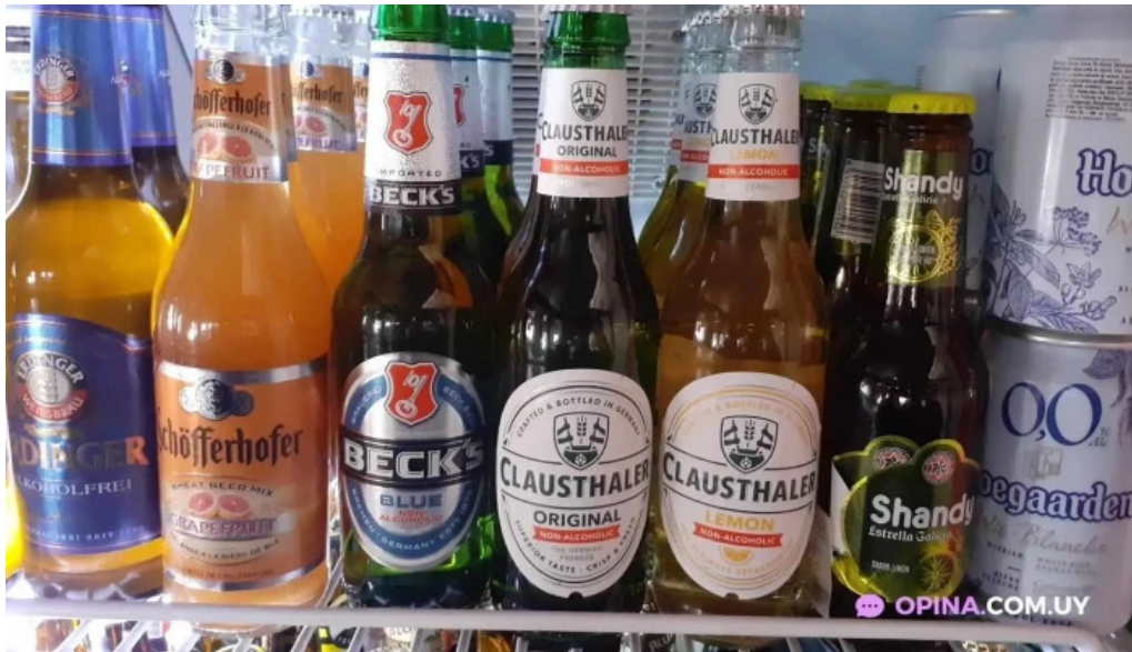
La cocina del club todas