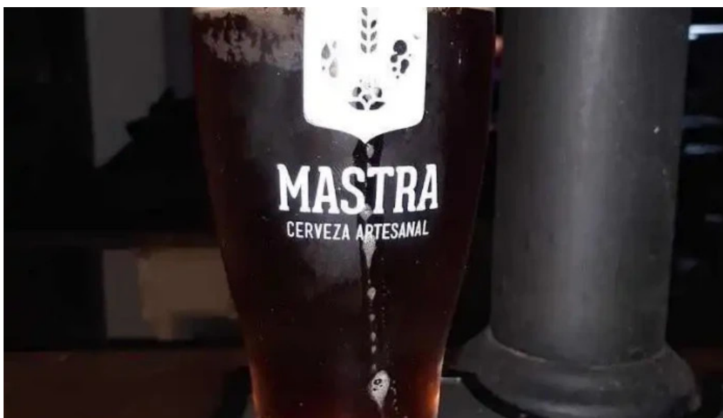
La cocina del club comida y bebida