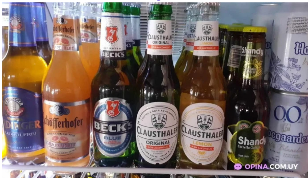
La cocina del club toledo