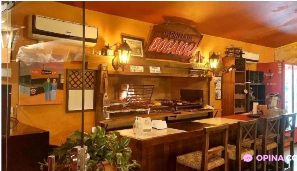
La chispa del sabor maldonado