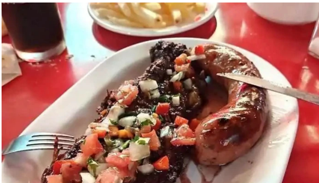
La chispa del sabor comida y bebida