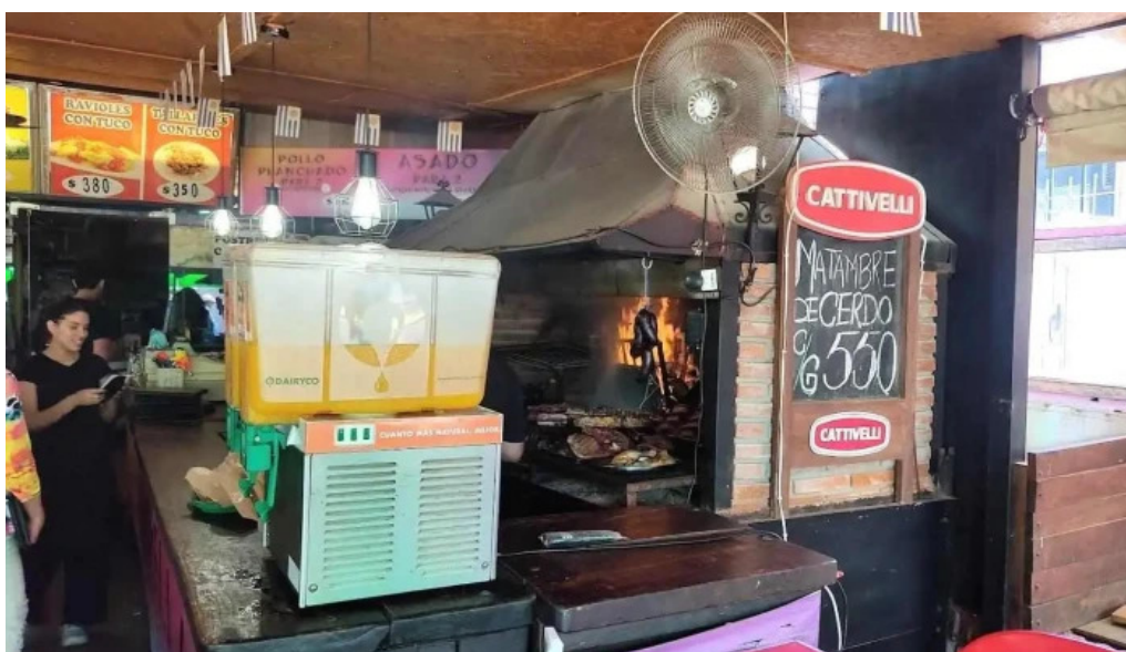
La chispa del sabor ambiente