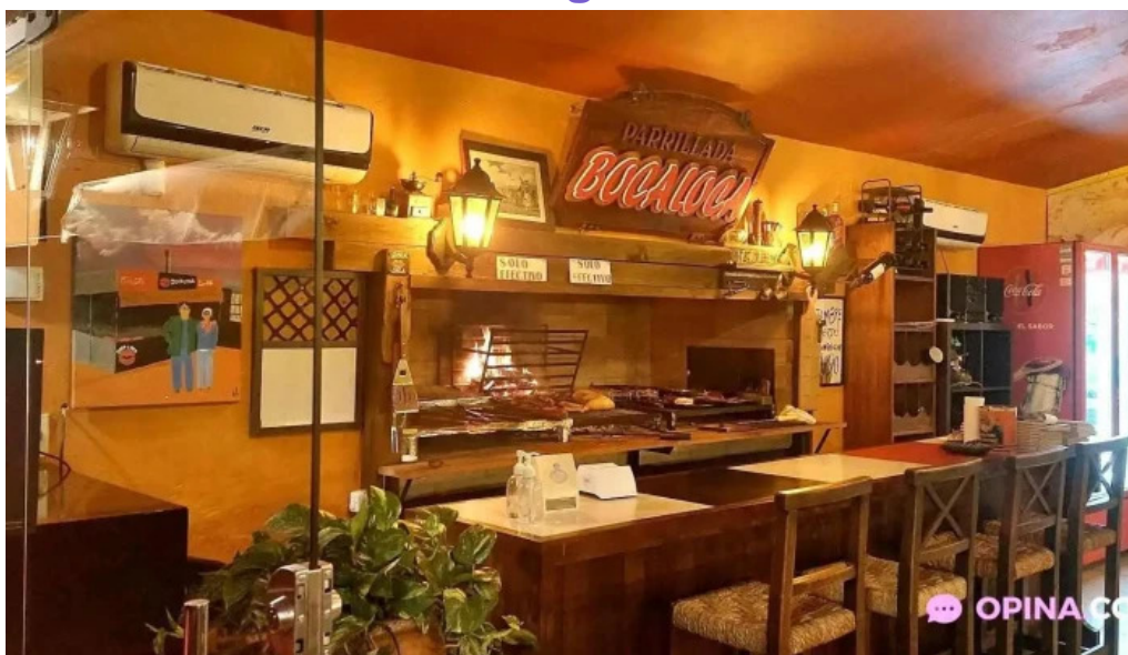
La chispa del sabor todas