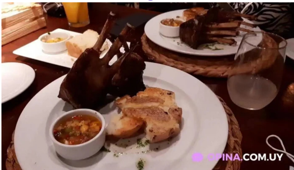
La casa violeta videos