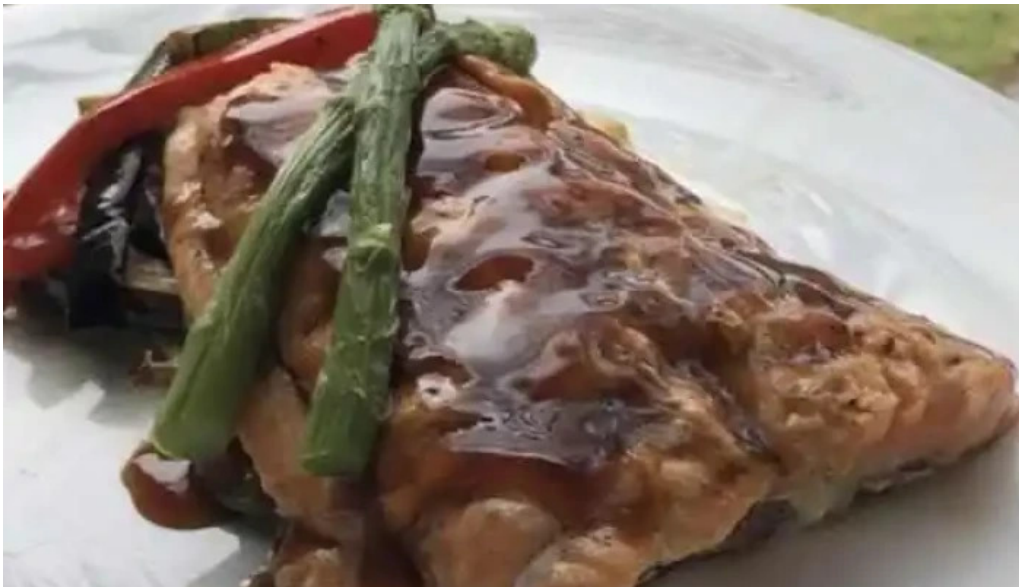
La casa violeta comida y bebida