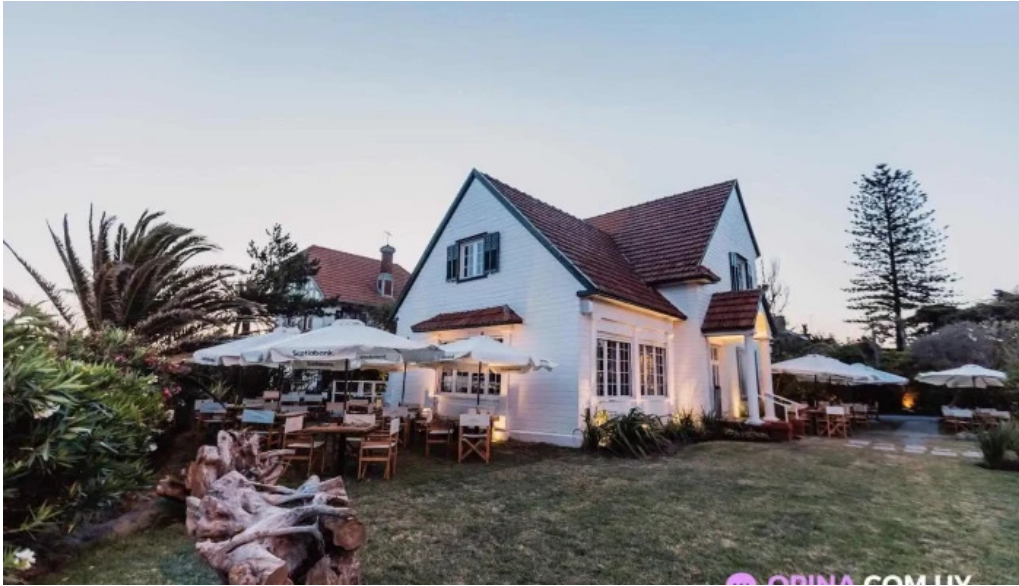
La casa violeta del propietario