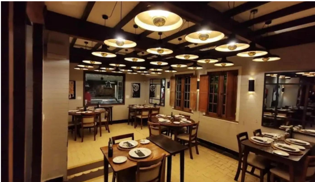
La casa violeta montevideo