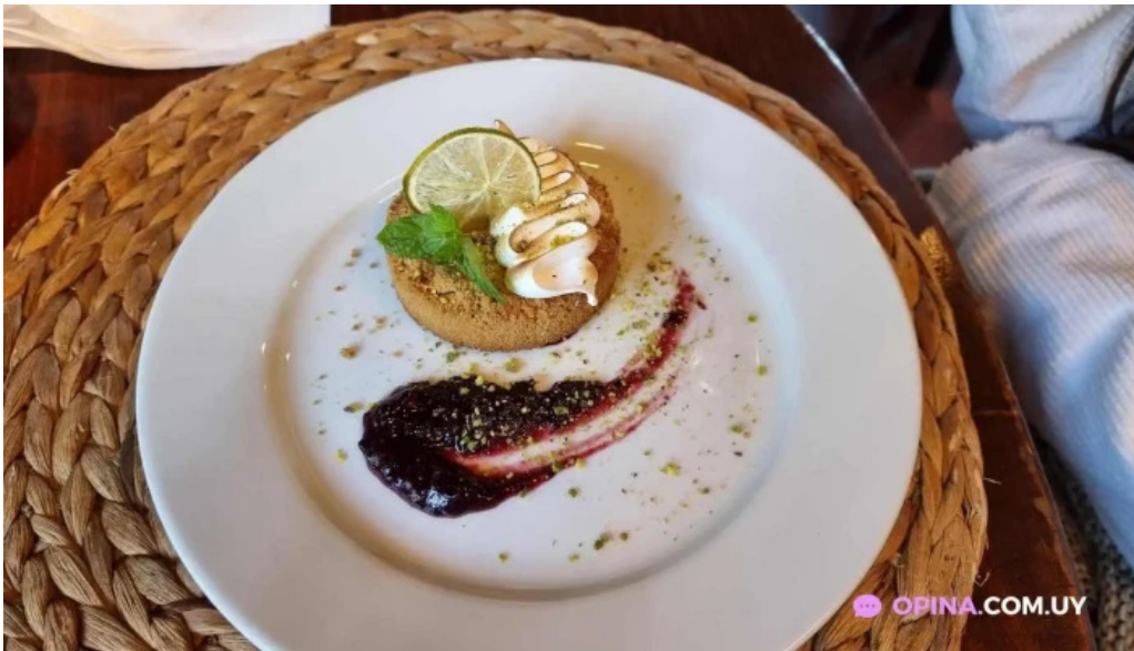
La casa violeta tarta de lima