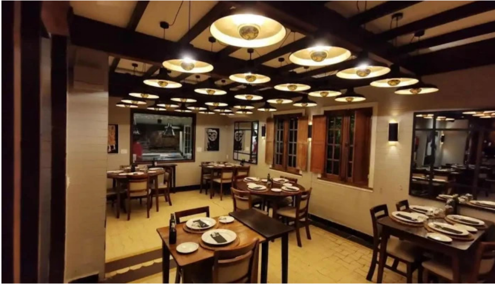
La casa violeta todas