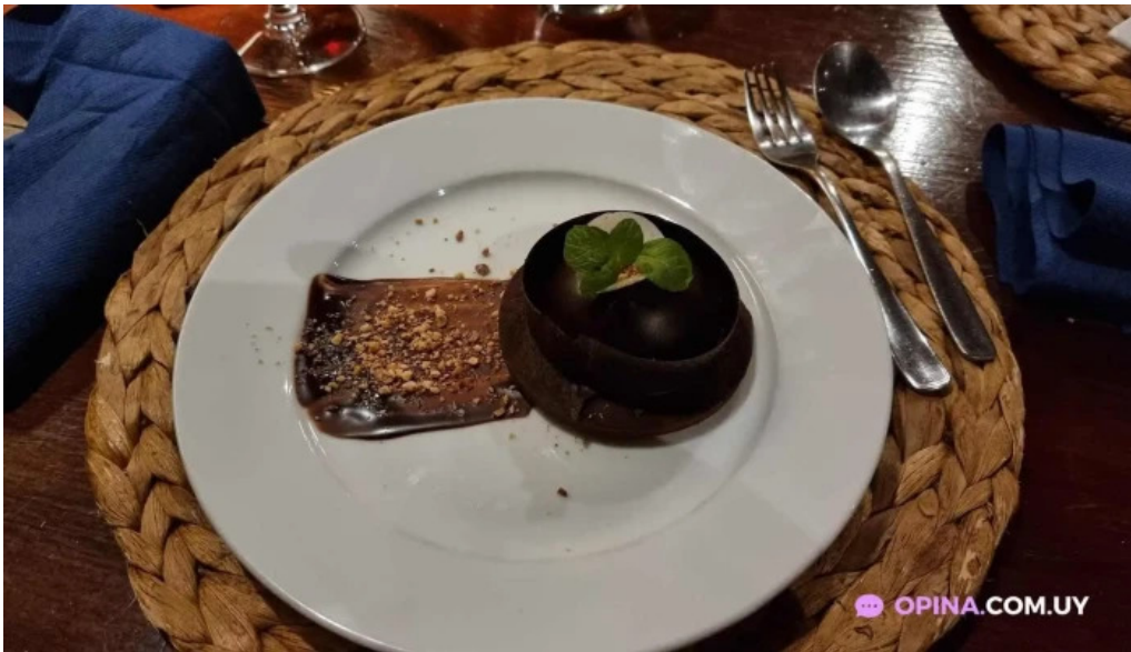
La casa violeta tarta de chocolate