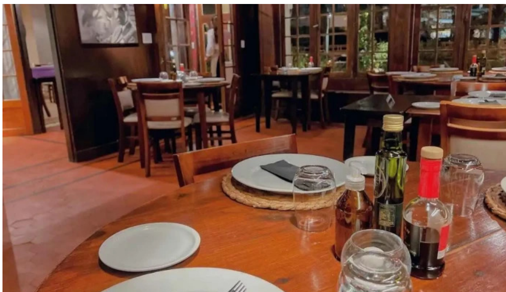
La casa violeta ambiente