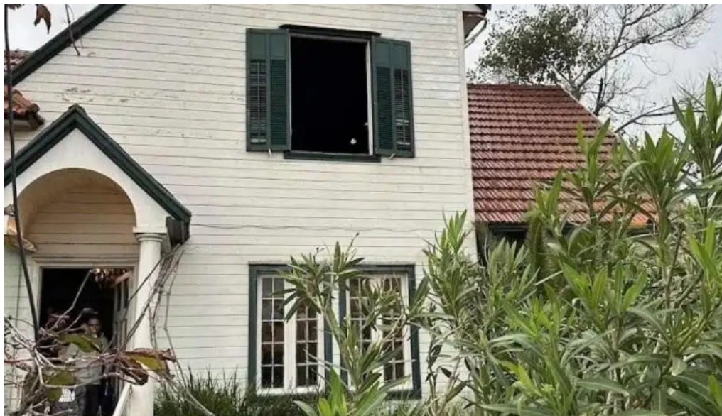
La casa violeta mas recientes