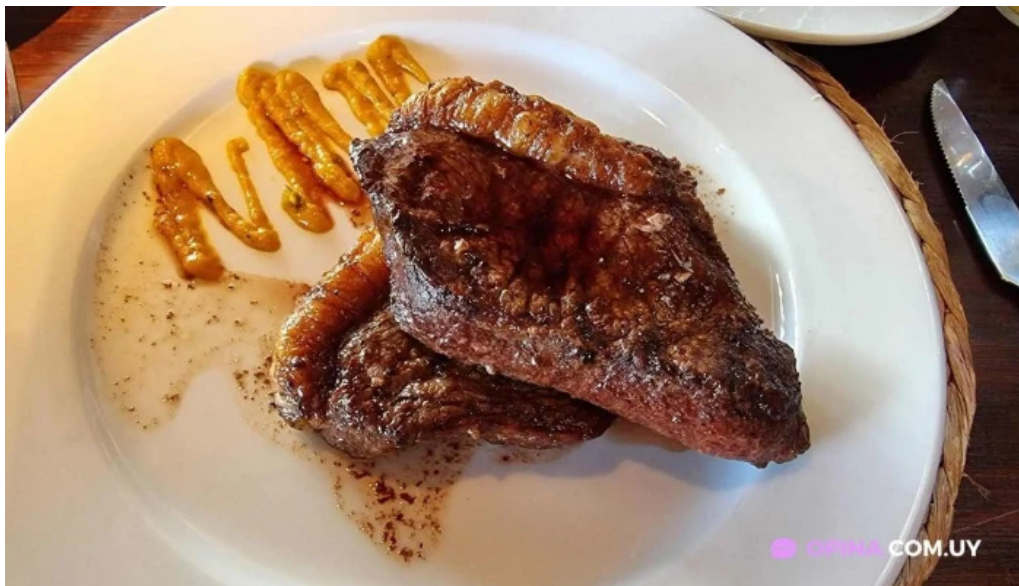
La casa violeta filete