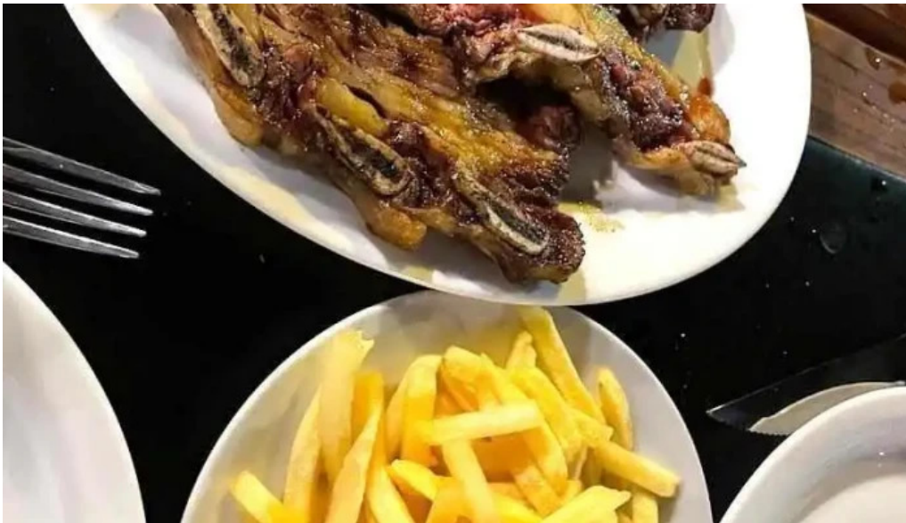
La cantina del giglio el asador papas fritas