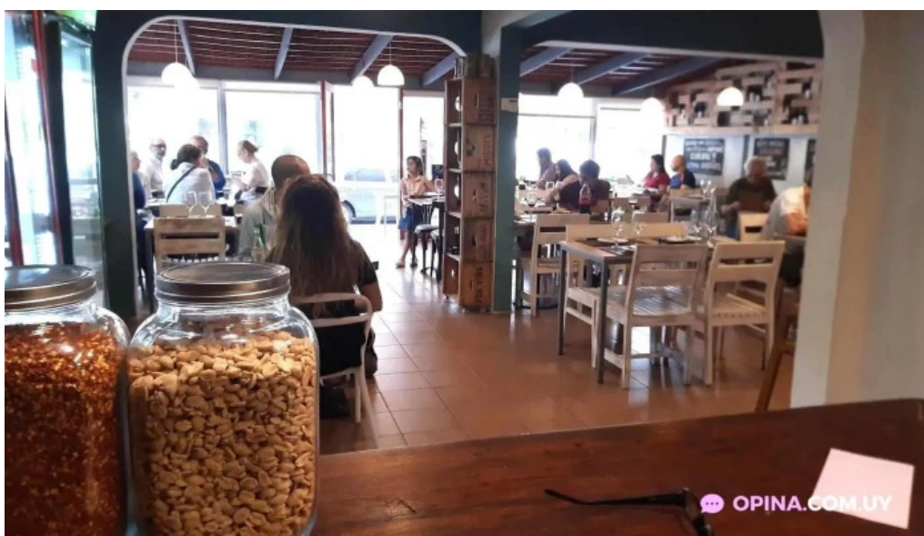
La cantina del giglio el asador ambiente