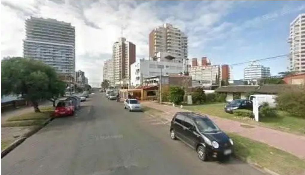
La cantina del giglio el asador street view y 360