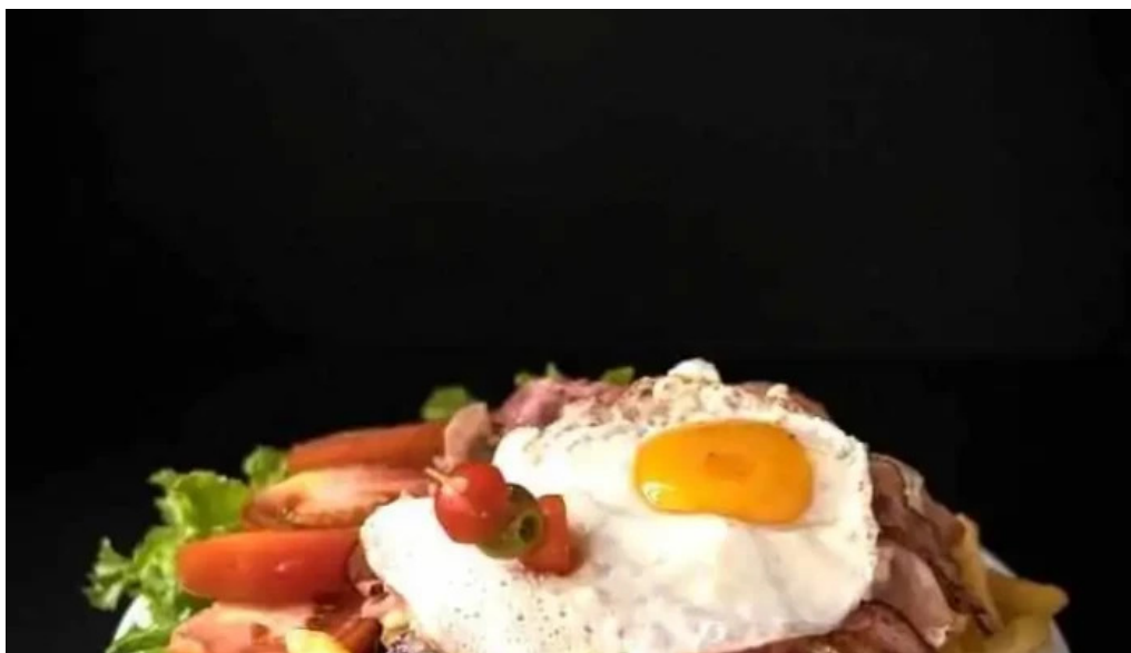
La cantina del giglio el asador comida y bebida