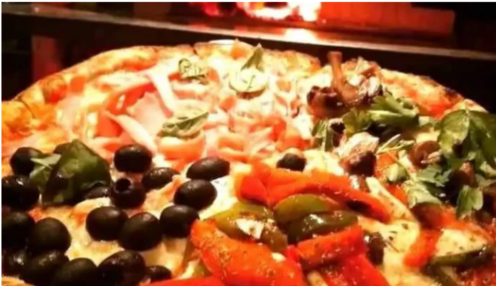
La cantina del giglio el asador del propietario