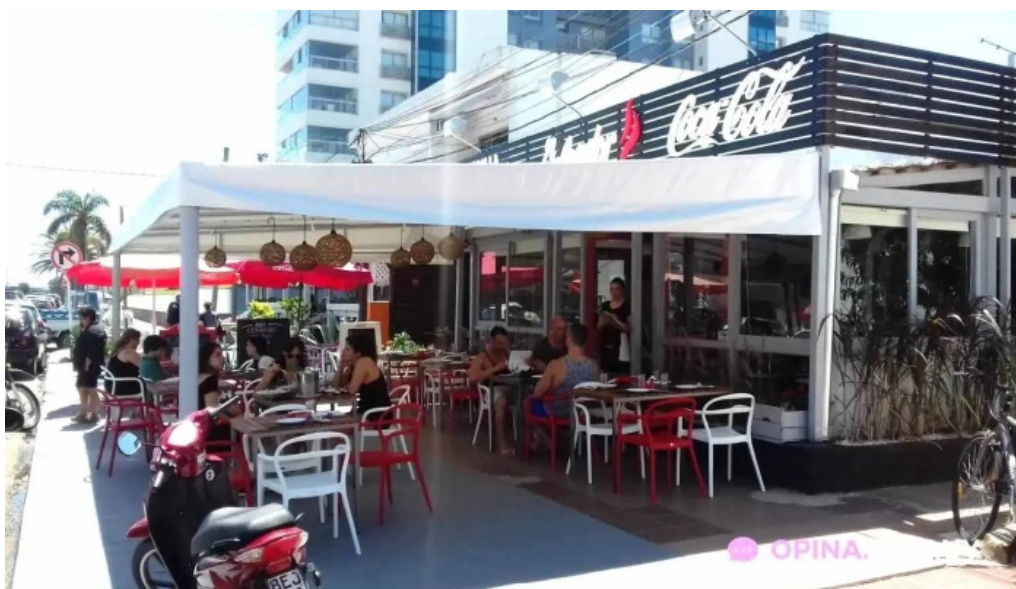
La cantina del giglio el asador todas