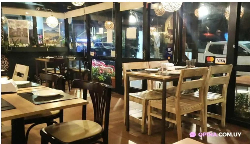
La cantina del giglio el asador videos