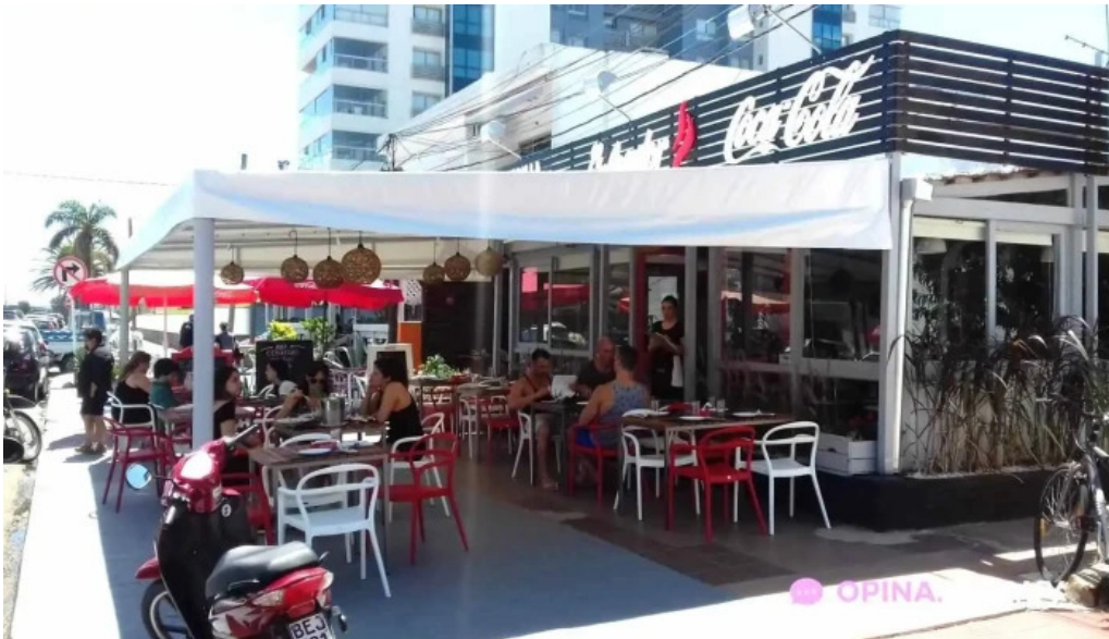
La cantina del giglio el asador punta del este