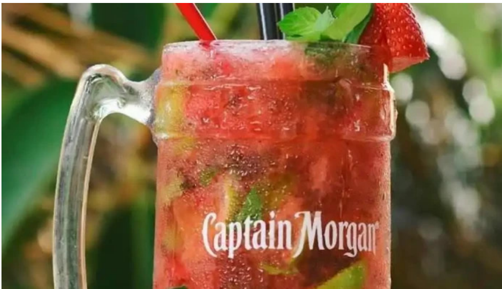
Mojito resto del propietario