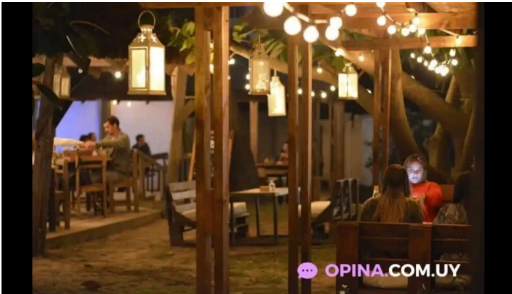
Mojito resto la aguada y costa azul