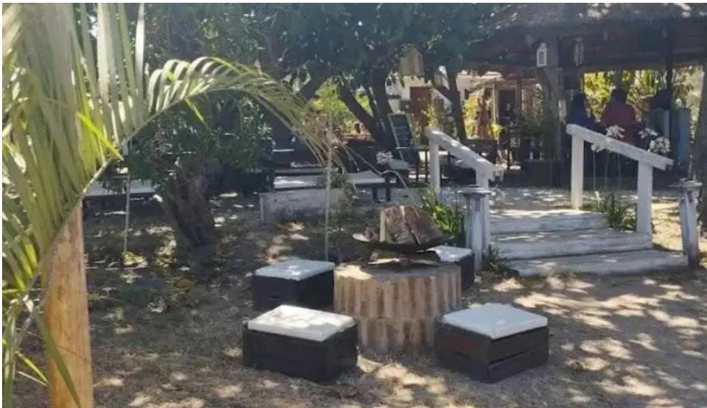
Mojito resto ambiente