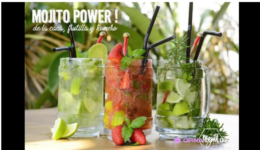
Mojito resto mojito