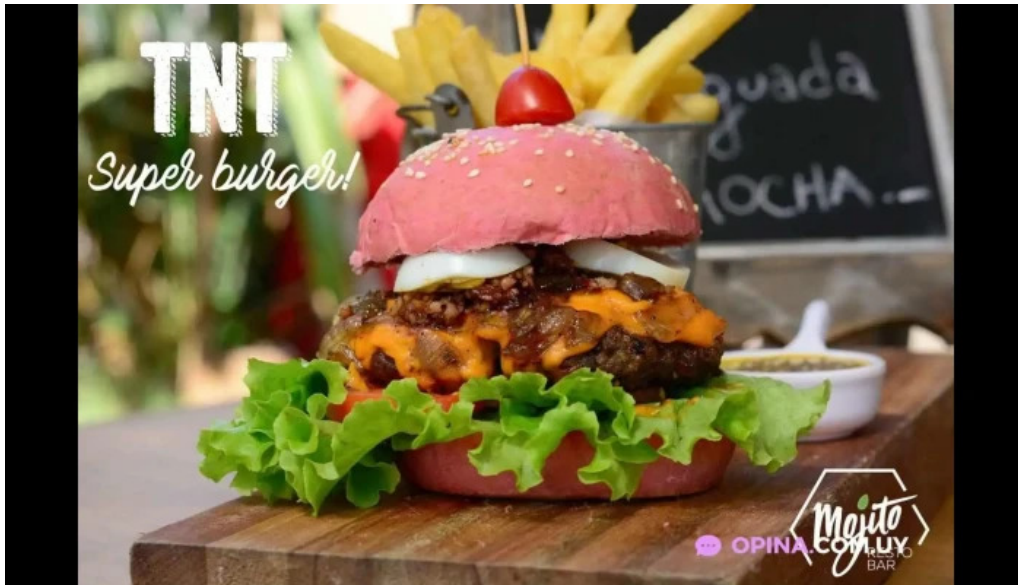
Mojito resto comida y bebida