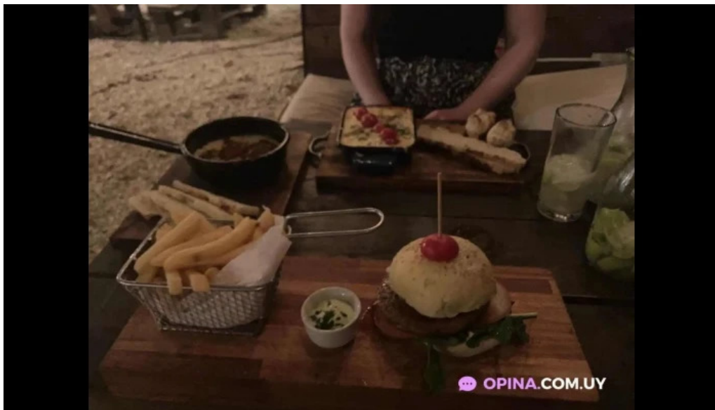
Mojito resto papas fritas