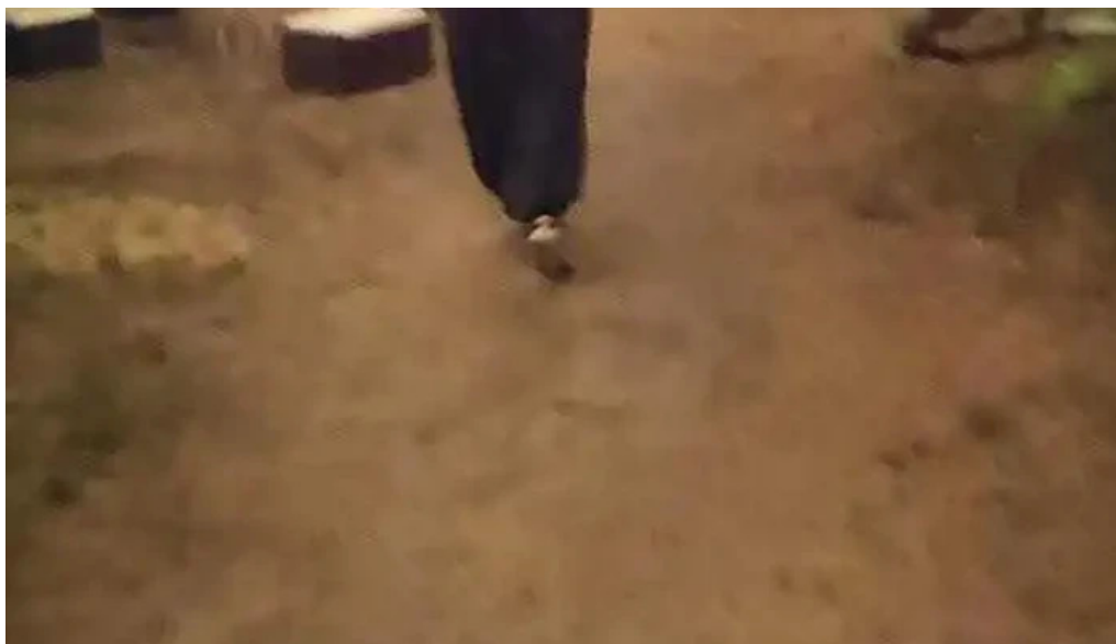
Mojito resto videos