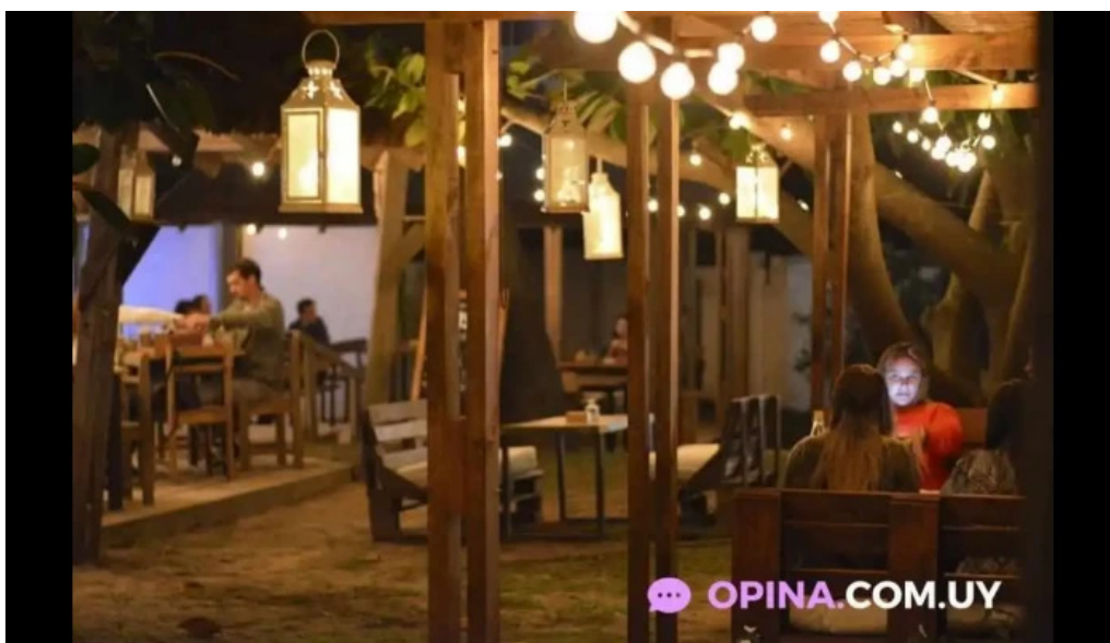
Mojito resto todas