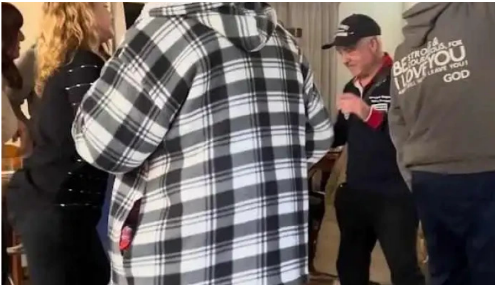
L osteria acqua videos