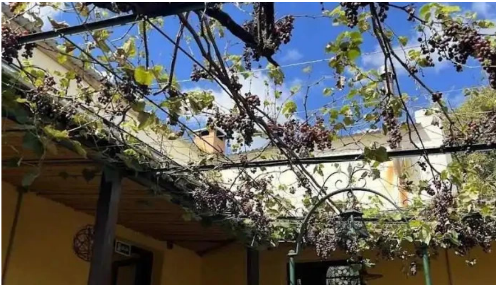
L osteria aigua mas recientes