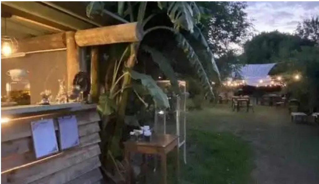
L osteria agua del propietario