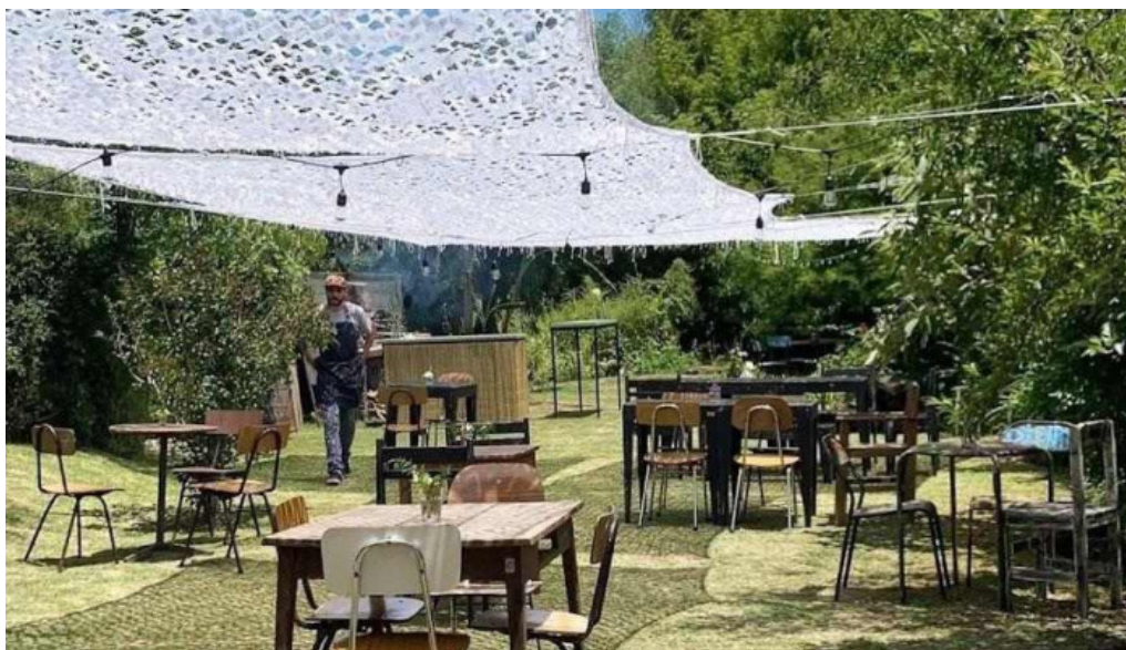
L osteria agua agua