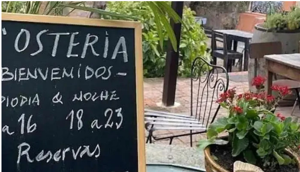
L osteria aigua menu