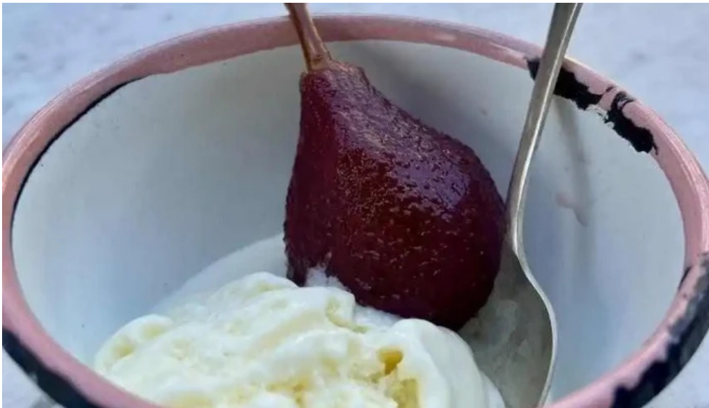
L osteria aigua comida y bebida