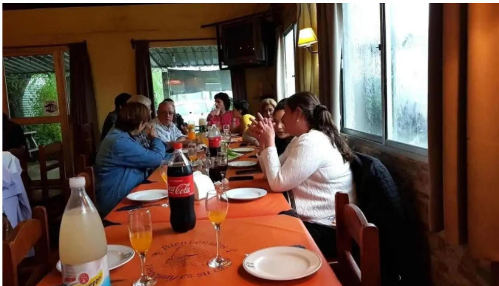
Kamote parrillada florencio sanchez