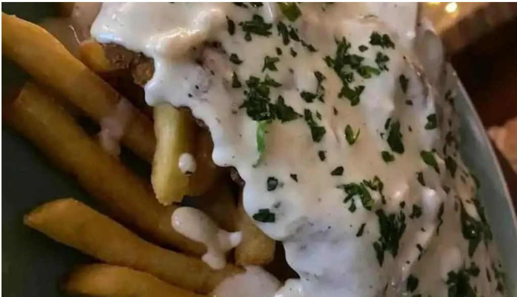
Kamote parrillada papas fritas