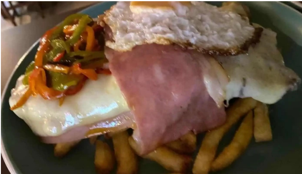
Kamote parrillada del propietario