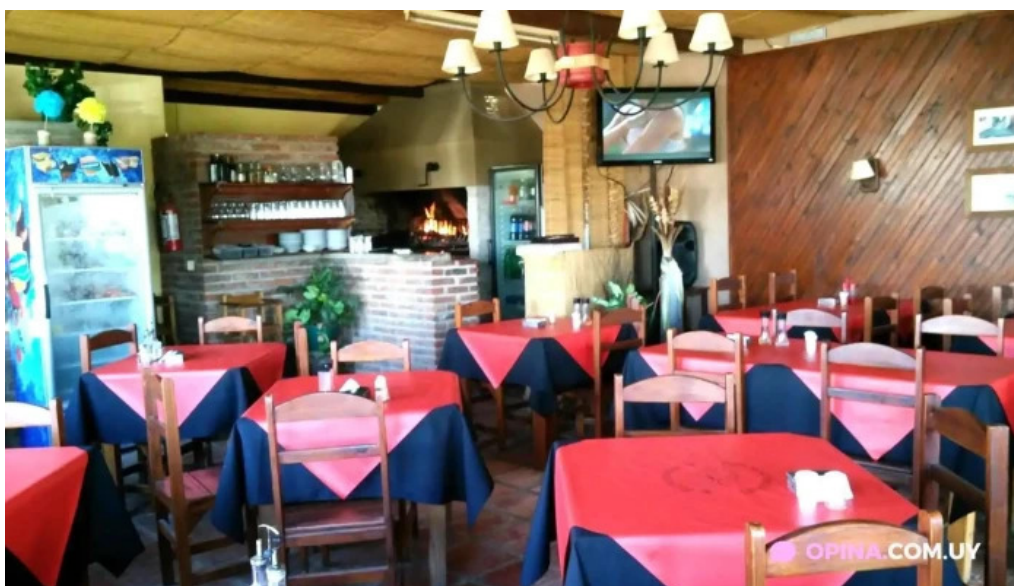
Kamote parrillada ambiente