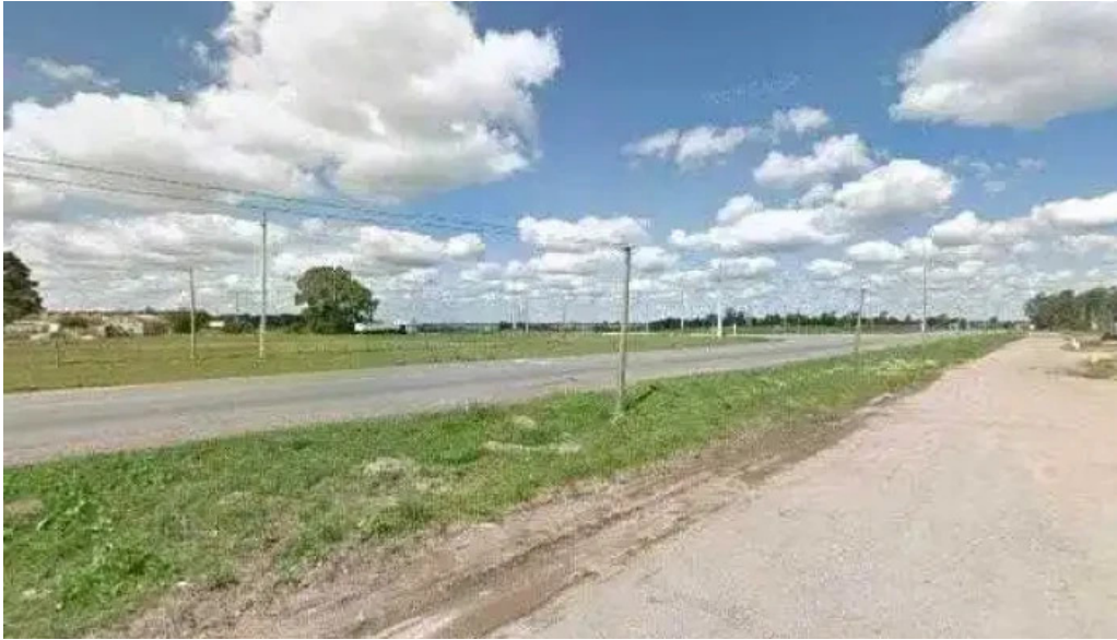
Kamote parrillada street view y 360