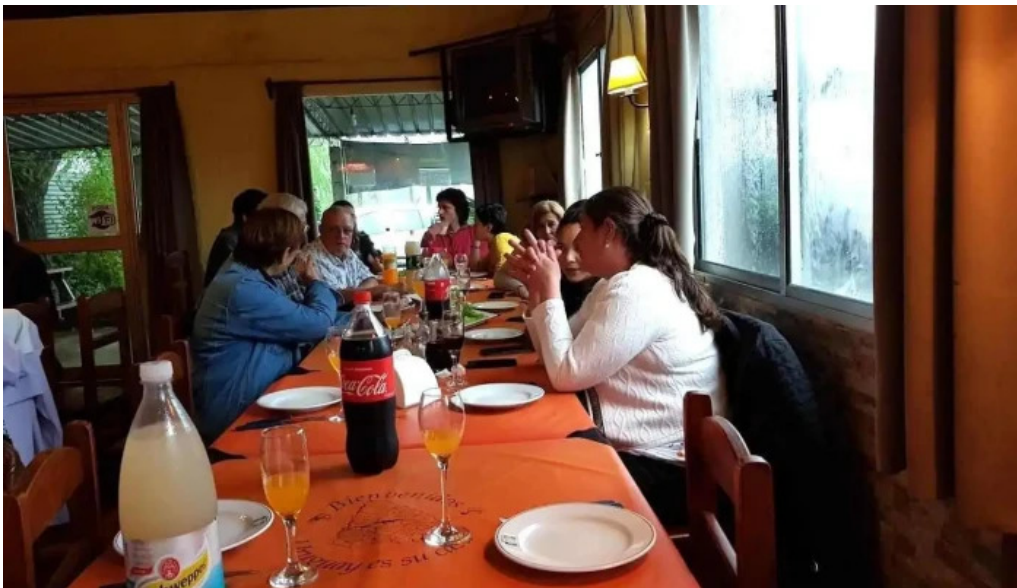
Kamote parrillada todas