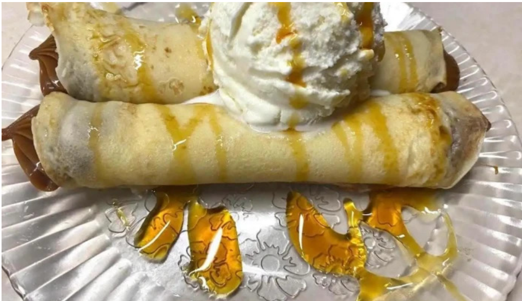
Kamote parrillada comida y bebida