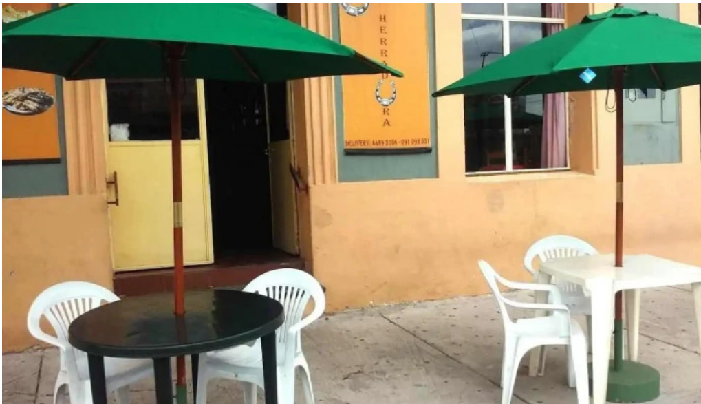
La herradura todas