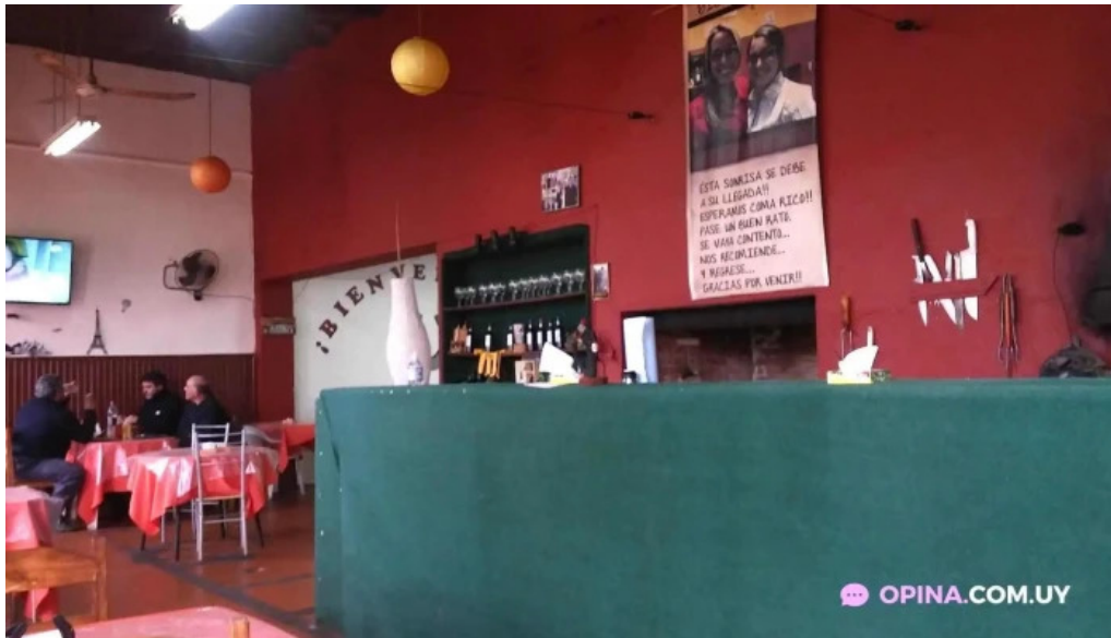
La herradura ambiente