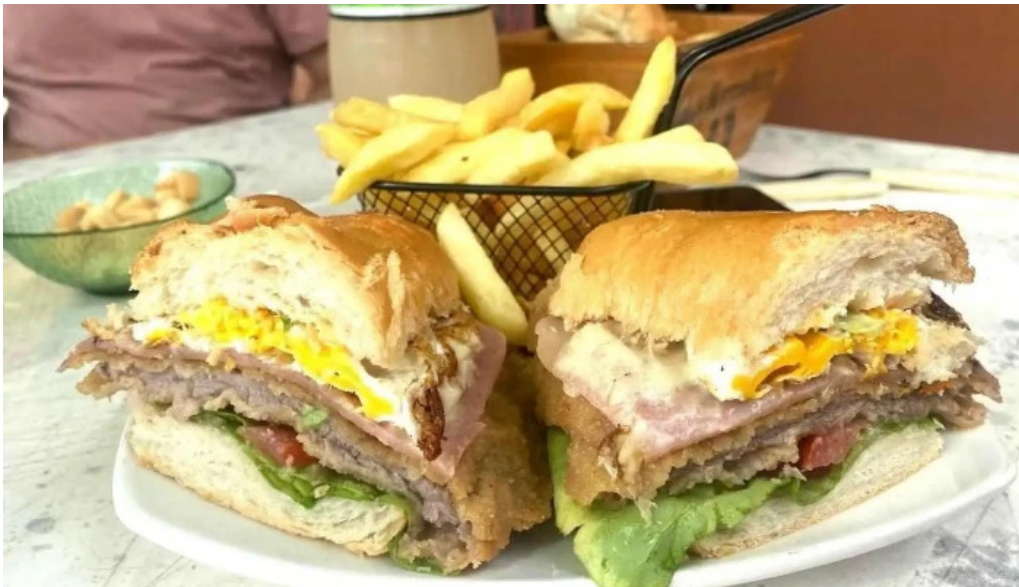
La herradura comida y bebida