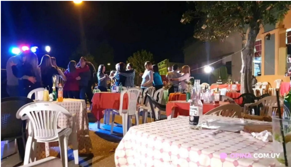
La herradura videos