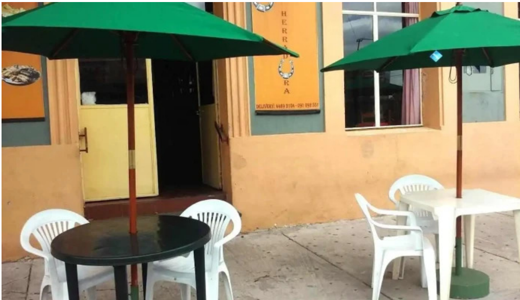
La herradura jose batlle y ordonez