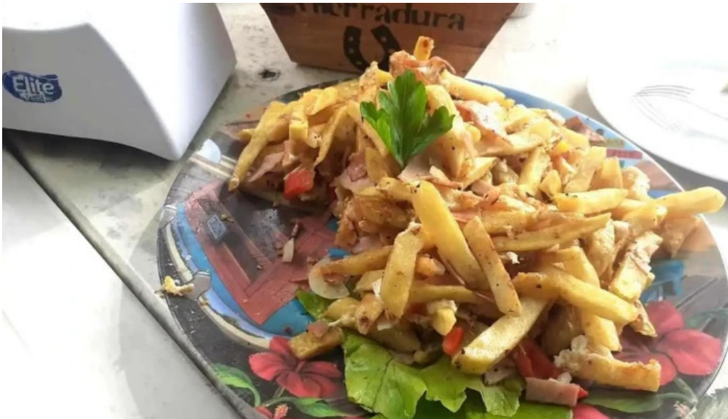
La herradura papas fritas