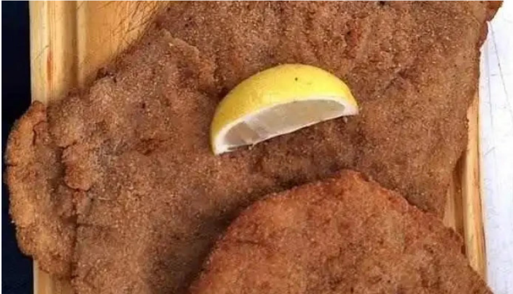
La herradura mas recientes