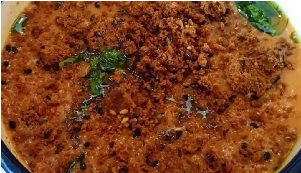
Jacinto sopa de tomate