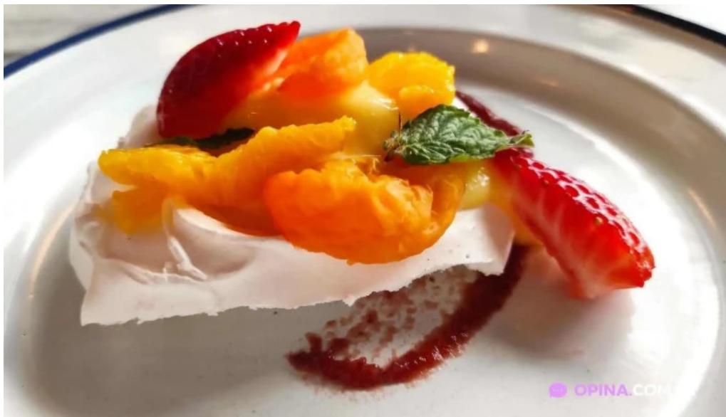
Jacinto comida y bebida