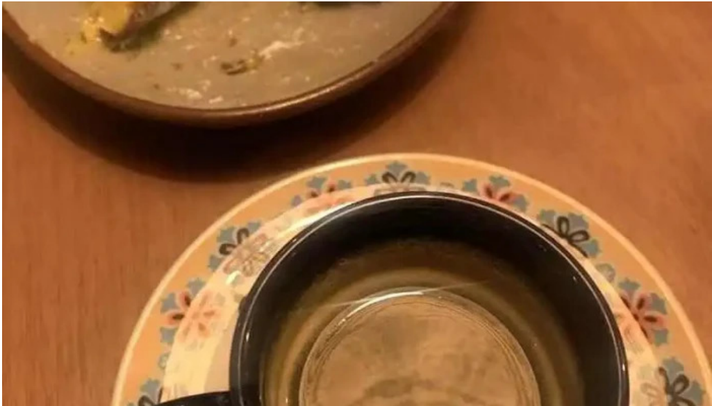
Ithaka mas recientes