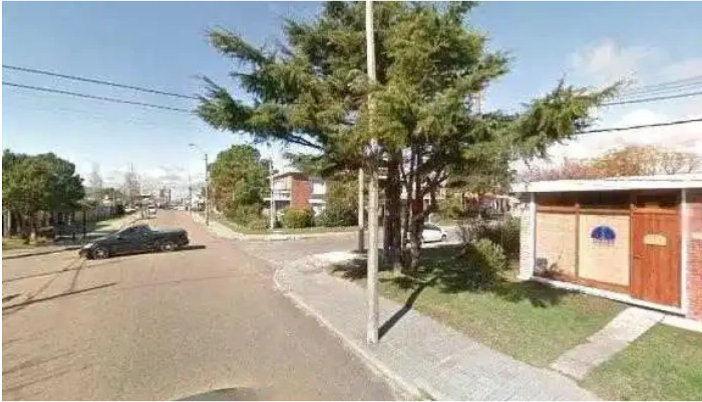
Ithaca street view y 360