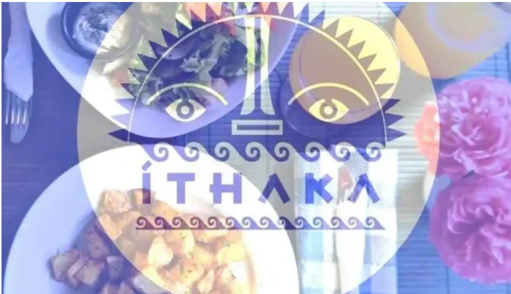
Ithaka del propietario