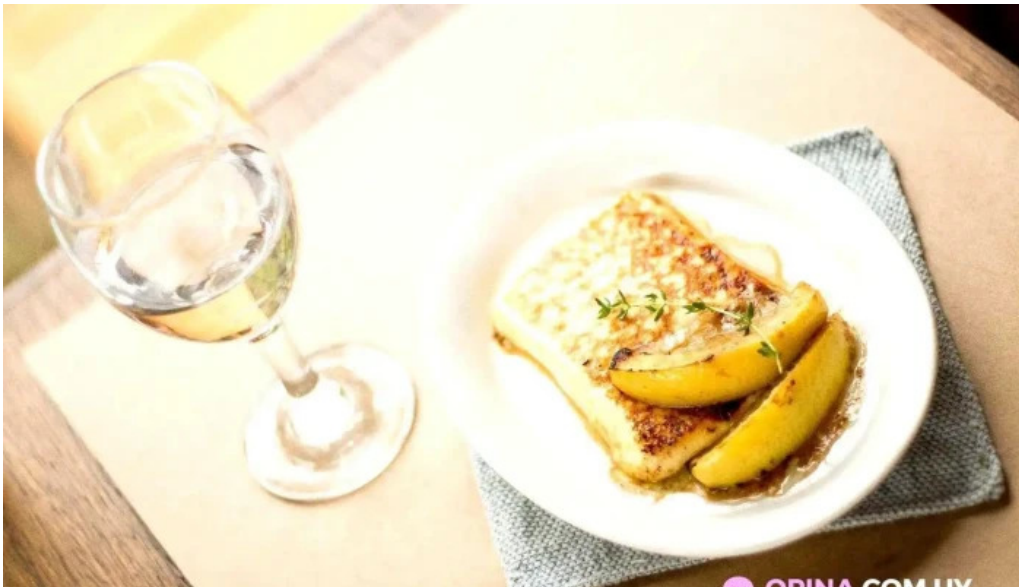
Ithaka comida y bebida