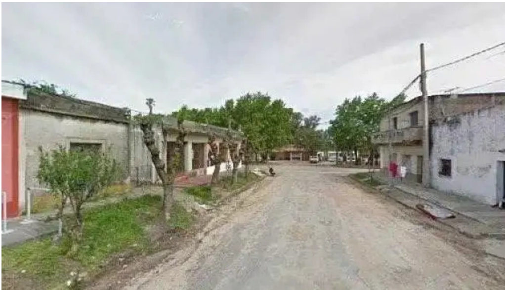
Ignacio barrios todas