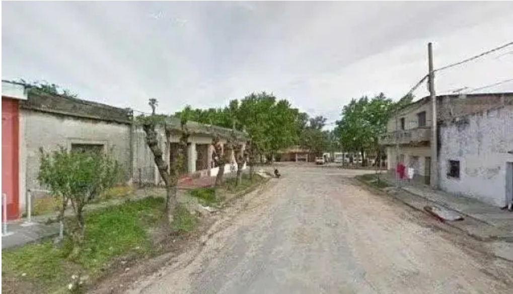
Ignacio barrios street view y 360