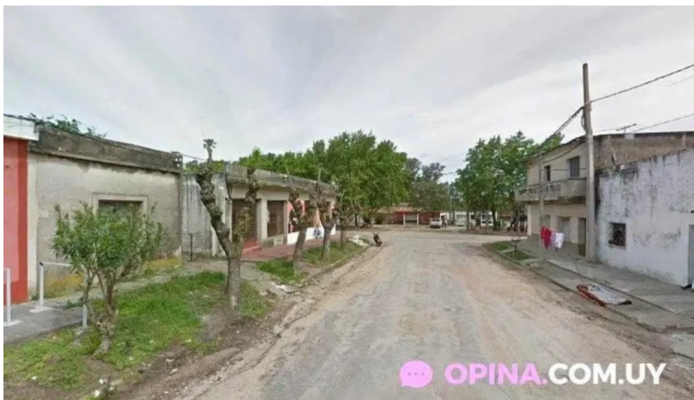
Ignacio barrios 25 de agosto