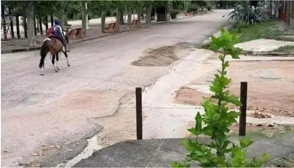
Ignacio barrios videos