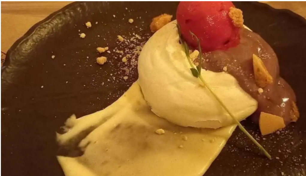
Hugo soca cocina casera panna cotta