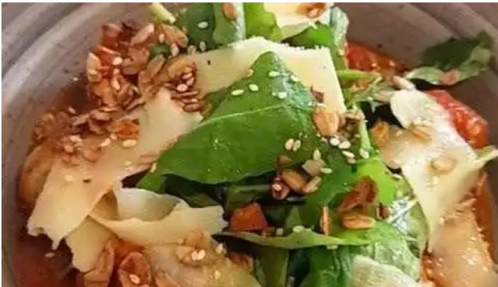
Hugo soca cocina casera videos