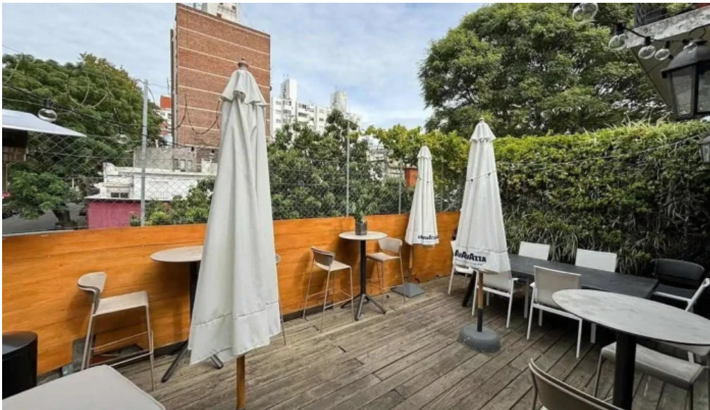
Hugo soca cocina casera montevideo