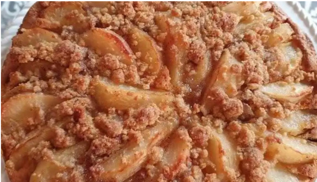
Hugo soca cocina casera del propietario