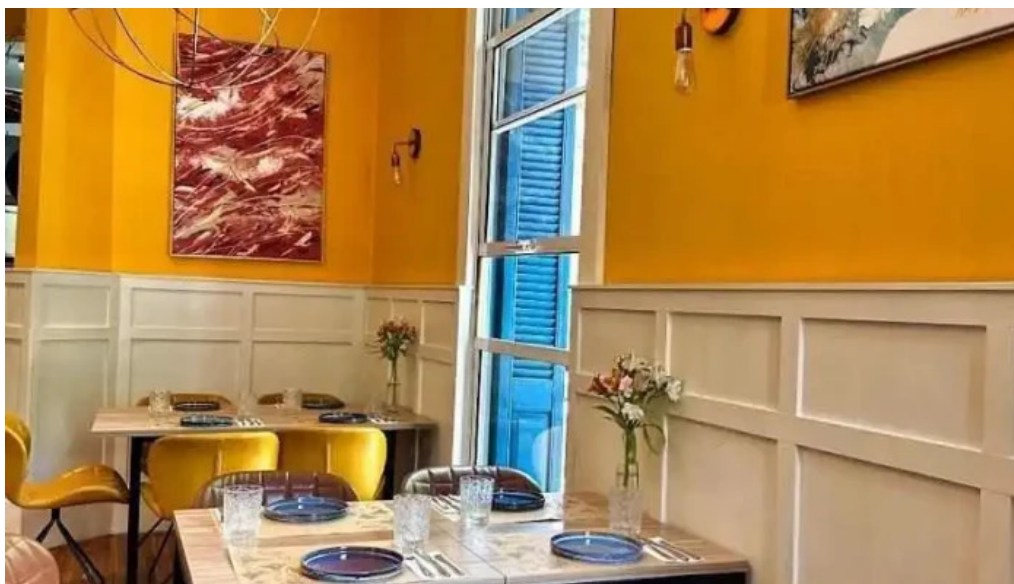
Hugo soca cocina casera ambiente