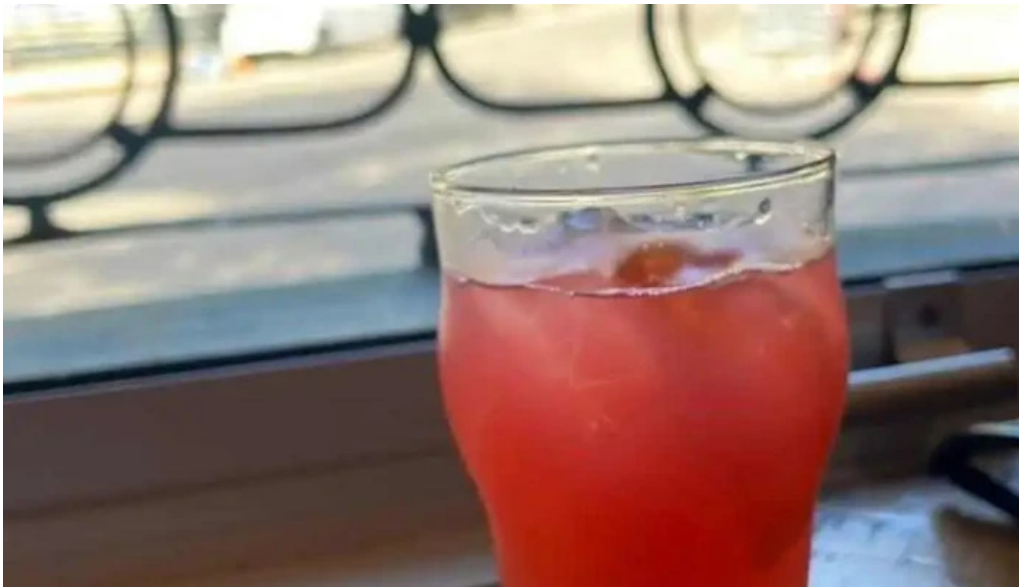
Hugo soca cocina casera mas recientes