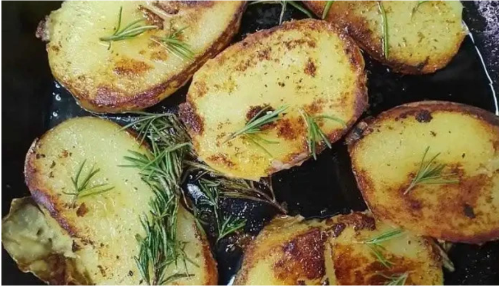
Hugo soca cocina casera comida y bebida