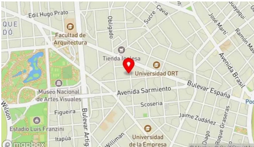
Hugo soca cocina casera mapa