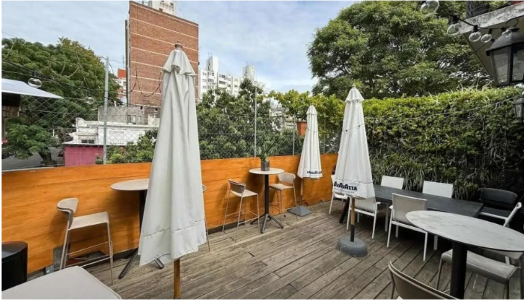
Hugo soca cocina casera todas