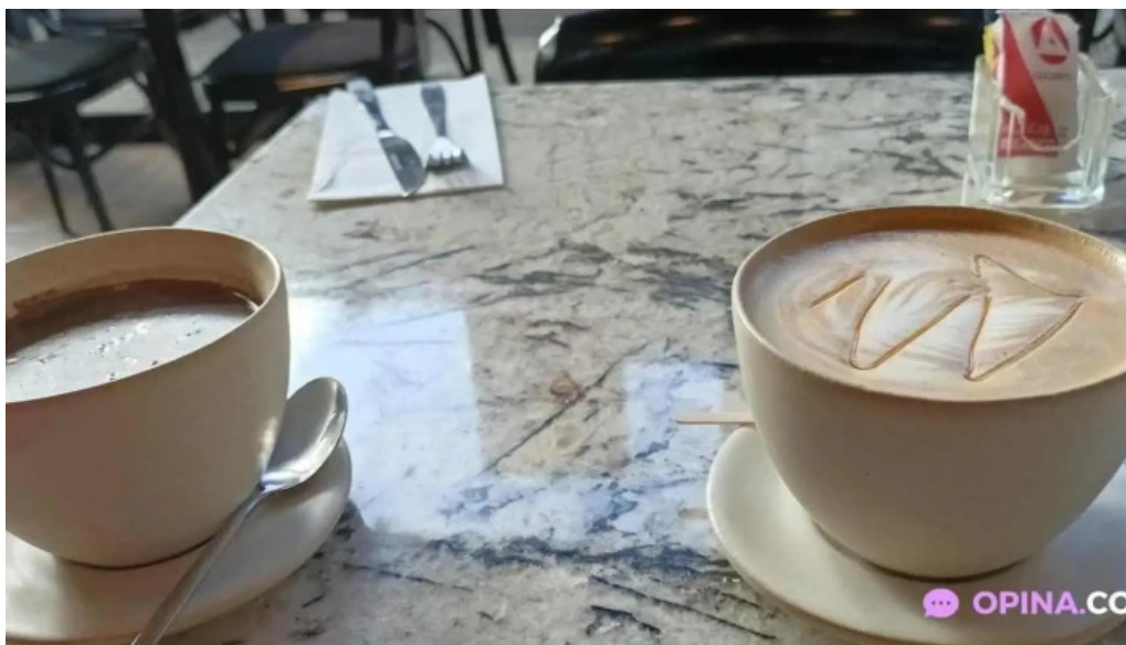
Hoy te quiero capuchino