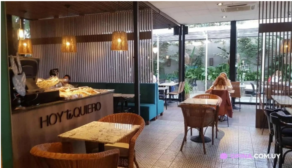
Hoy te quiero todas