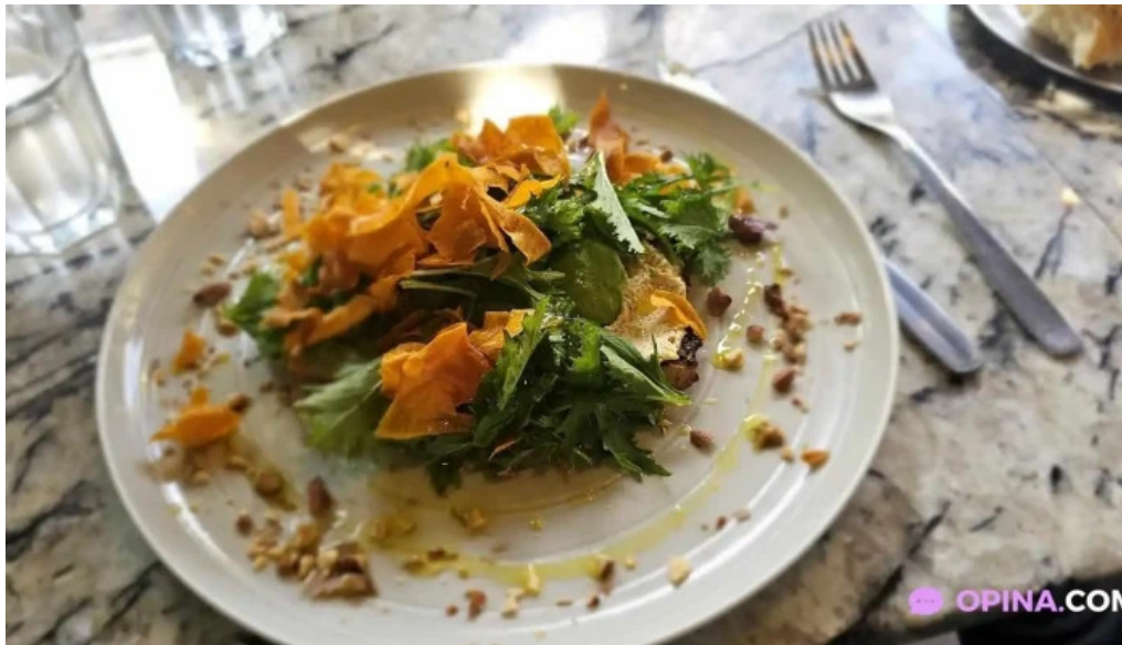
Hoy te quiero mas recientes