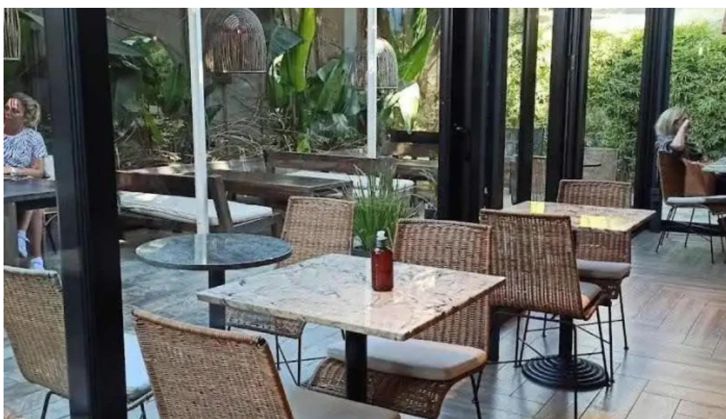
Hoy te quiero ambiente