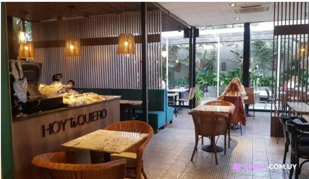
Hoy te quiero montevideo