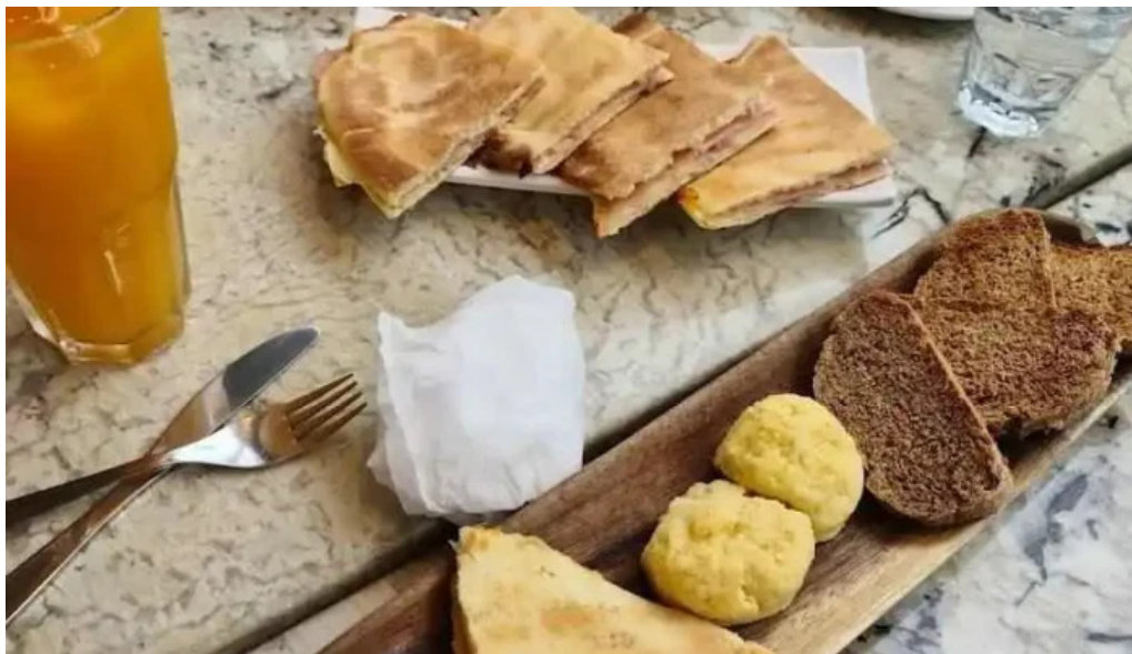
Hoy te quiero comida y bebida