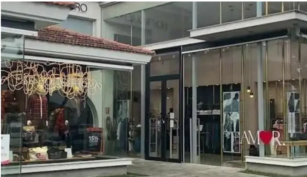
Hoy te quiero videos