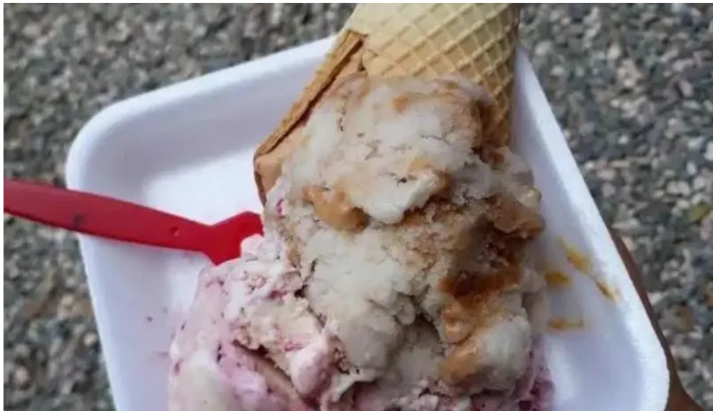
Heladería comida y bebida