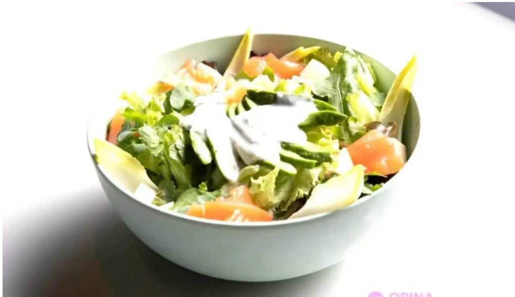
Green to go comida y bebida