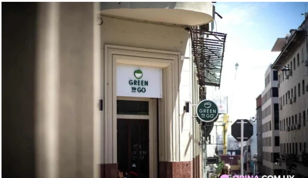
Green to go todas