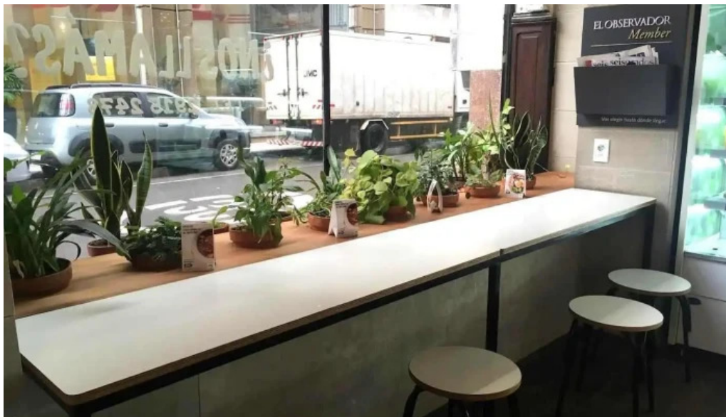
Green to go ambiente