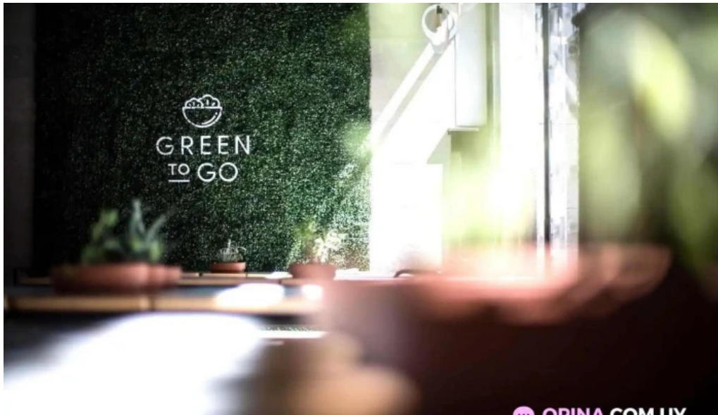
Green to go del propietario