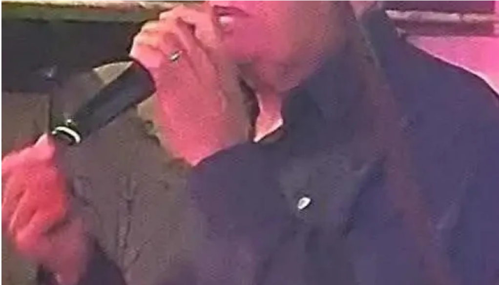
El paragua videos