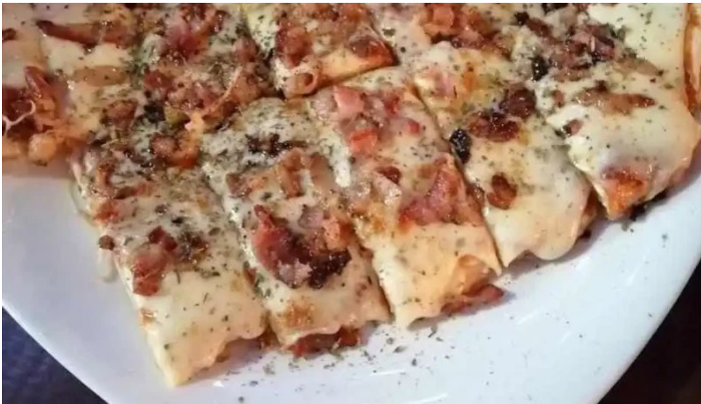
El paragua fray bentos