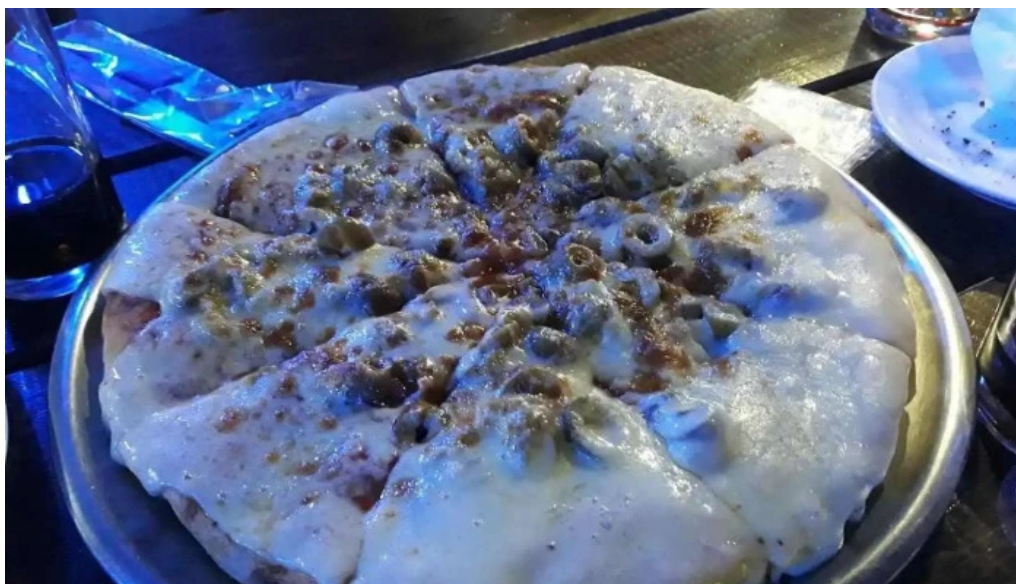
El paragua comida y bebida