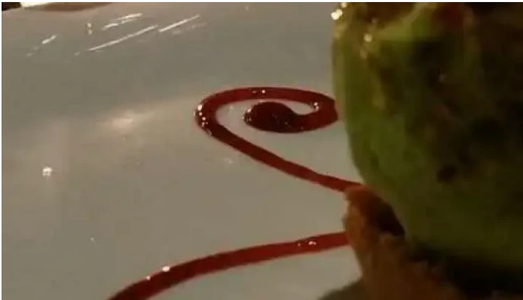
Fish market carrasco videos