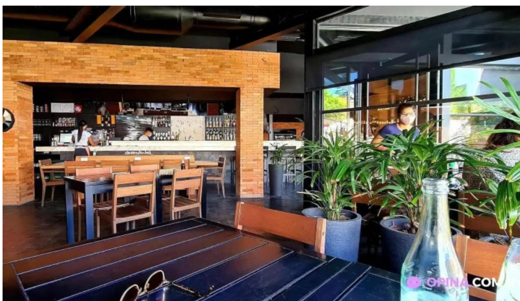
Fish market carrasco ambiente