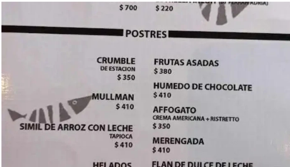
Fish market carrasco menu