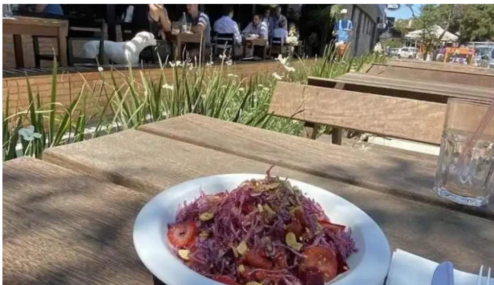
Fish market carrasco comida y bebida