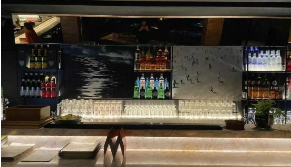
Fish market carrasco montevideo