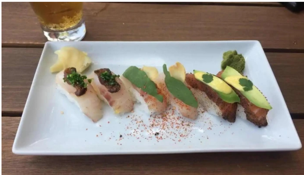
Fish market carrasco del propietario