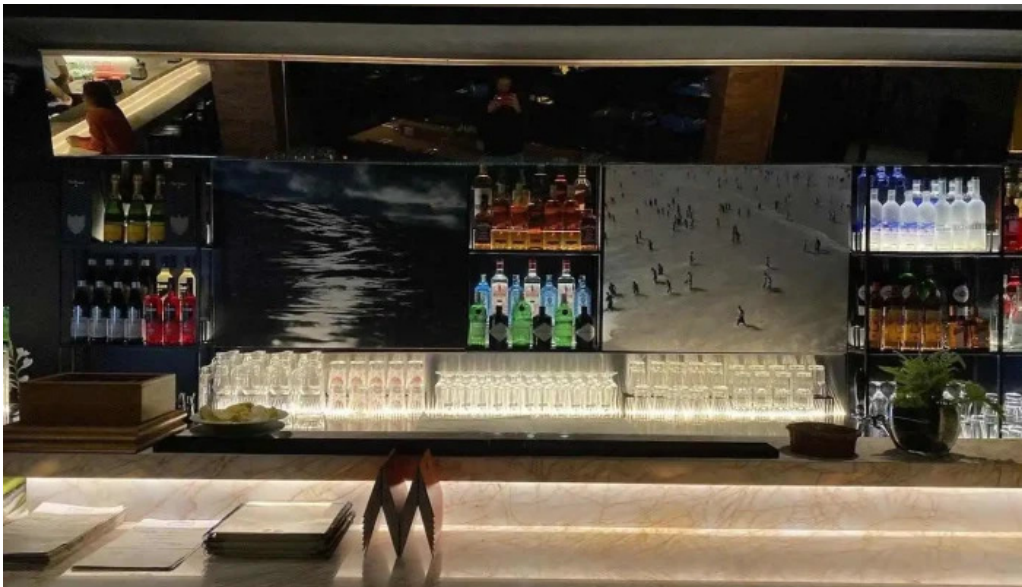
Fish market carrasco todas