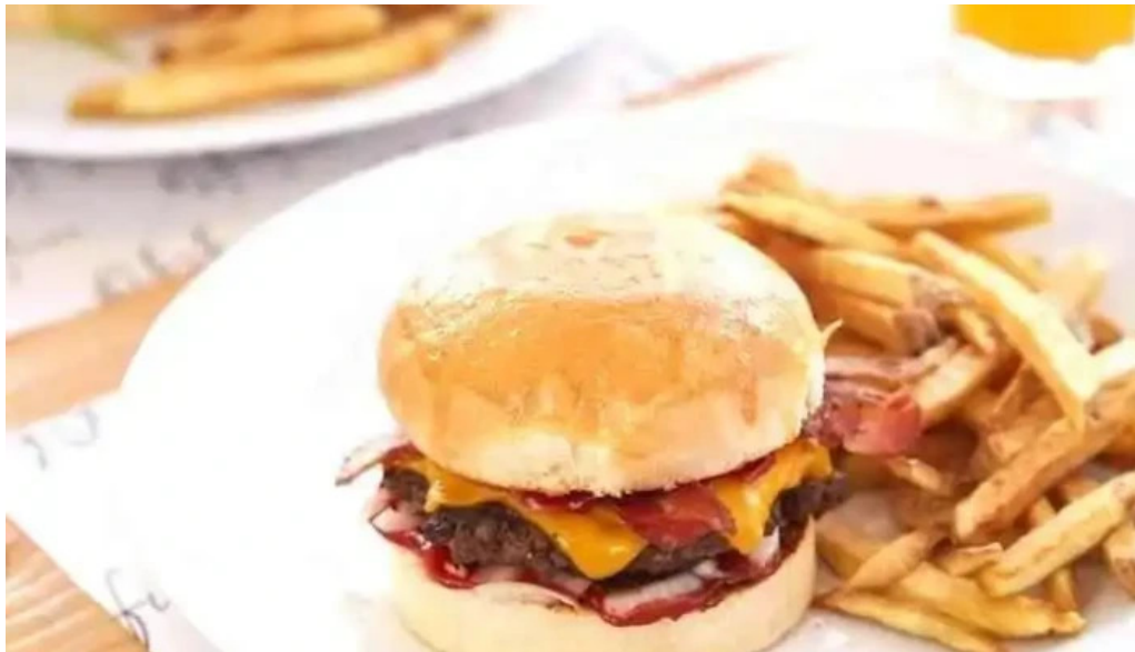
Fifty fifty papas fritas