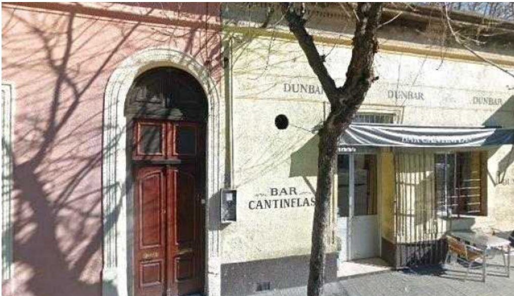
Fifty fifty street view y 360