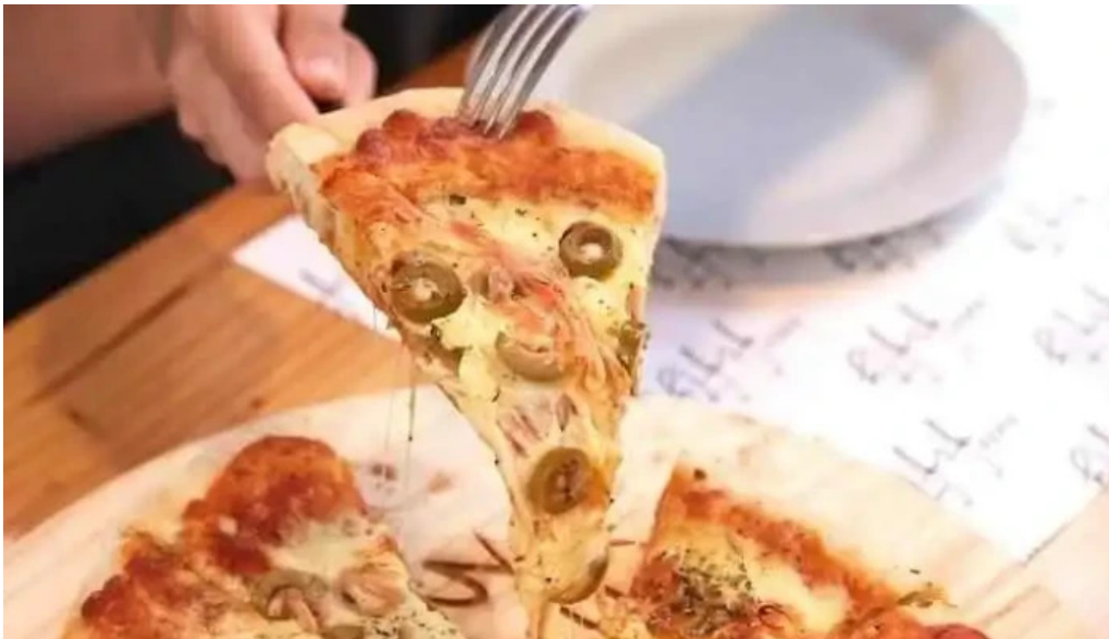
Fifty fifty del propietario