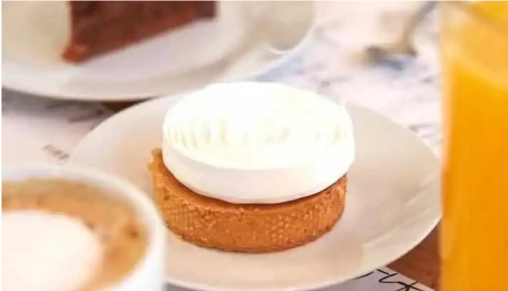
Fifty fifty comida y bebida