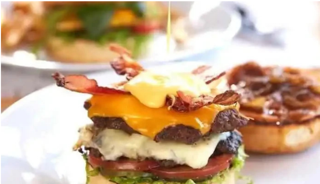
Fifty fifty san jose de mayo