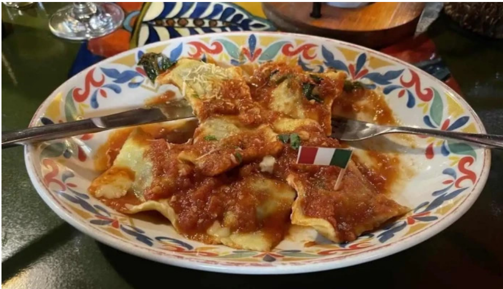
Fellini pocitos mas recientes