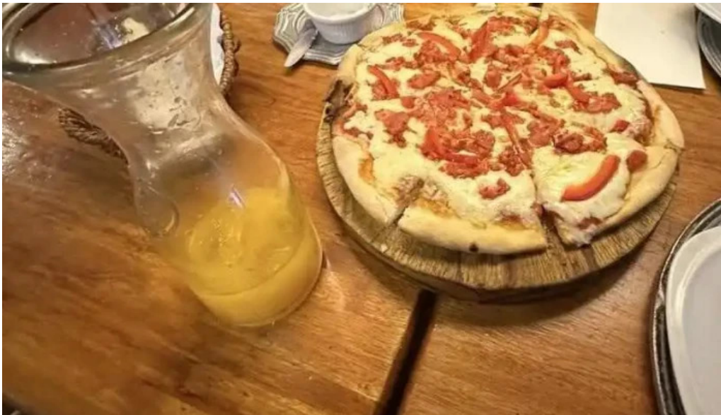
Fellini pocitos pizza