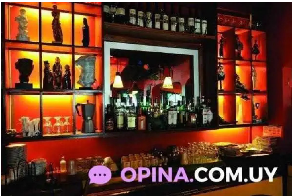
Fellini pocitos ambiente