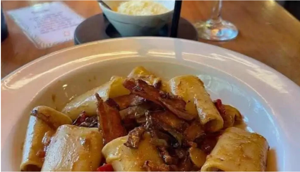
Fellini pocitos pappardelle