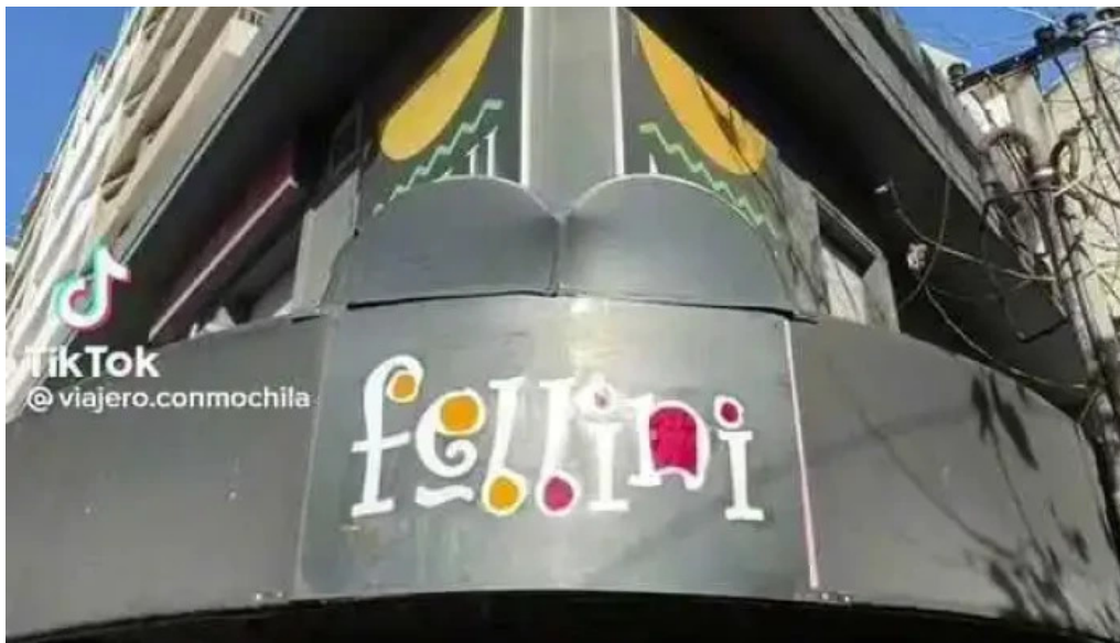
Fellini pocitos videos