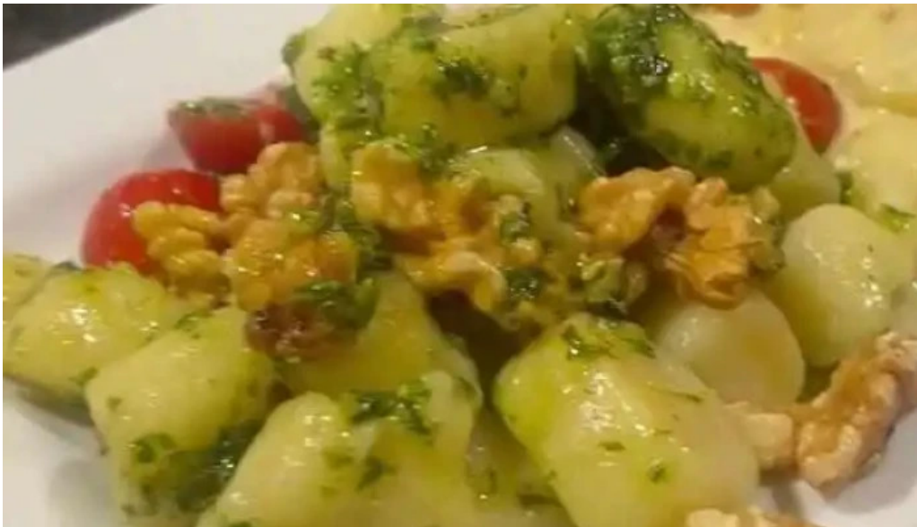
Fellini pocitos del propietario