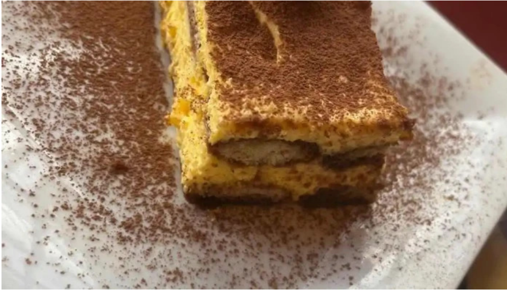
Fellini pocitos tiramisu