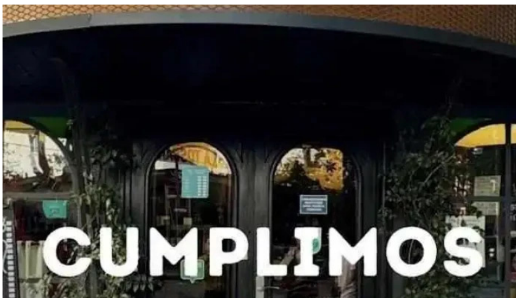
Fellini pocitos todas