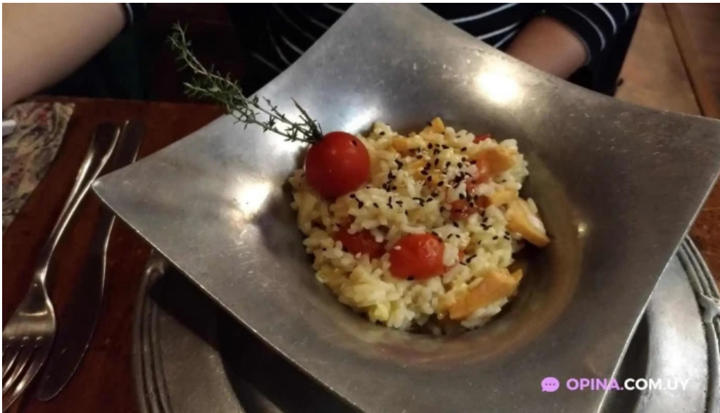
Fellini pocitos risotto