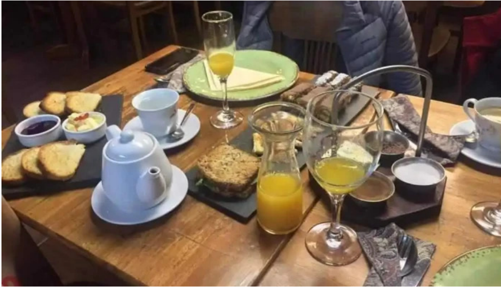
Fellini pocitos jugo