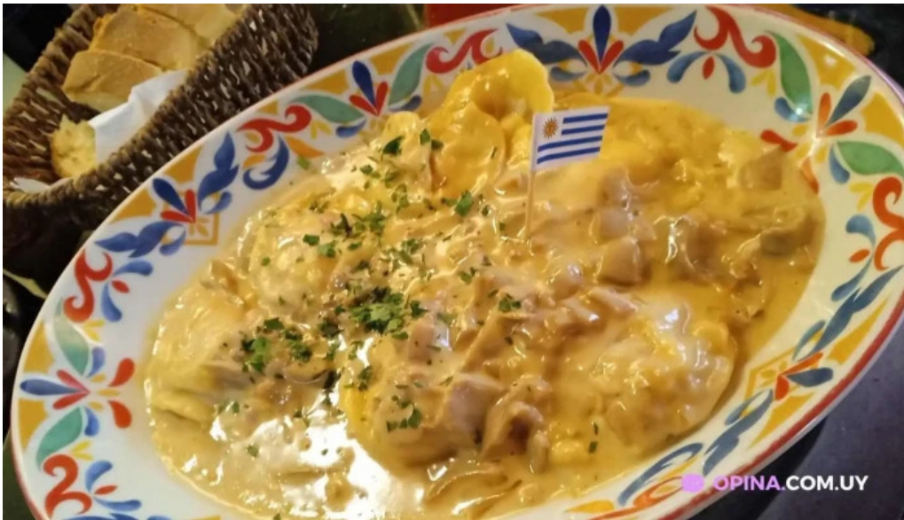
Fellini pocitos ravioli