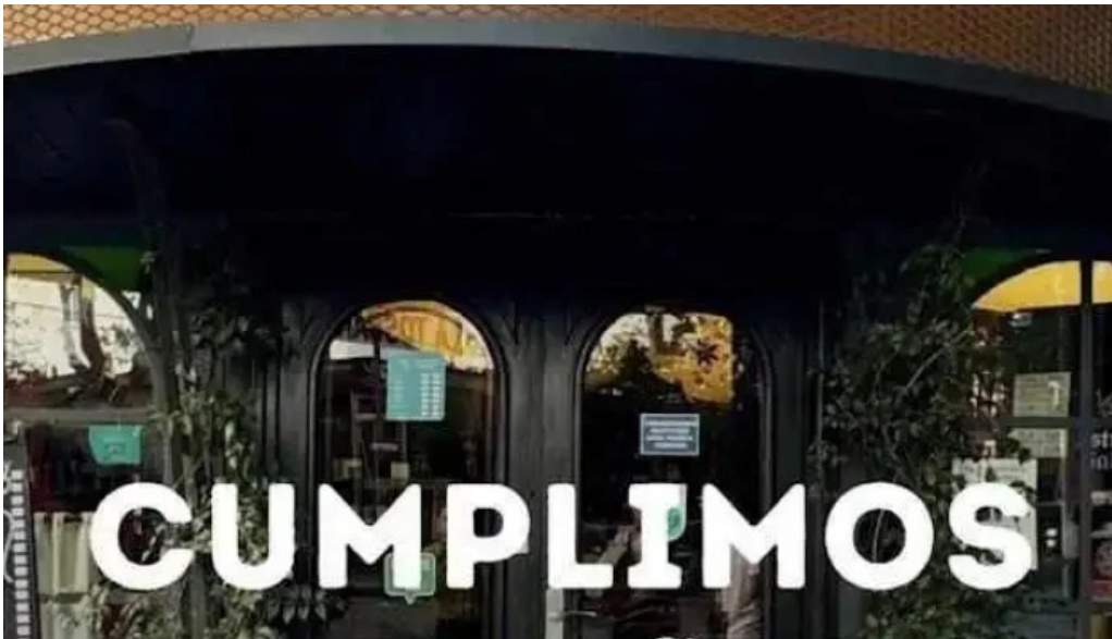
Fellini pocitos montevideo