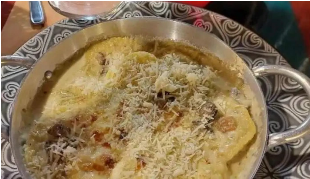
Fellini pocitos lasana