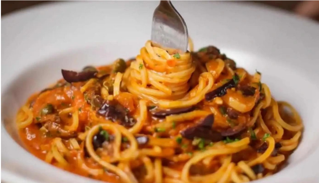
Fellini pocitos comida y bebida