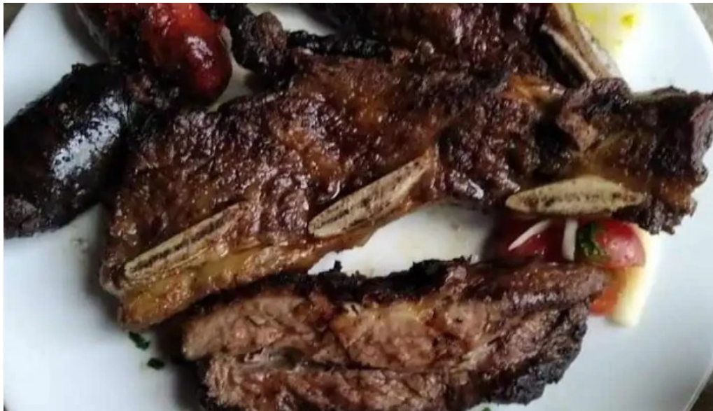
El rancho de young churrasco