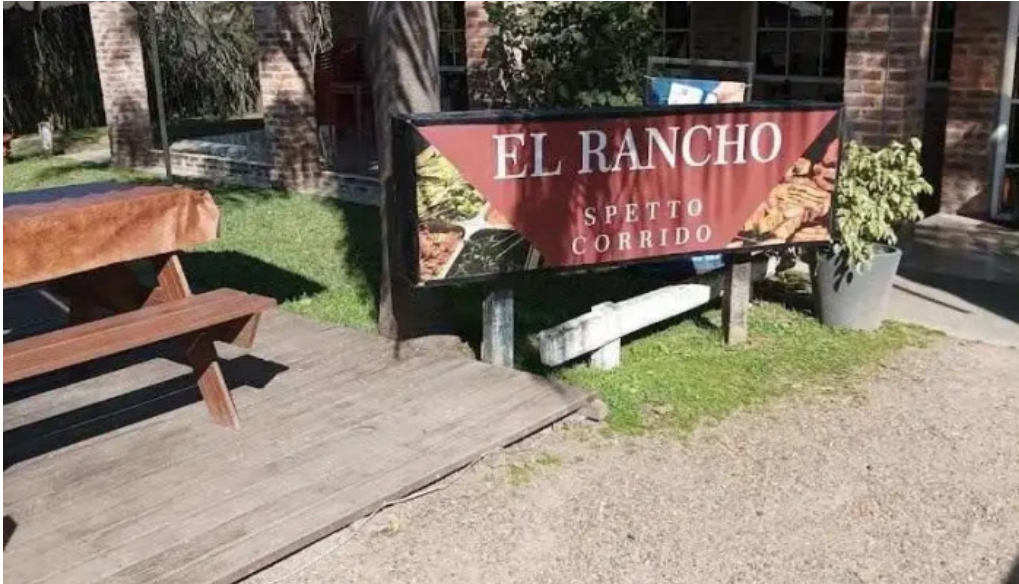
El rancho de young todas