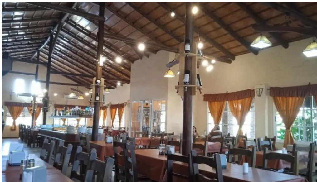
El rancho de young ambiente