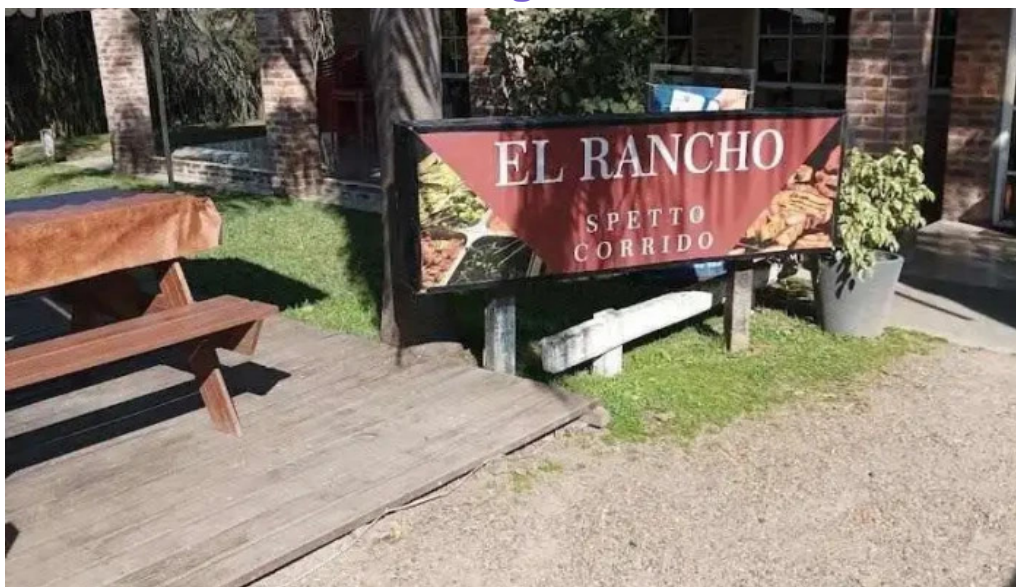
El rancho de young young