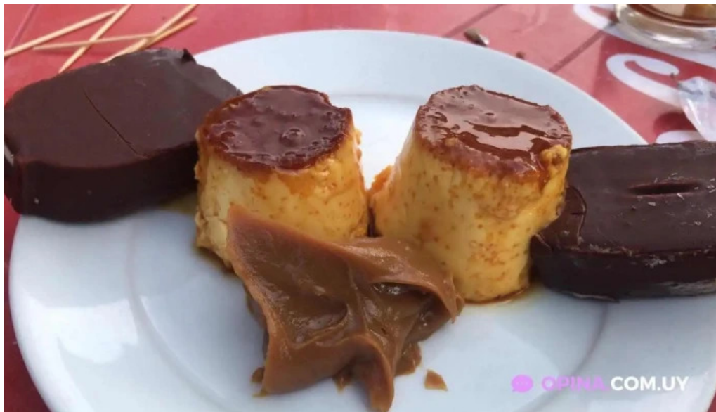
El rancho de young flan