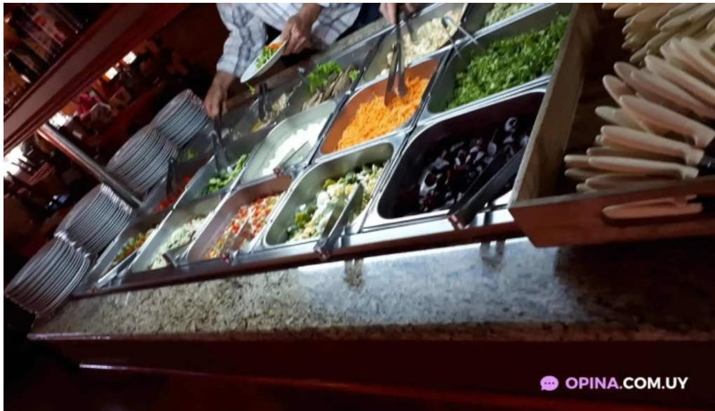
El rancho de young comida y bebida