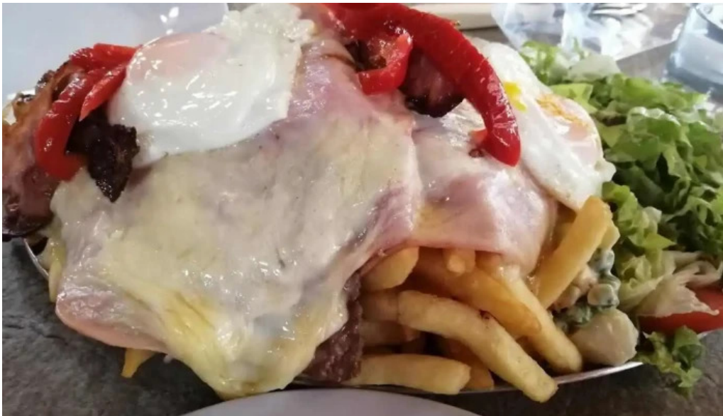
El rancho de young milanese