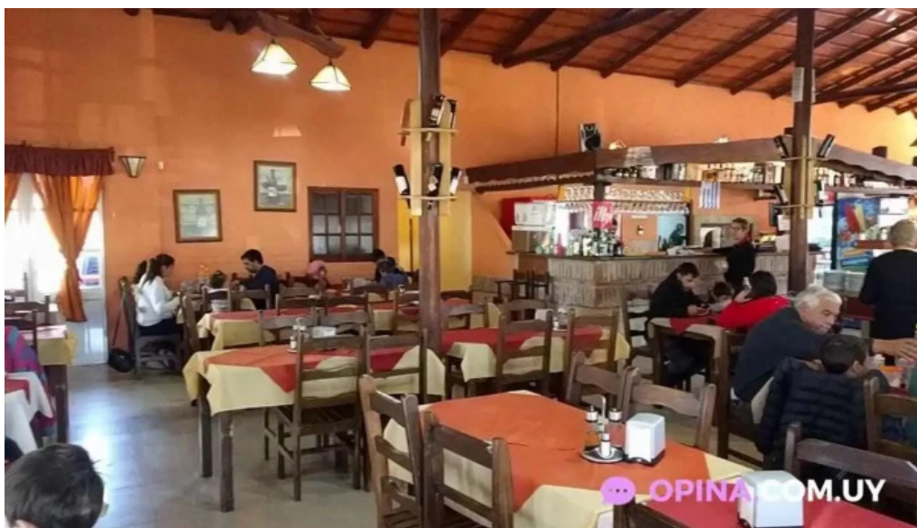
El rancho de young videos