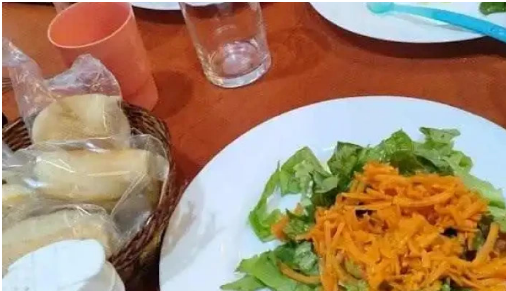
El rancho de young mas recientes