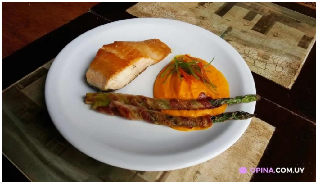
El pato comida y bebida