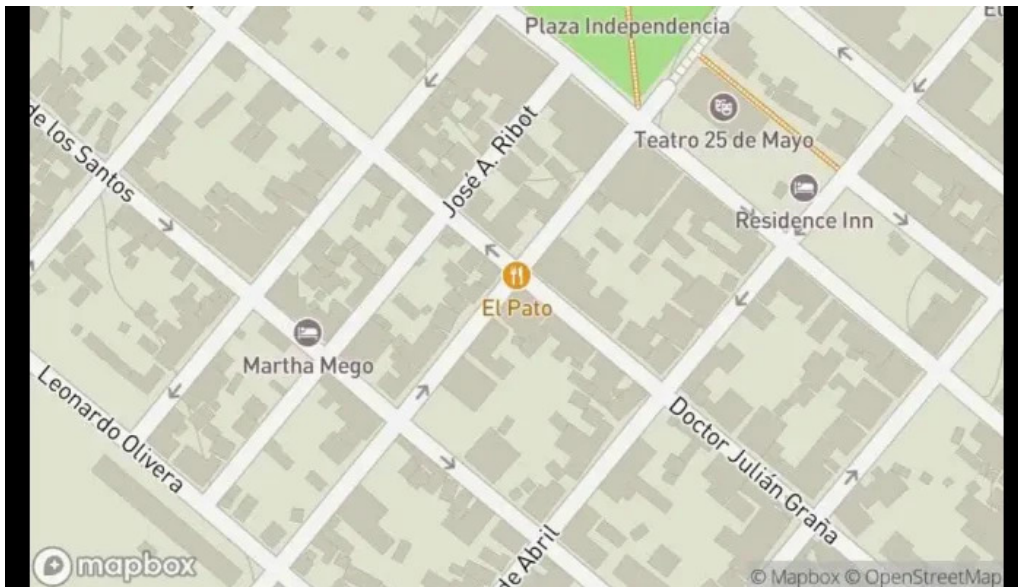
El pato mapa