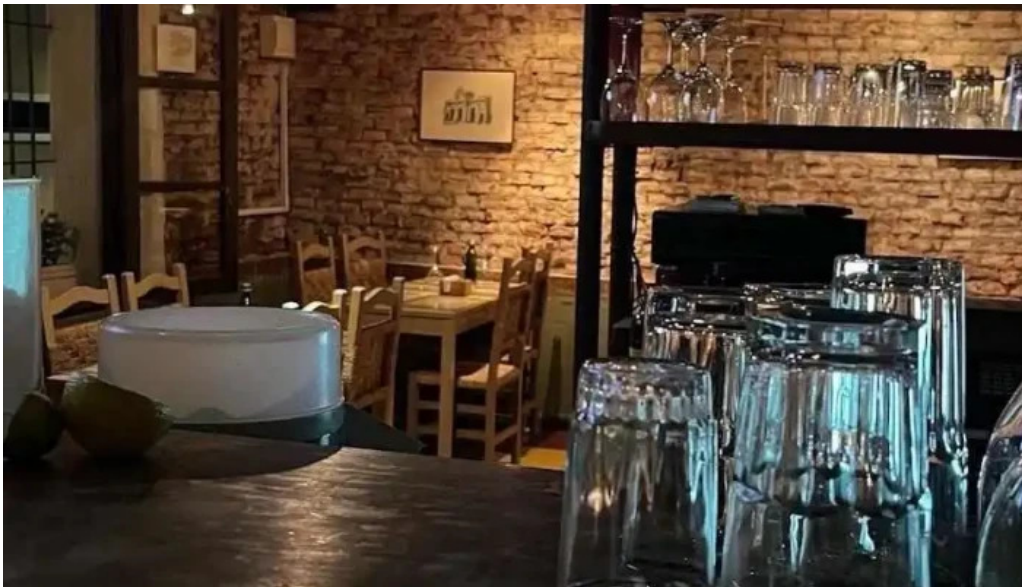
El pato todas