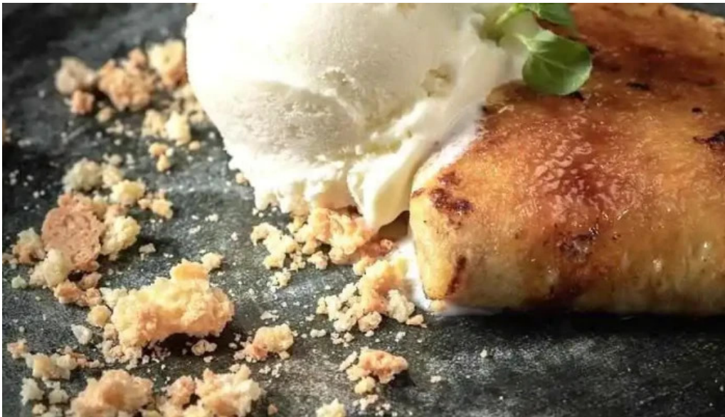
El otro porton del propietario