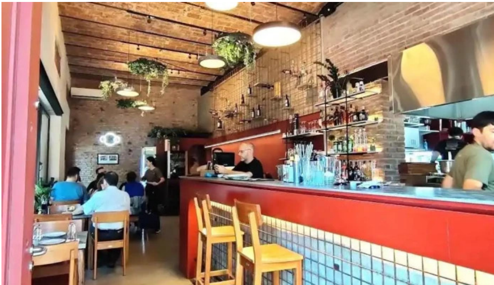
El otro porton ambiente