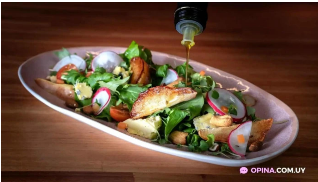
El otro porton comida y bebida