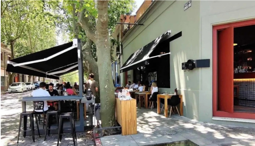
El otro porton col del sacramento