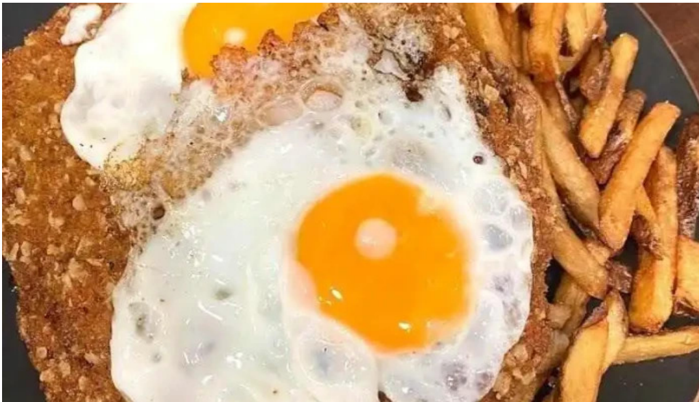
El origen del propietario