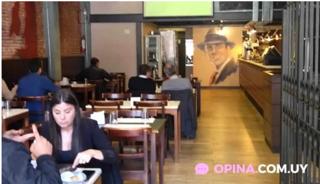
El origen montevideo