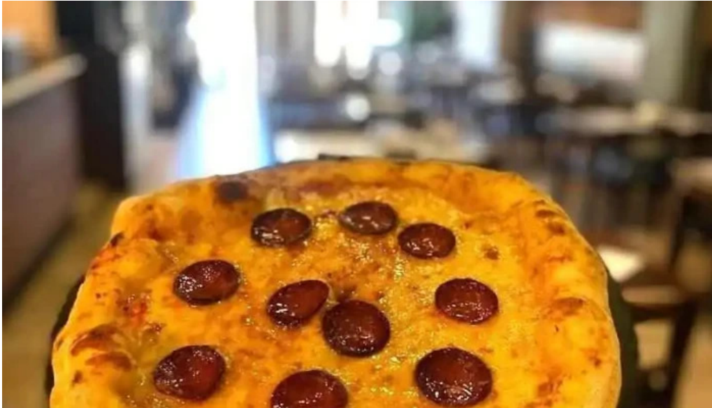
El origen comida y bebida