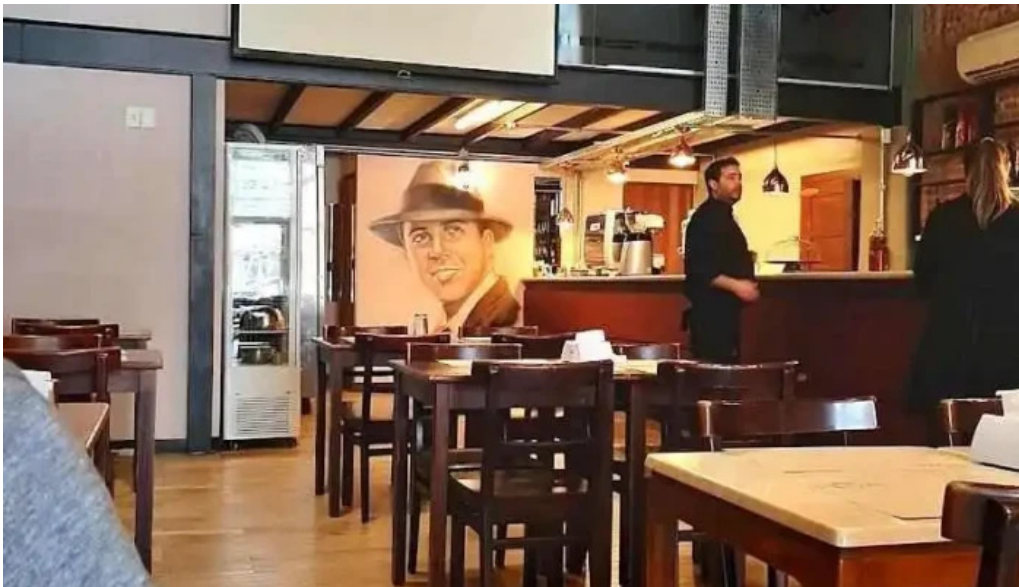
El origen ambiente