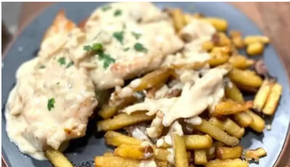
El origen papas fritas