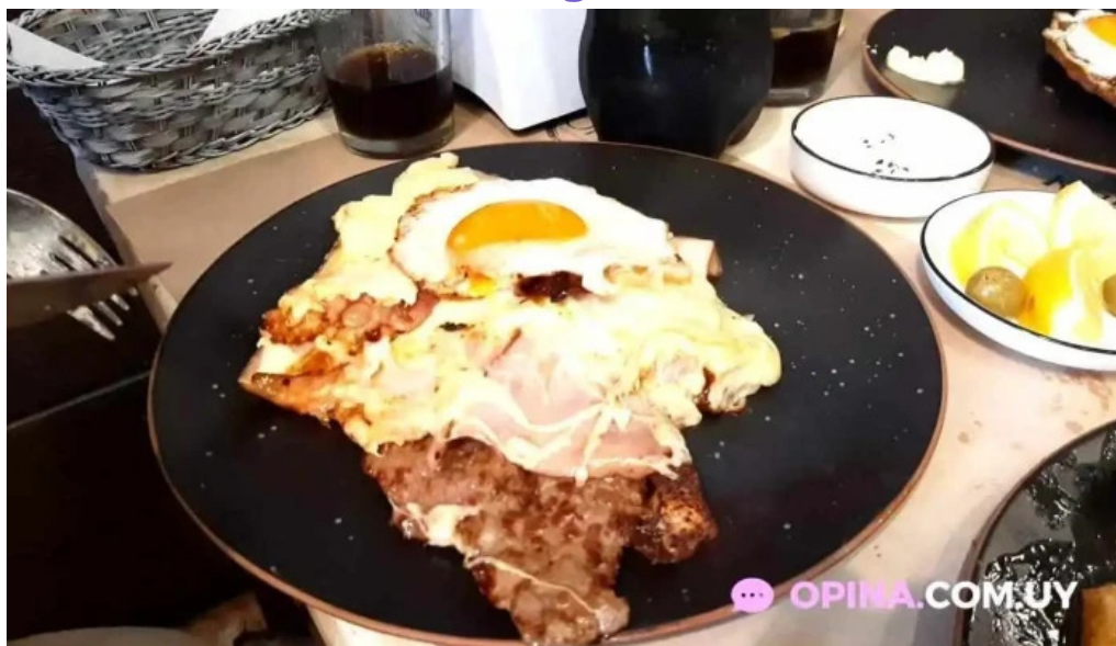
El origen videos