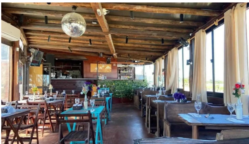
El mirador resto show ambiente