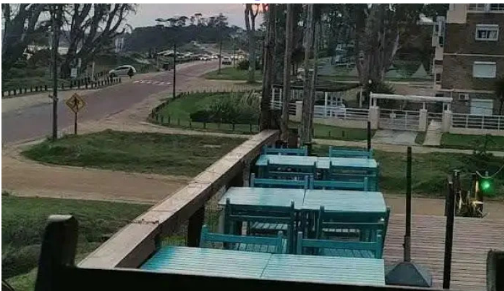
El mirador resto show videos