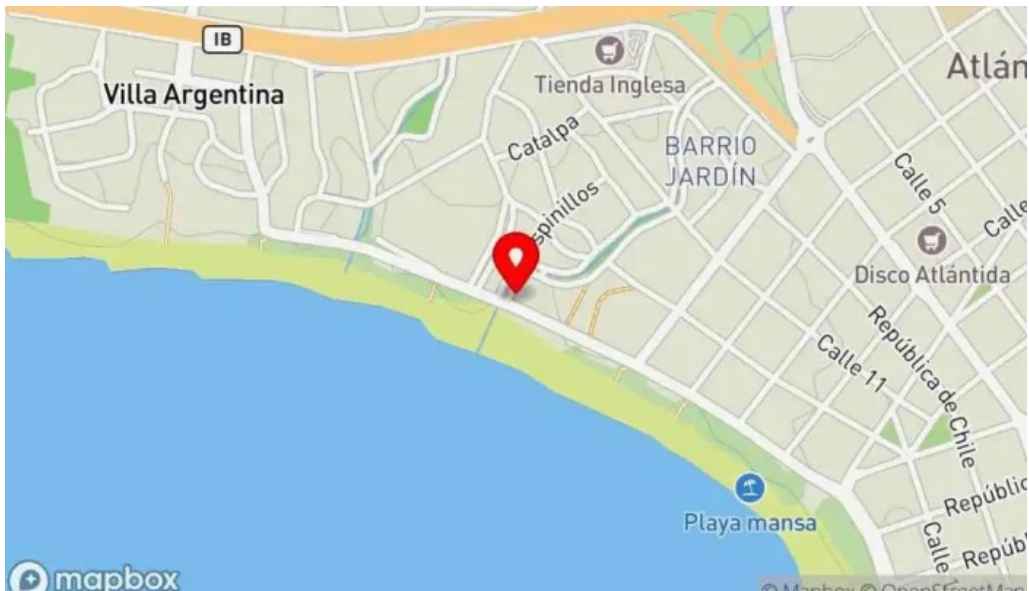
El mirador resto show mapa