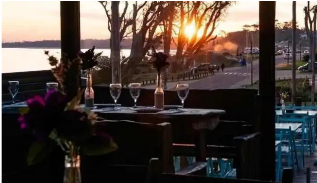
El mirador resto show todas