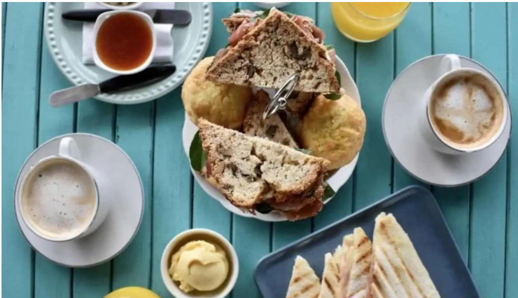
El mirador resto show comida y bebida