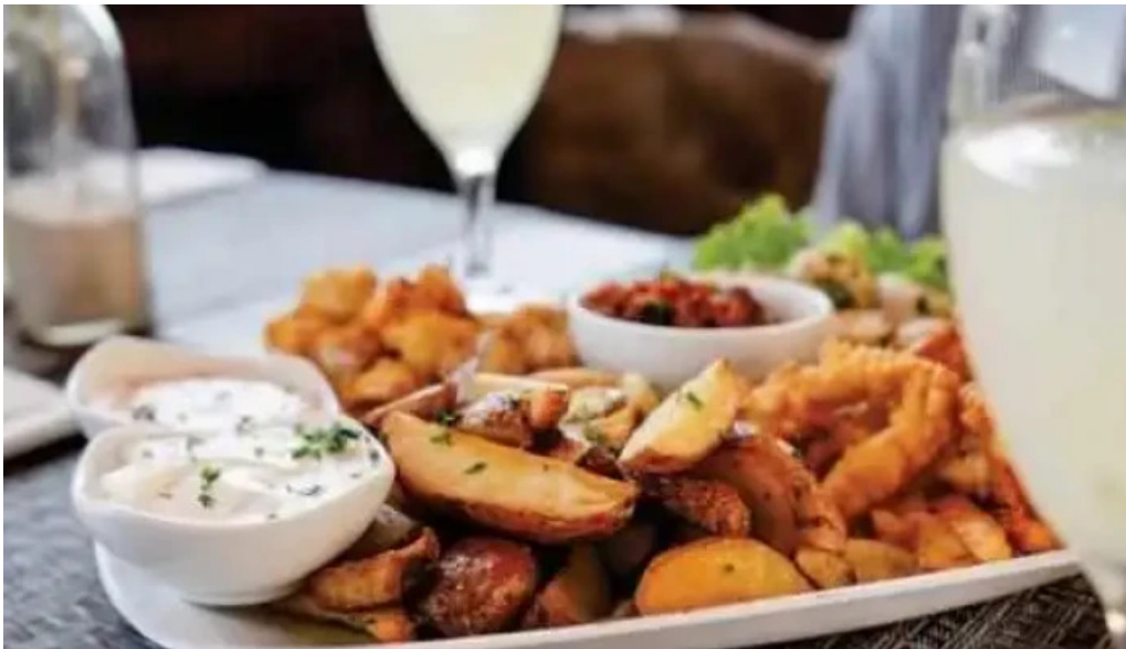
El mirador resto show mas recientes