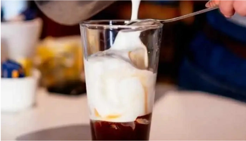
El mirador resto show cafe