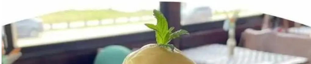
El mirador resto show menu