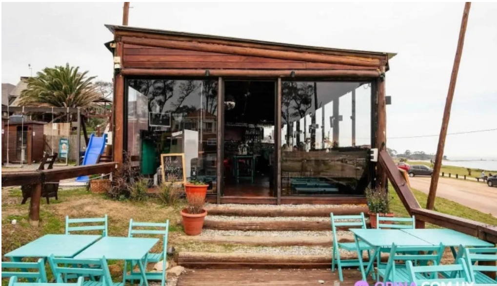
El mirador resto show del propietario