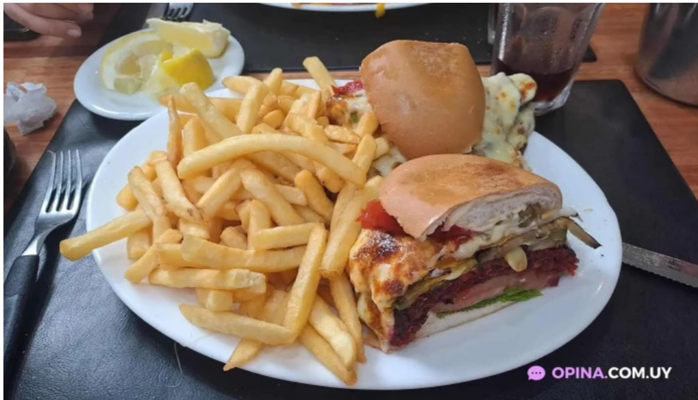
El gaucho sandwich de pollo