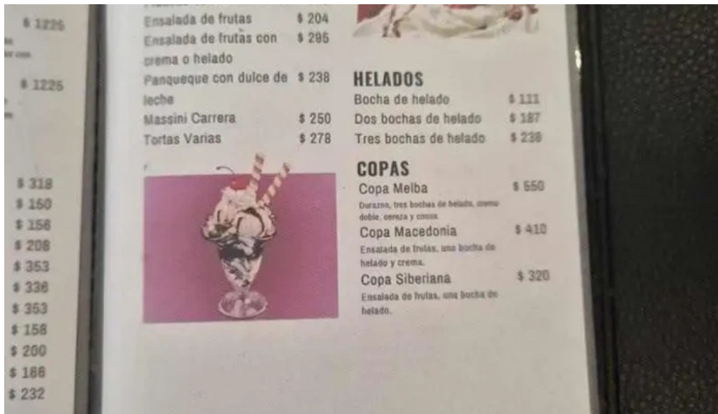
El gaucho mas recientes