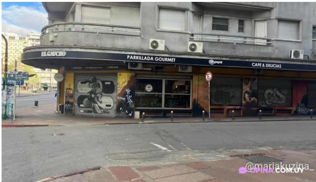
El gaucho montevideo