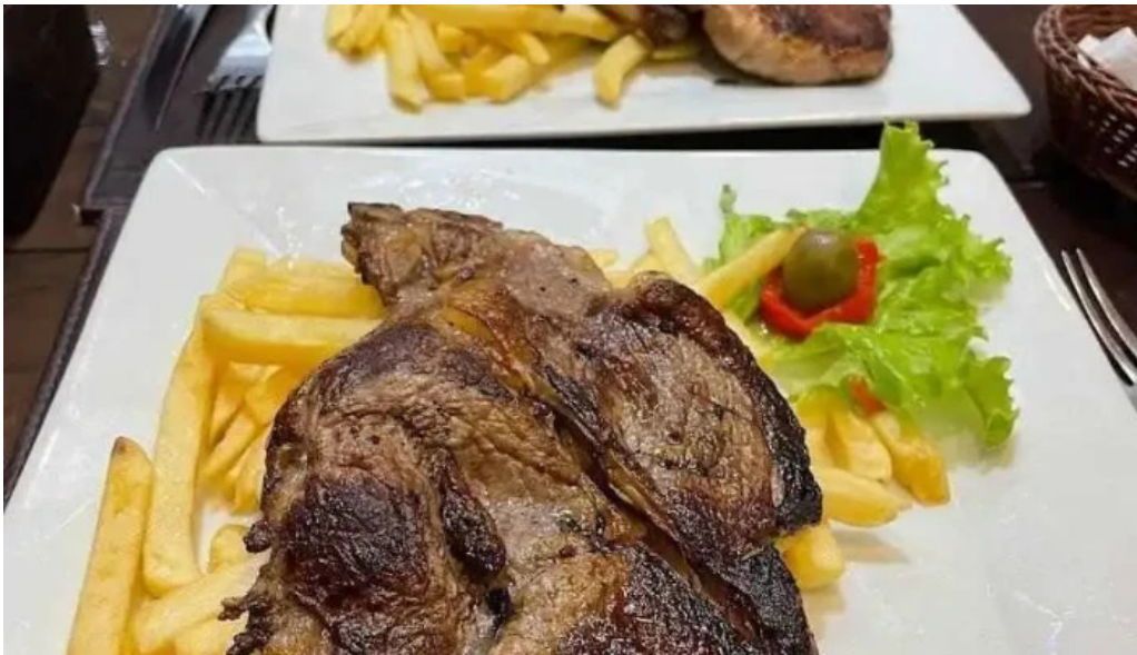
El gaucho filete