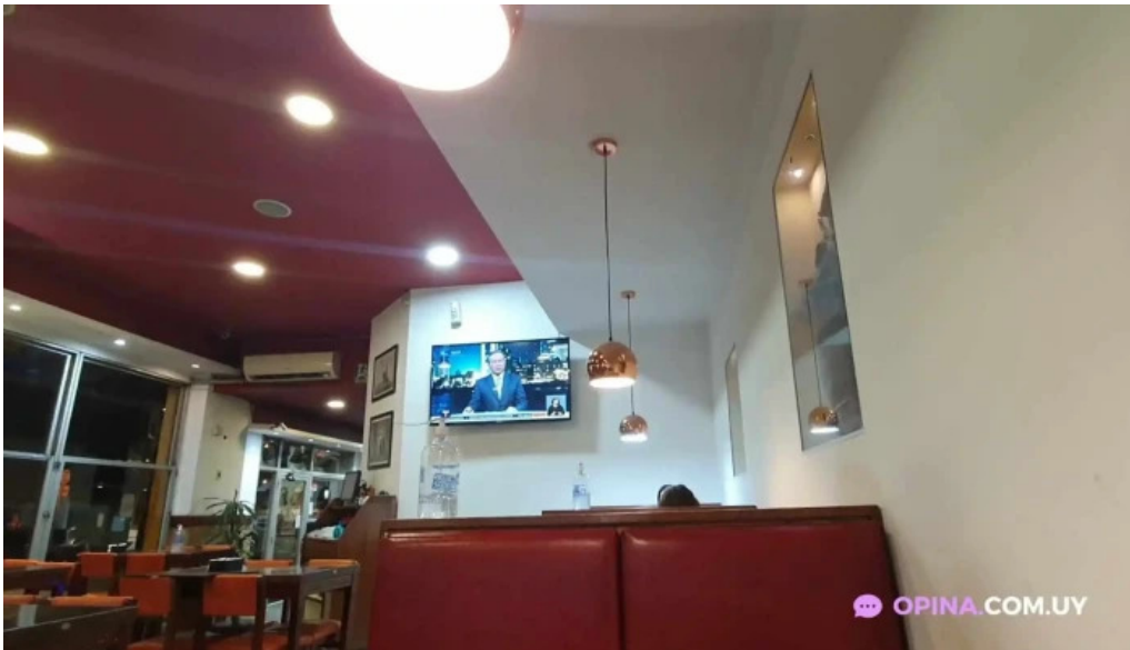
El gaucho videos