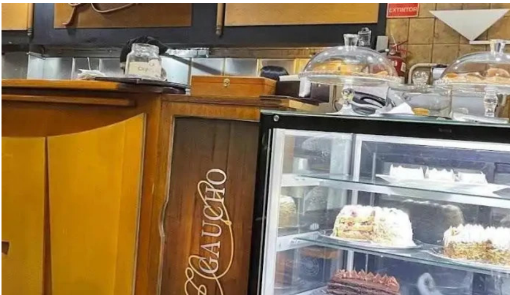
El gaucho ambiente