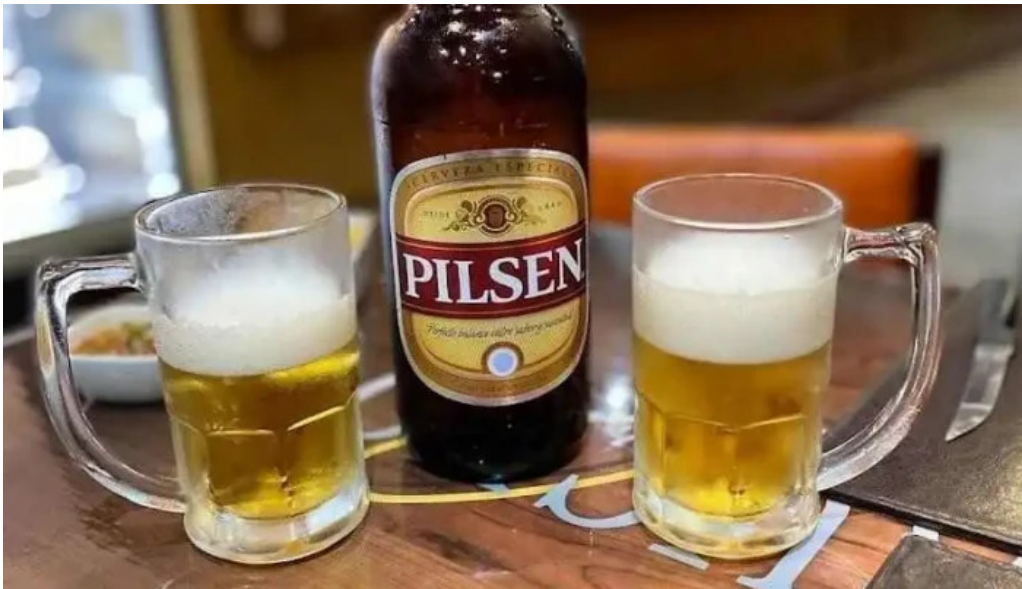
El gaucho cerveza