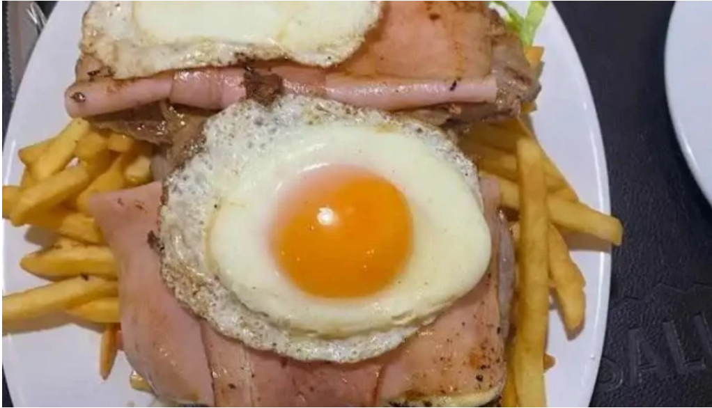
El gaucho comida y bebida