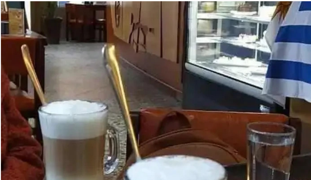
El gaucho cafe irlandes