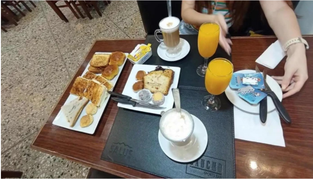
El gaucho jugo