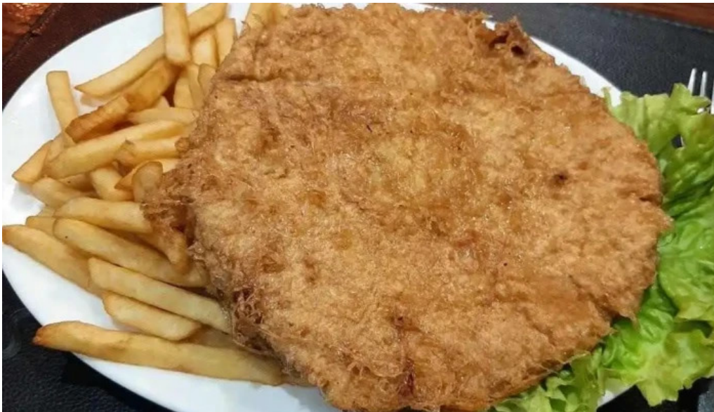
El gaucho milanesa