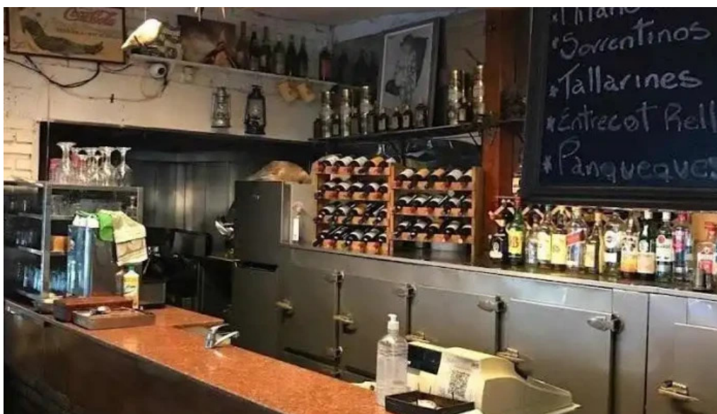
El cabure ambiente