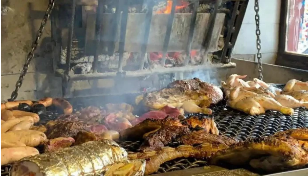
El cabure del propietario