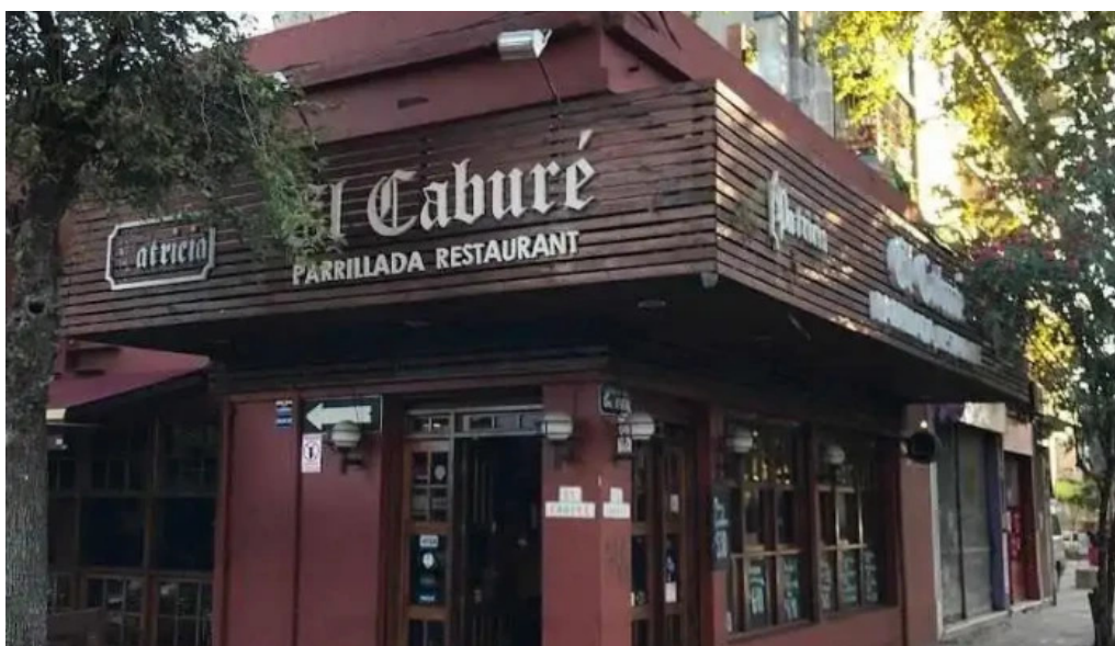
El cabure todas