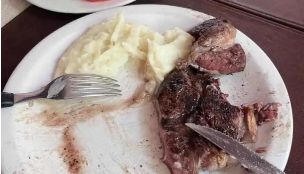
El cabure solomillo