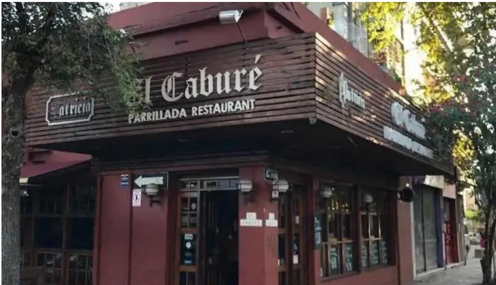
El cabure montevideo