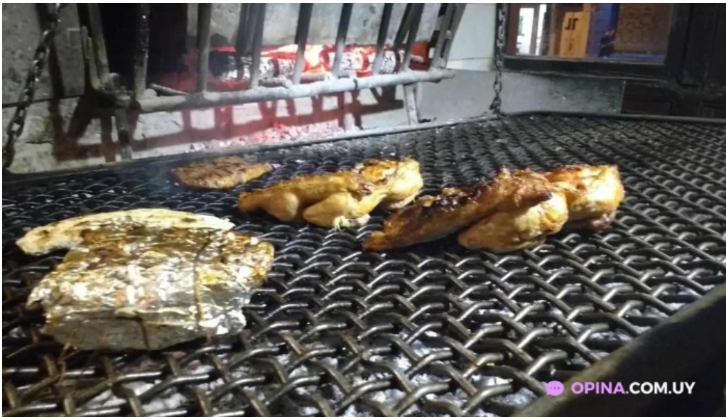
El cabure comida y bebida