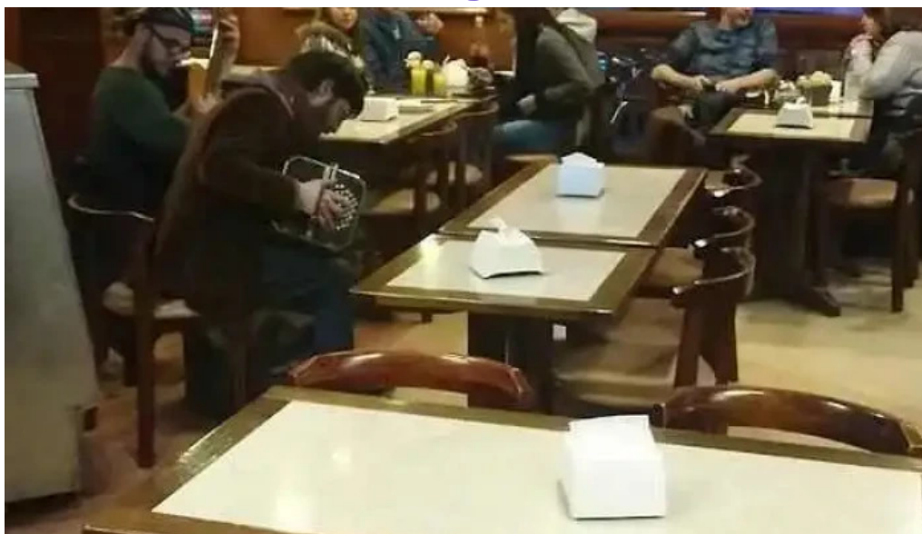
El cabure videos