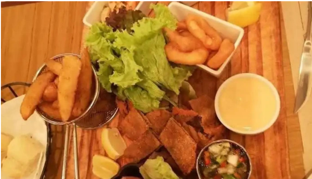
El berretin picada