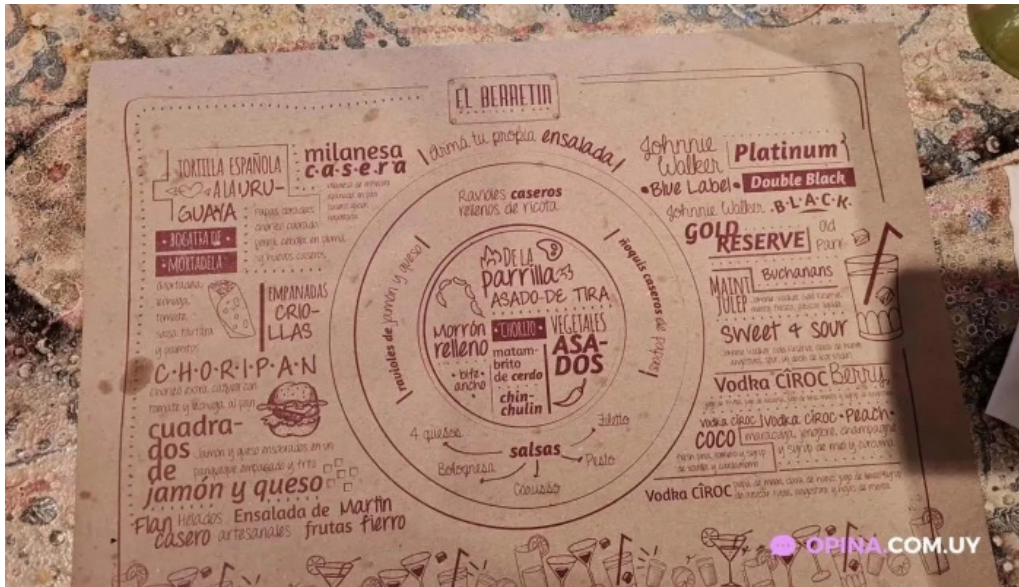
El berretin menu