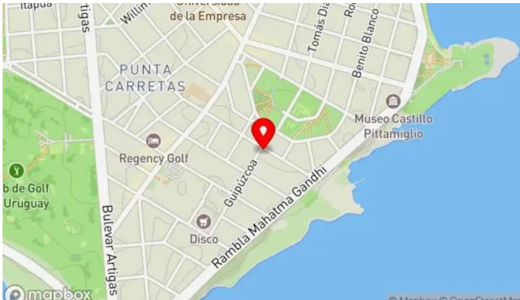
El berretin mapa