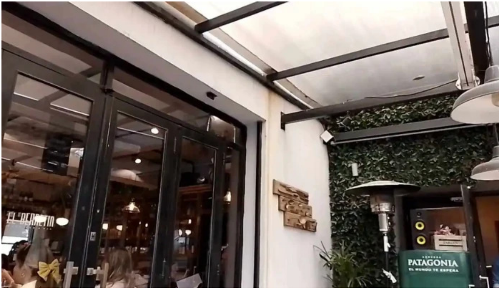
El berretin videos