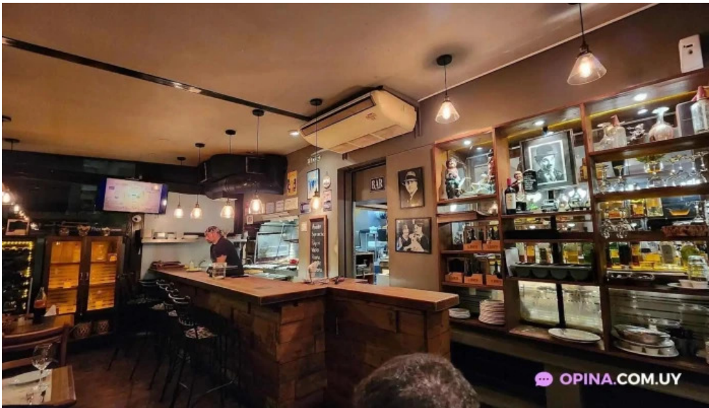
El berretin montevideo