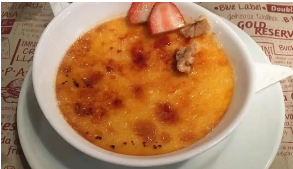
El berretin natilla