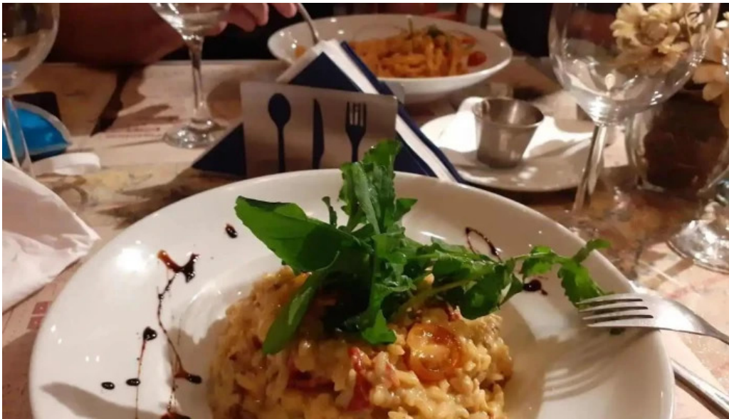
El berretin risotto