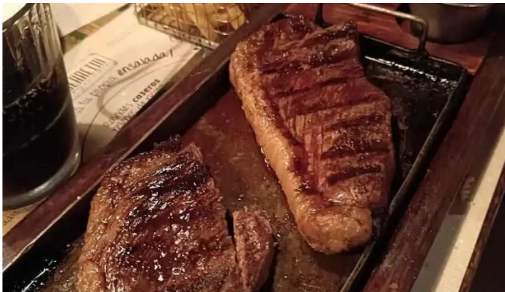
El berretin filete