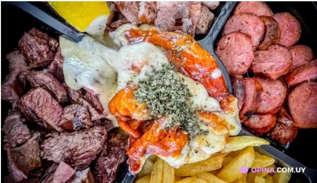
El berretin del propietario