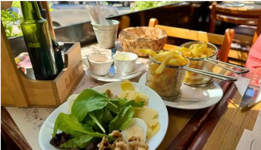
El berretin comida y bebida