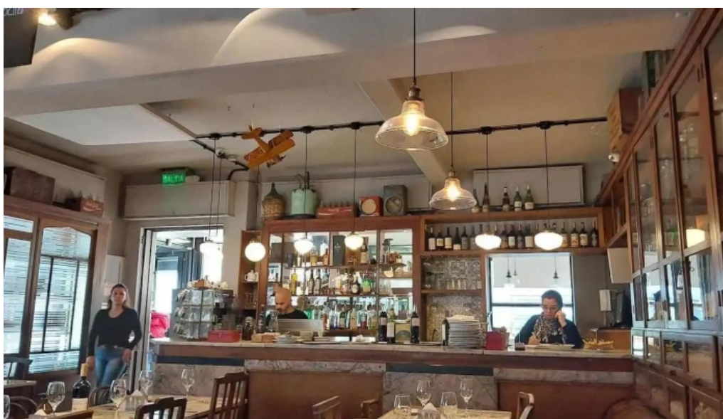
El berretin ambiente