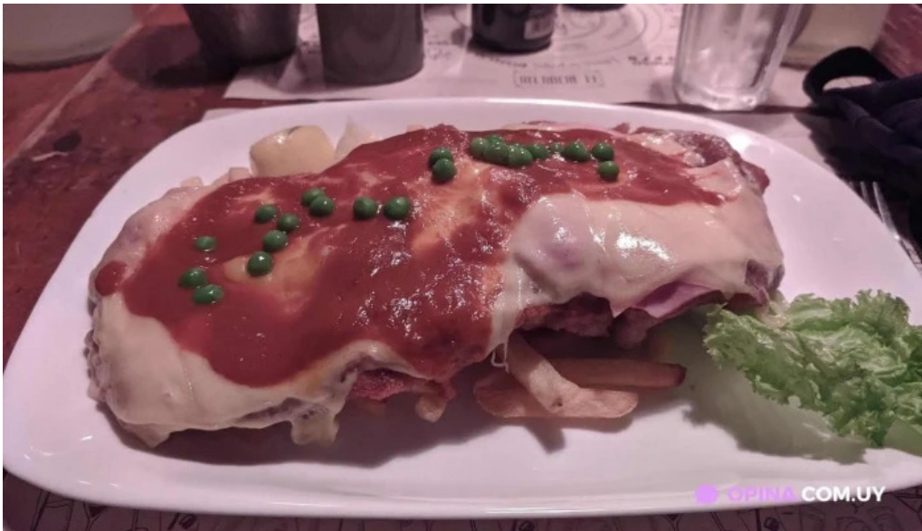
El berretin milanesa