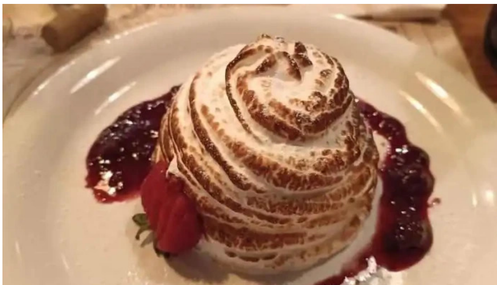
El berretin baked alaska