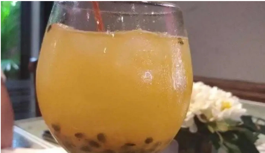
El berretin jugo