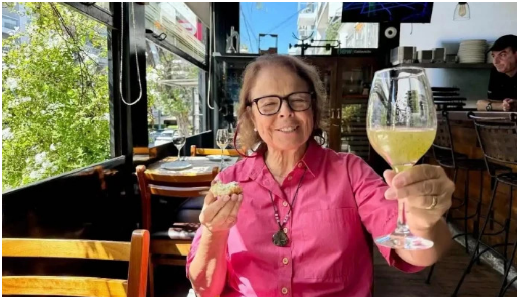
El berretin mas recientes