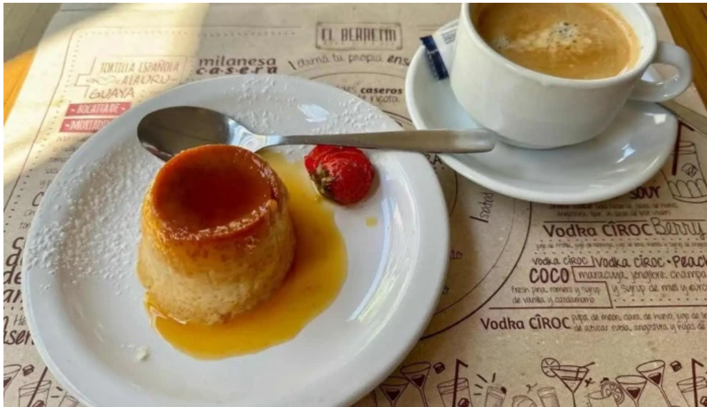
El berretin flan