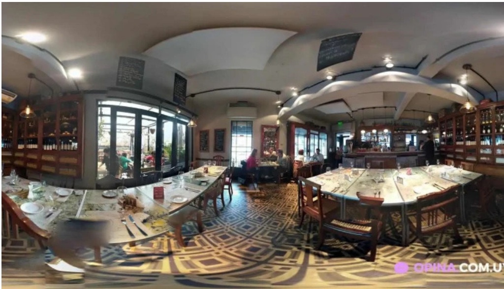
El berretin street view y 360