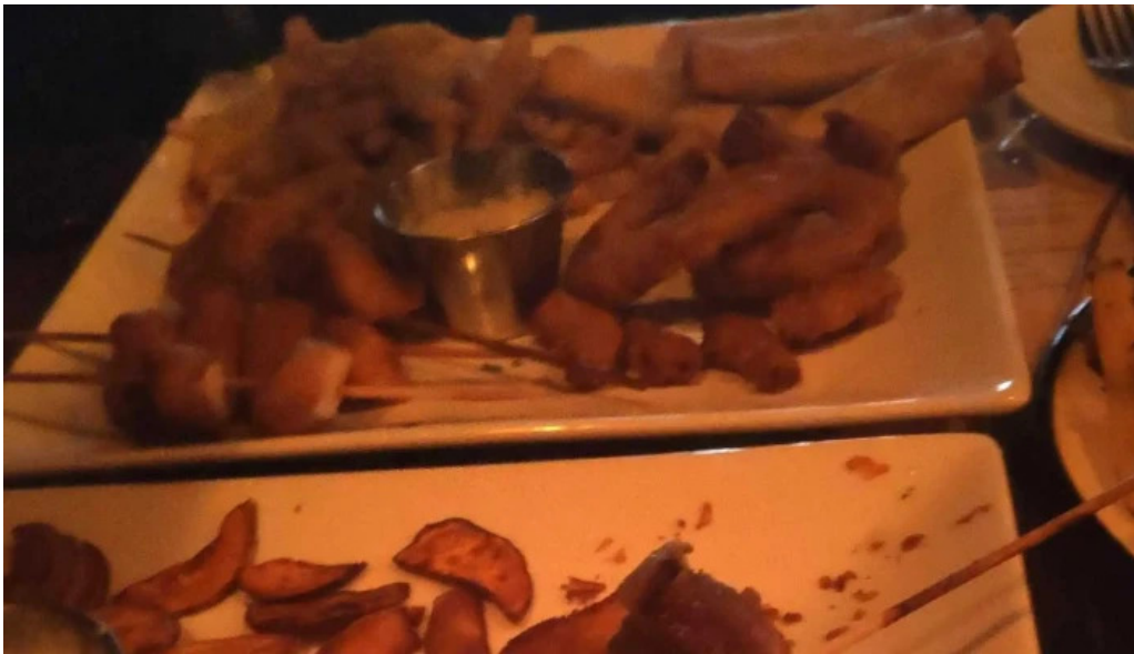
El barzon comentario 7