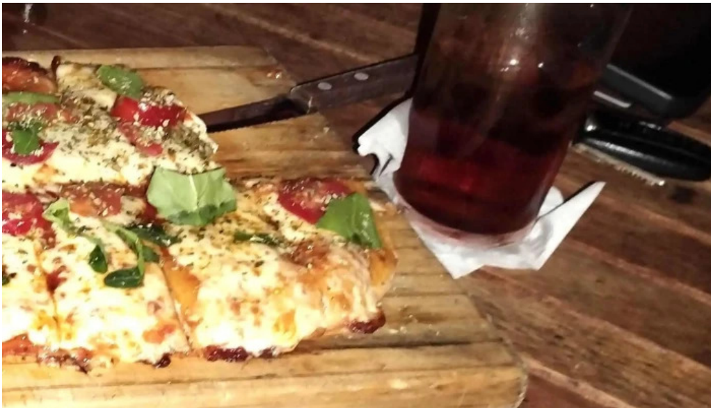
El barzon comentario 3