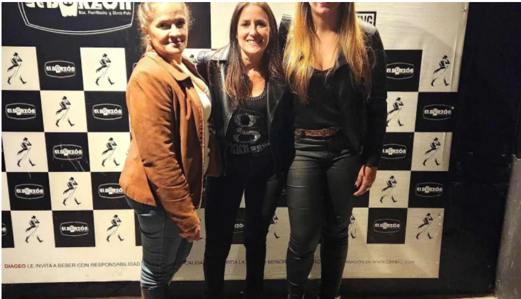
El barzon comentario 1