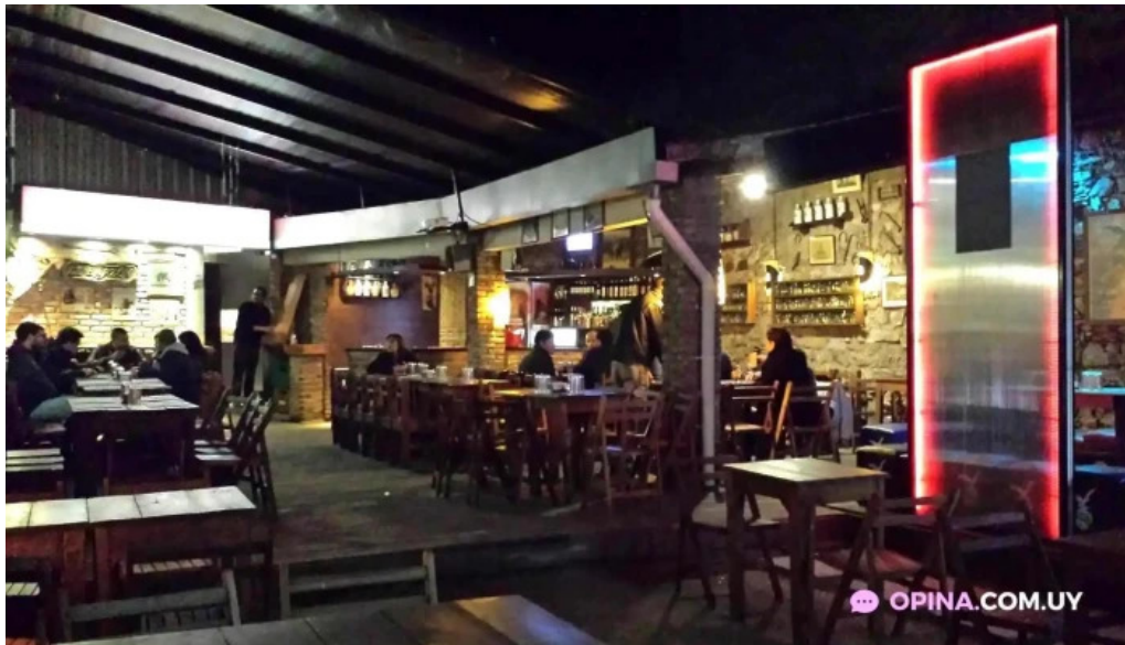
El barzon montevideo