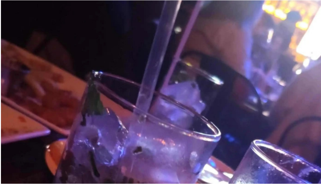
El barzon comentario 6