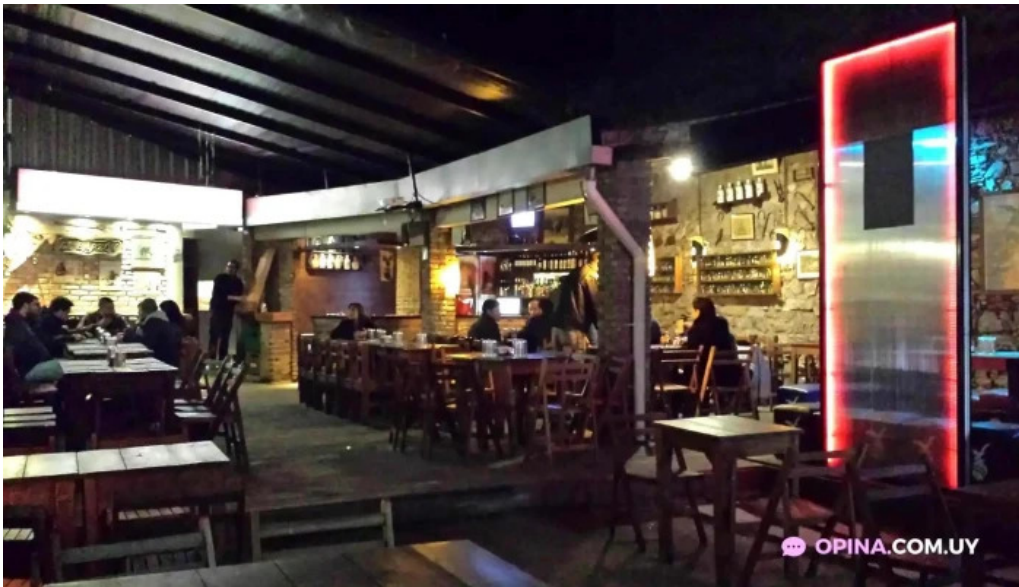
El barzon todo