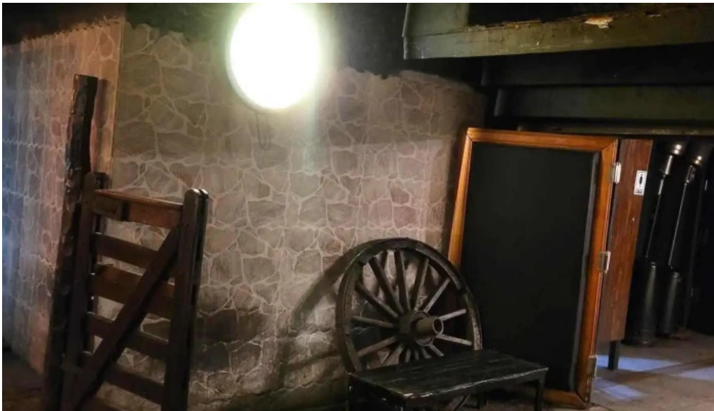
El barzon recientes