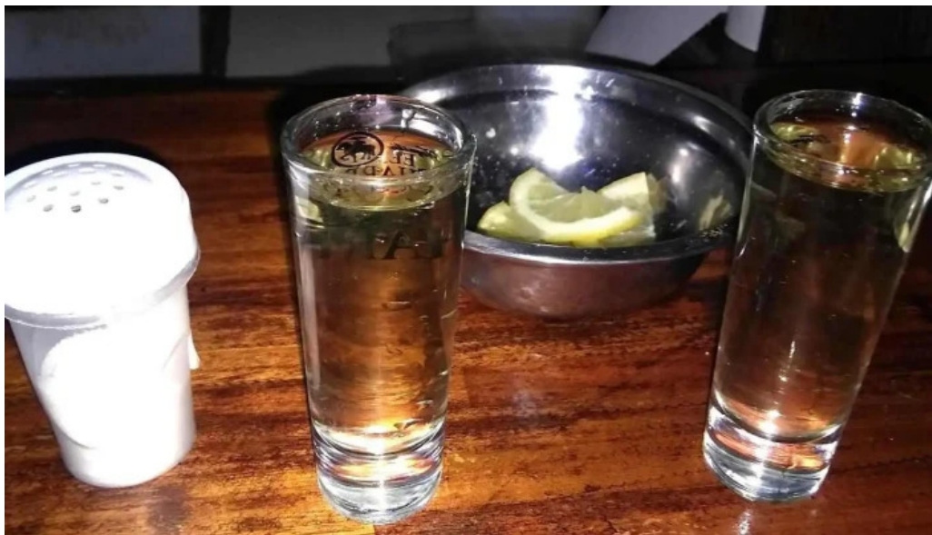
El barzon comidas y bebidas