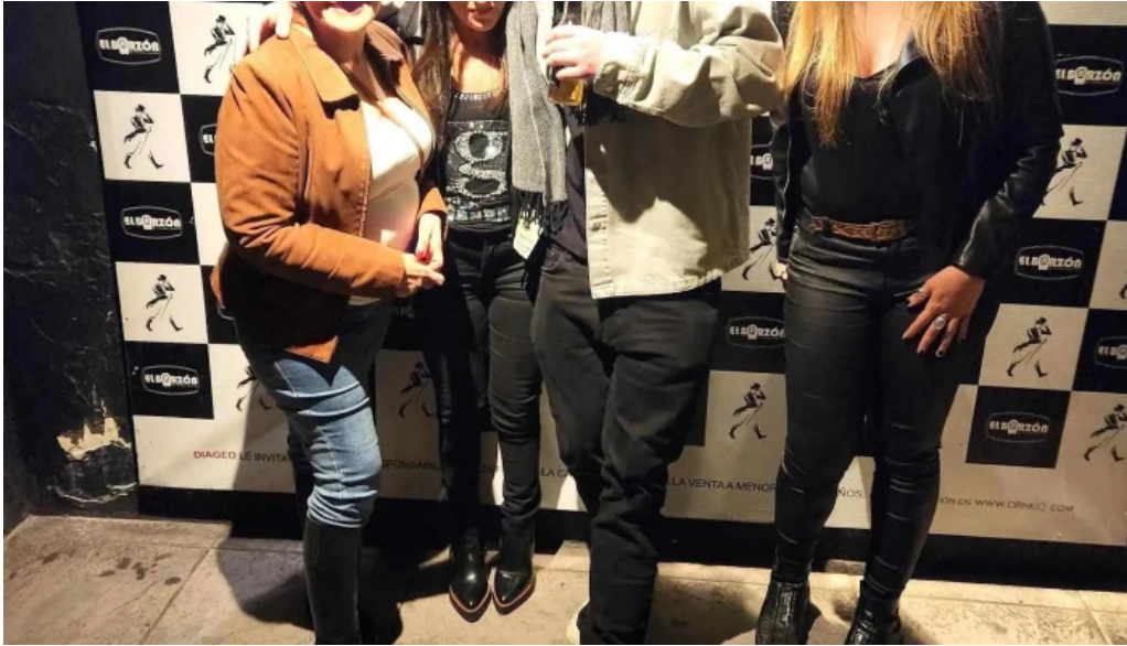
El barzon comentario 2