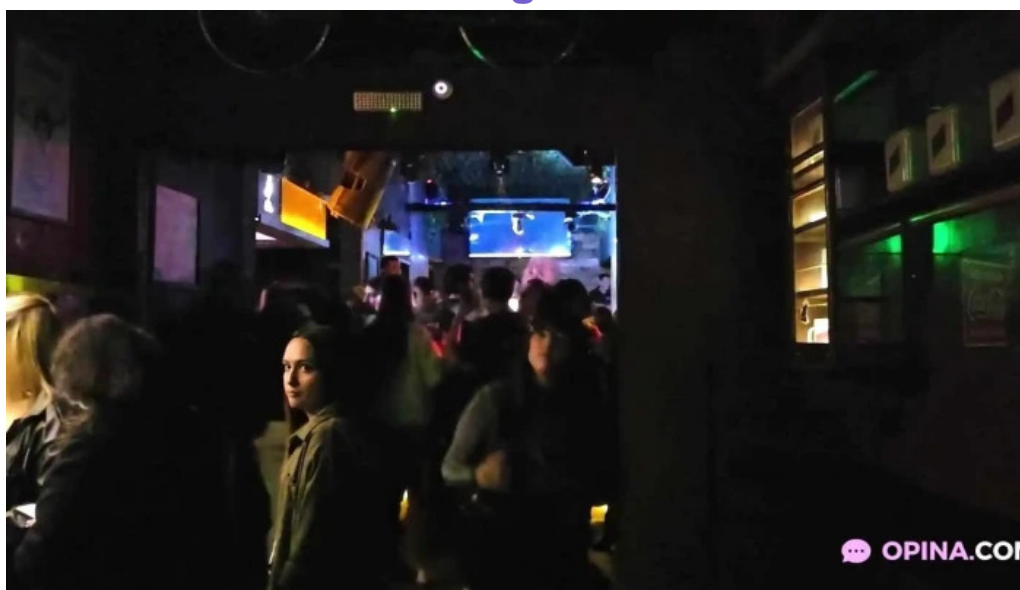
El barzon videos