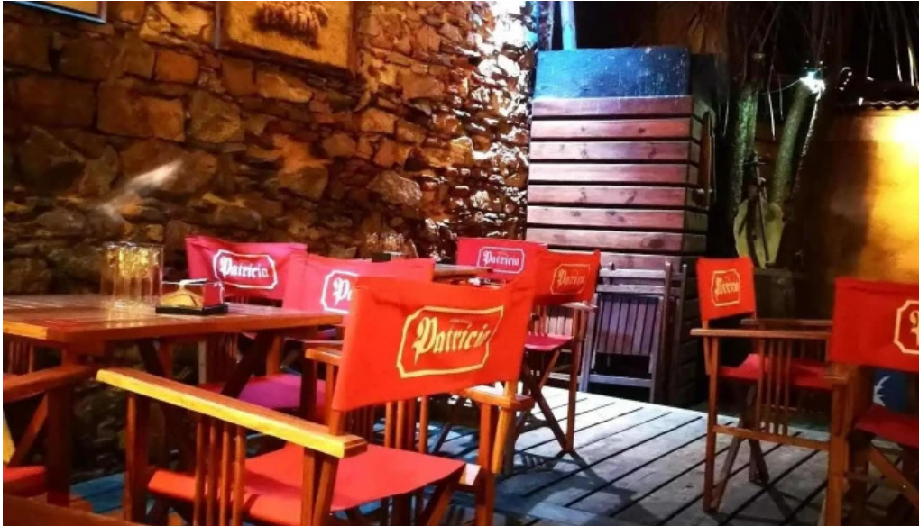
El barzon ambiente