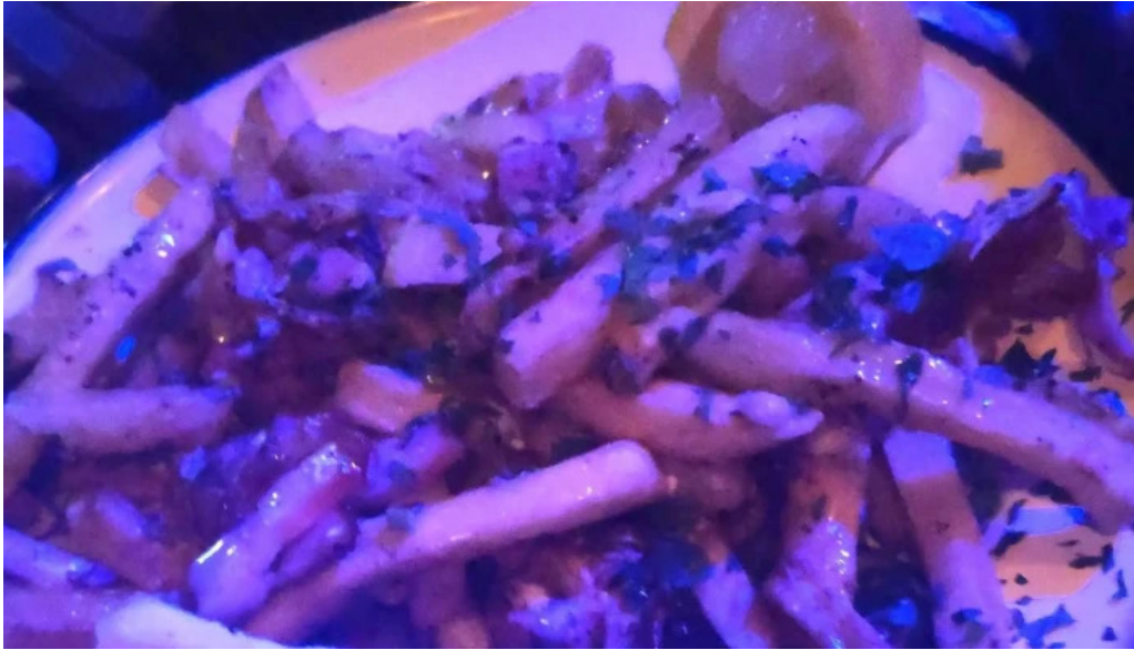
El barzon comentario 8