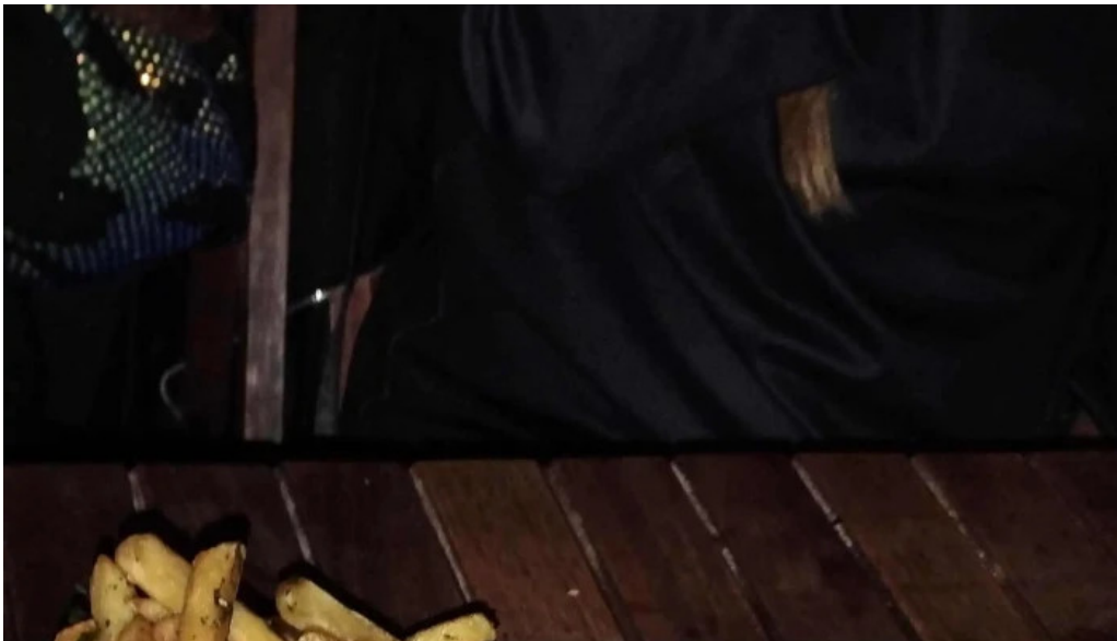
El barzon comentario 5