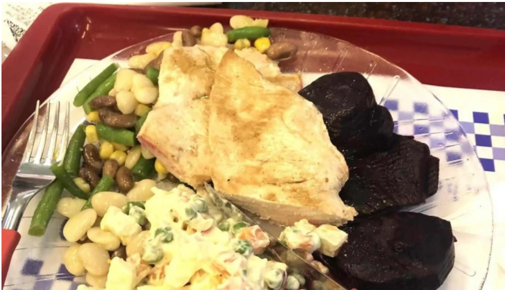
Eat comentario 9