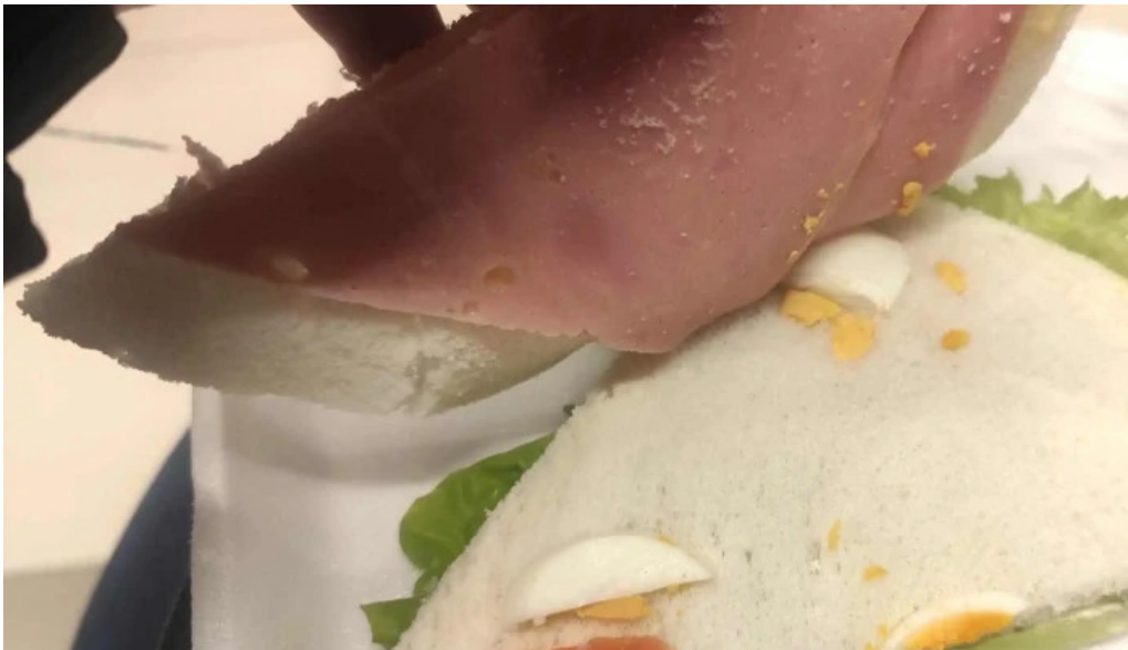
Eat comentario 5