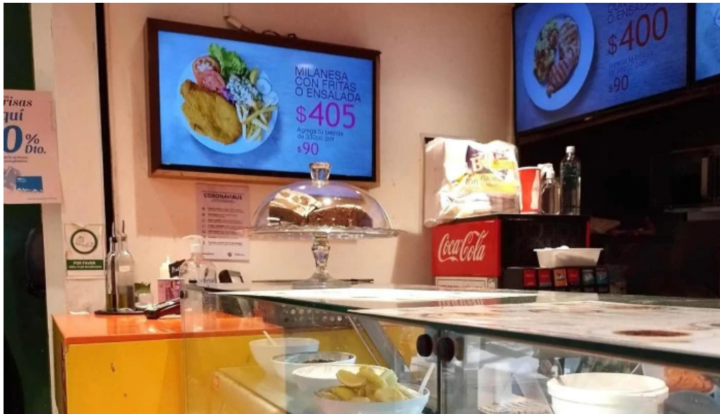
Eat comentario 7