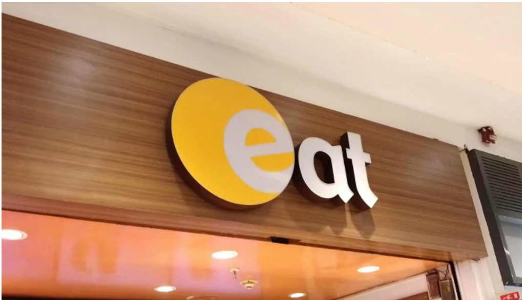
Eat comentario 6