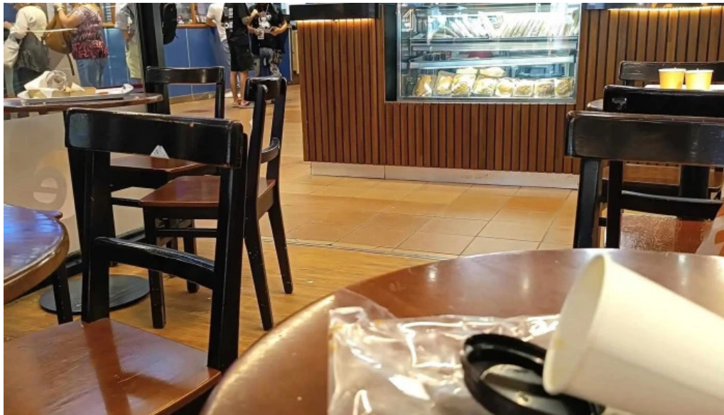
Eat comentario 10