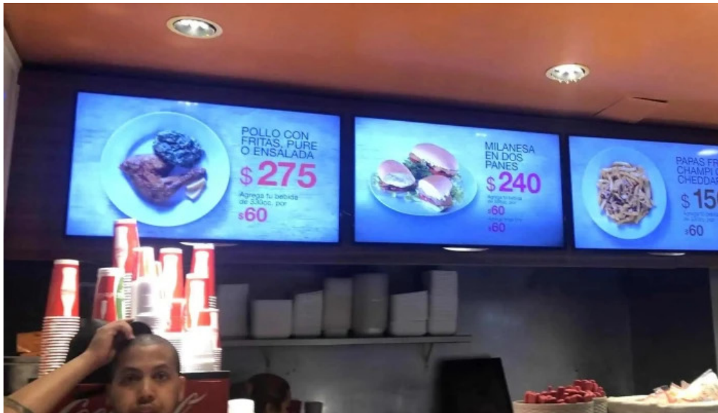
Eat comentario 8