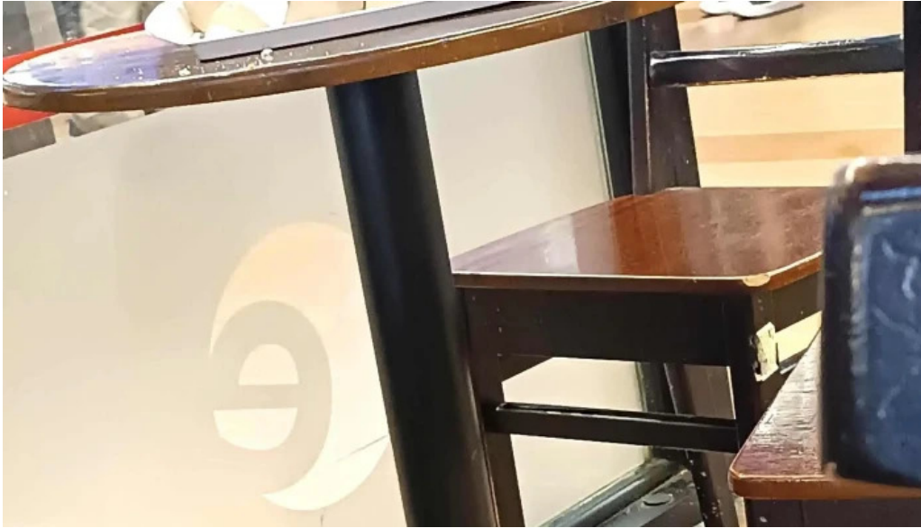
Eat comentario 4