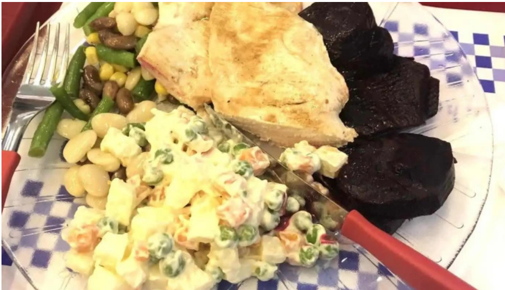
Eat comidas y bebidas