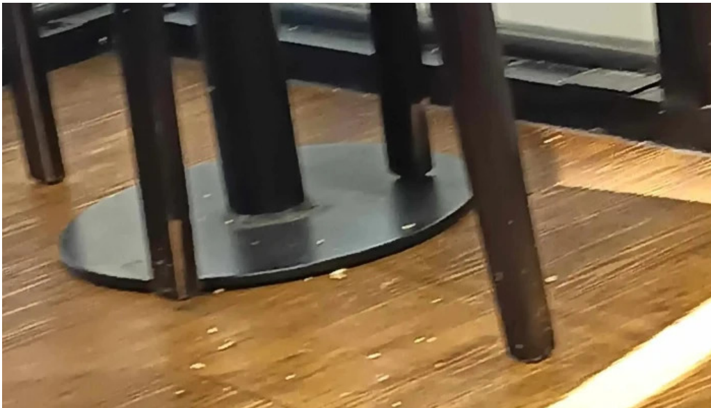
Eat comentario 3