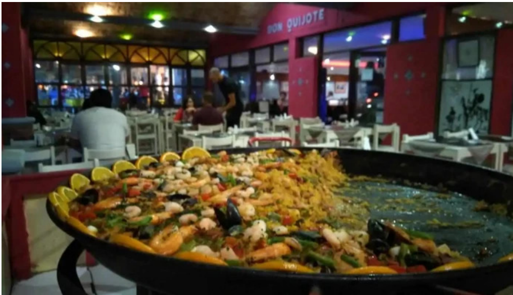
Don quijote del propietario