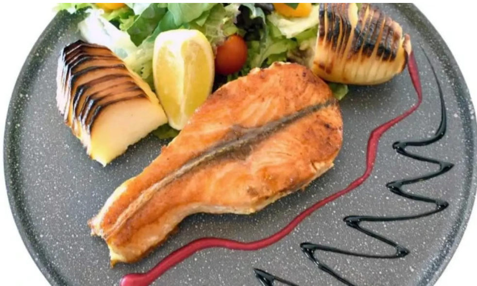
Don quijote comida y bebida