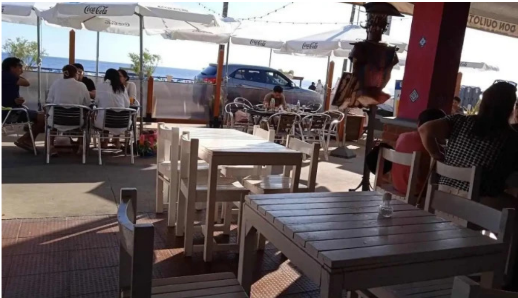
Don quijote mas recientes