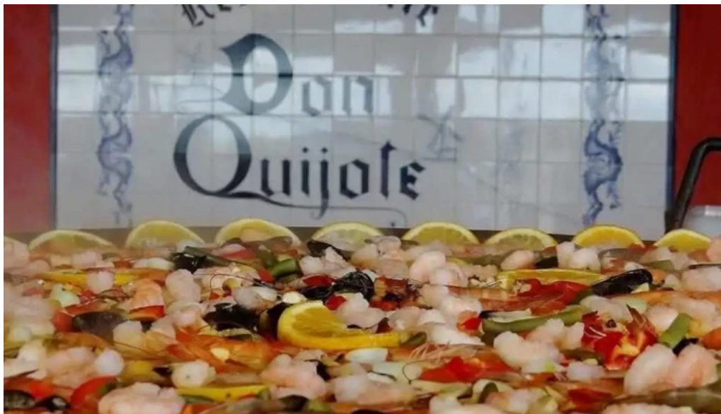
Don quijote paella