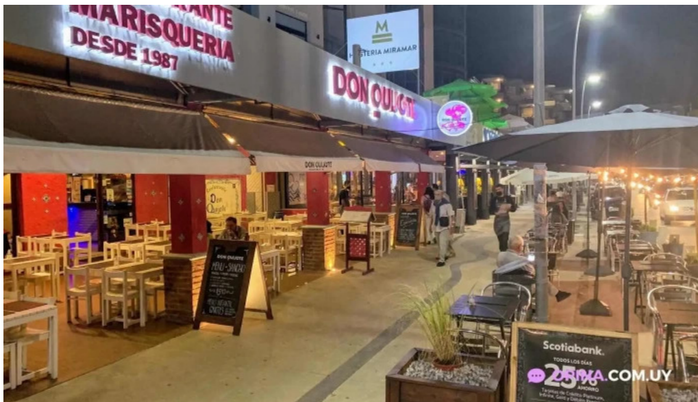
Don quijote todas