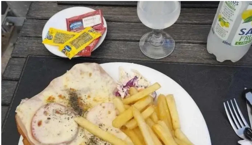
Don quijote milanesa