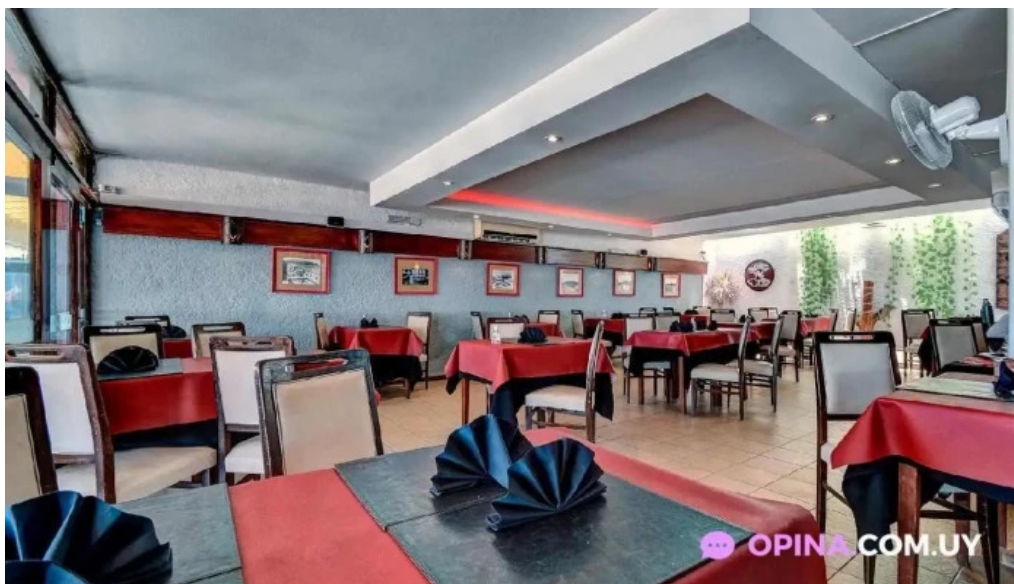
Don quijote ambiente