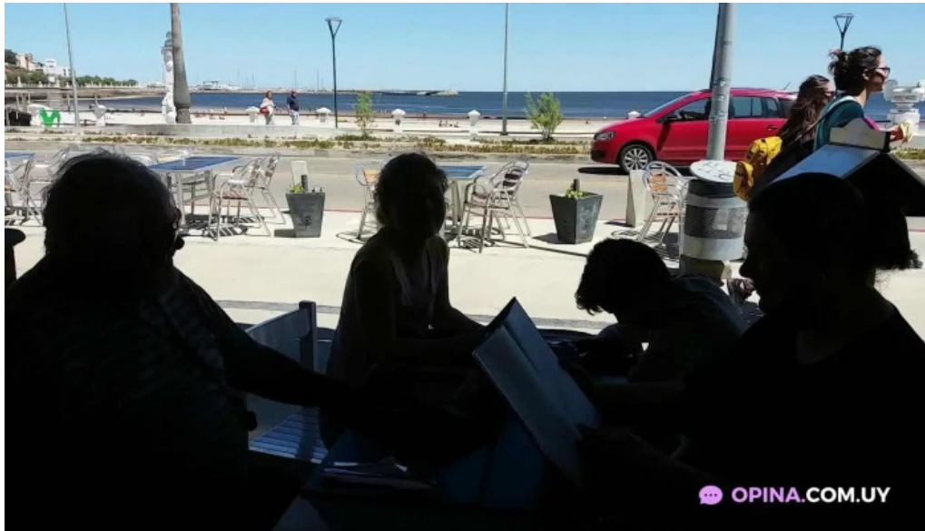
Don quijote videos