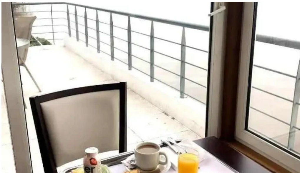
Del carmen comida y bebida