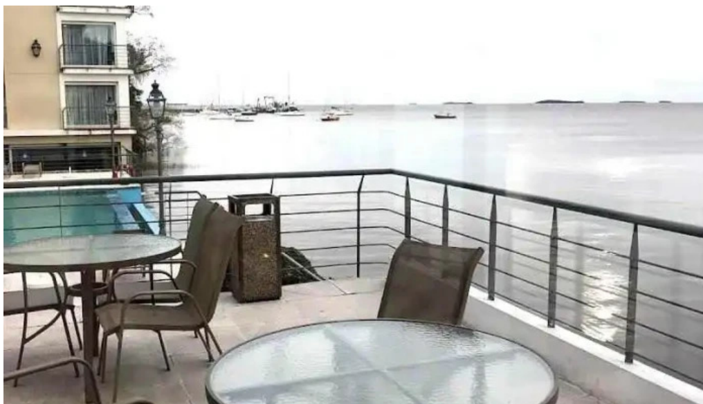
Del carmen col del sacramento