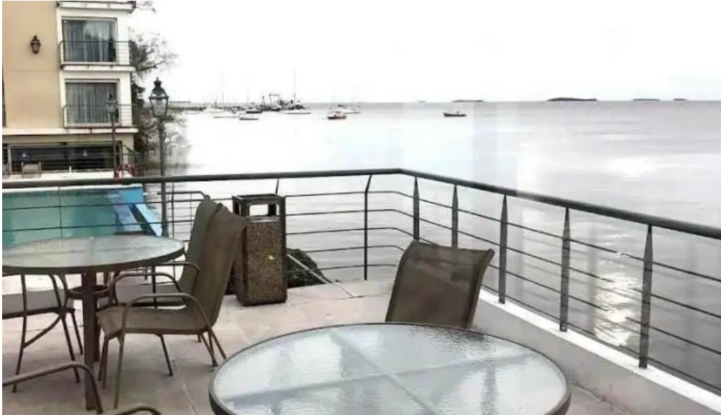
Del carmen todas