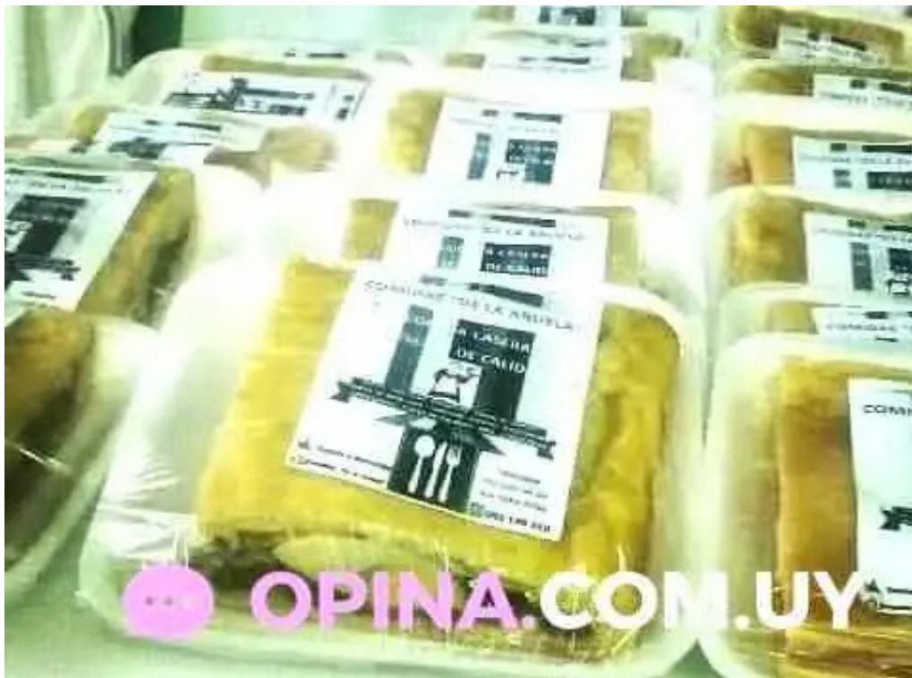
Comidas de la abuela san jose de mayo