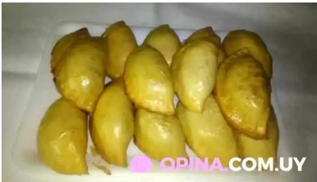
Comidas de la abuela comida y bebida