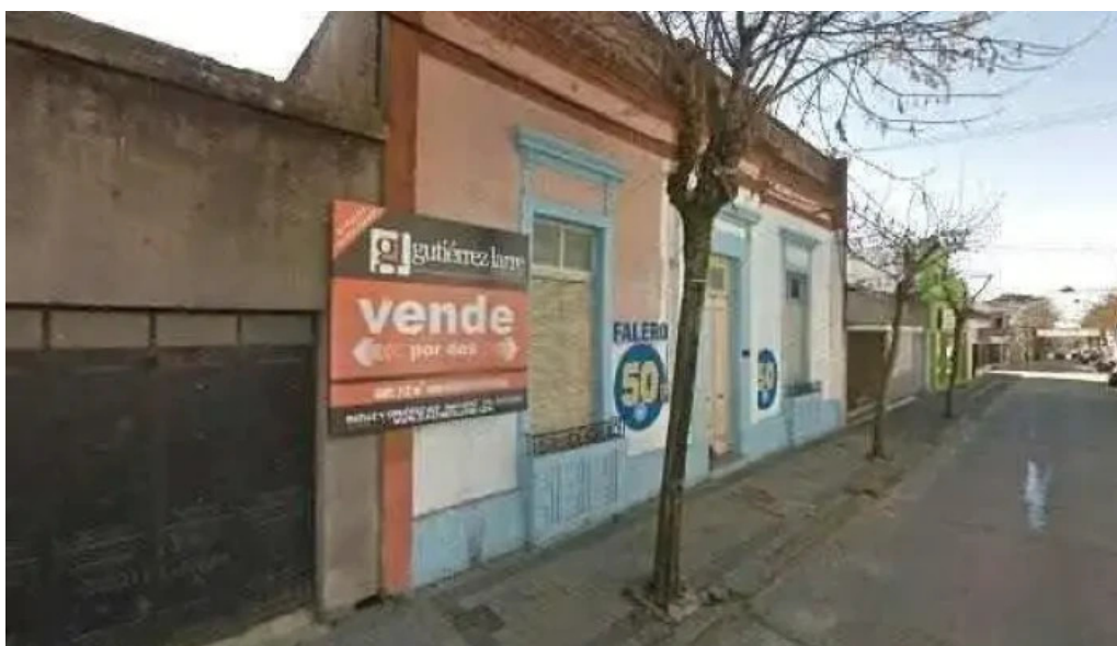
Comidas de la abuela street view y 360