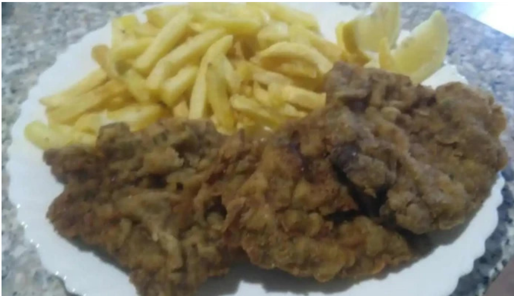
Comida al paso y kiosko mil horas papas fritas