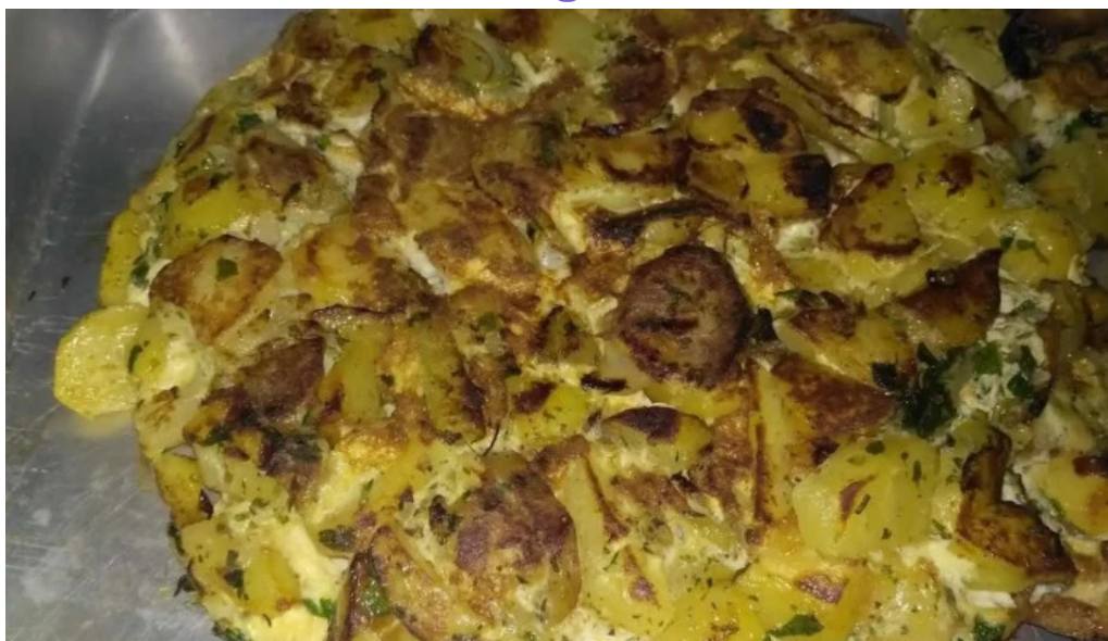
Comida al paso y kiosko mil horas todas