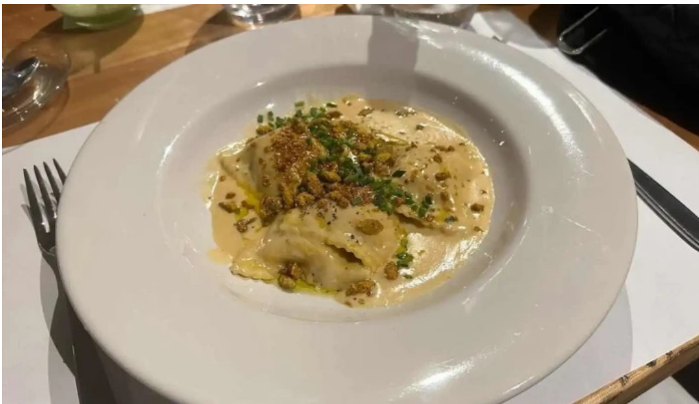
Charco bistro ravioli