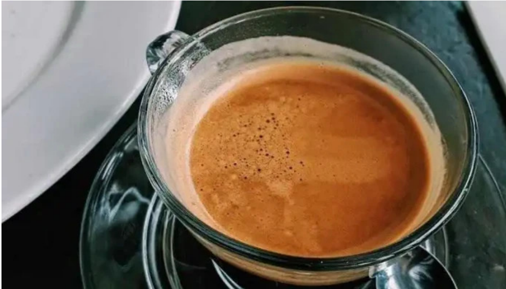
Charco bistro cafe