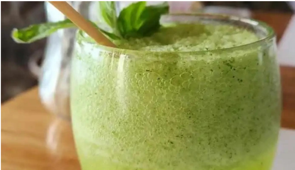
Charco bistro jugo