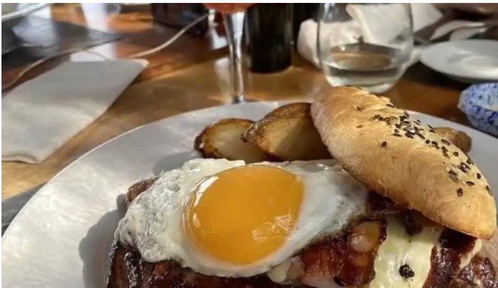
Charco bistro huevo frito