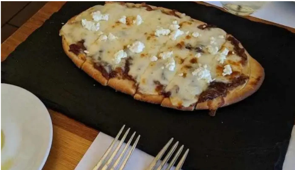
Charco bistro pan plano