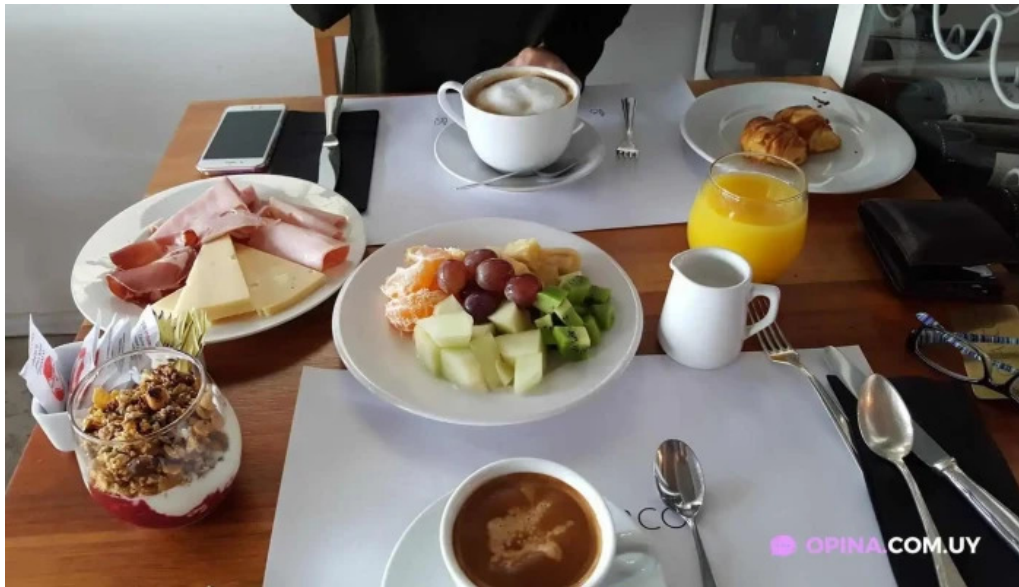
Charco bistro comida y bebida