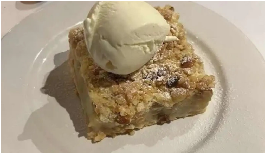
Charco bistro mas recientes