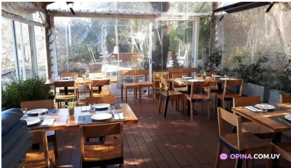
Charco bistro col del sacramento