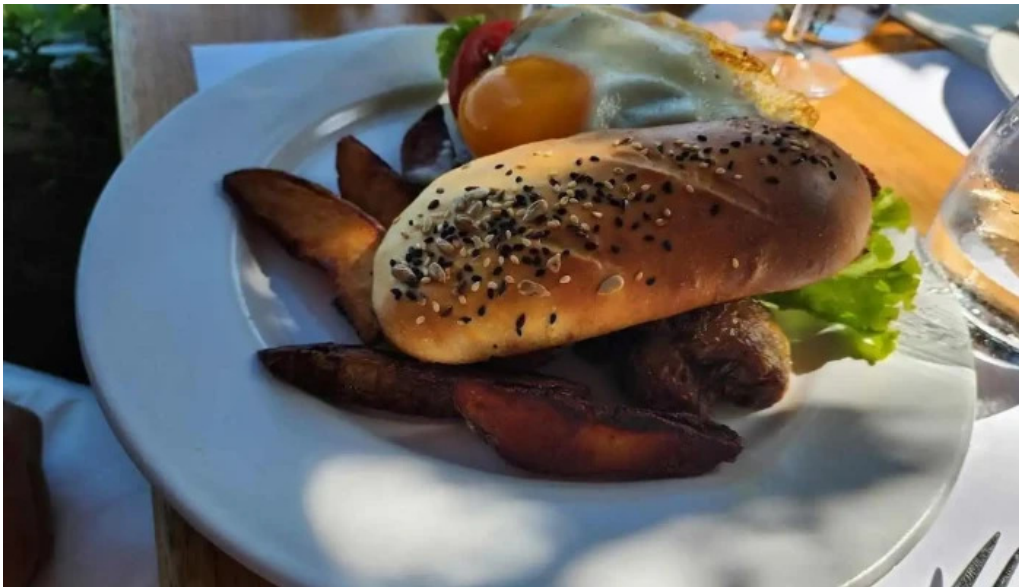
Charco bistro sandwich de pollo