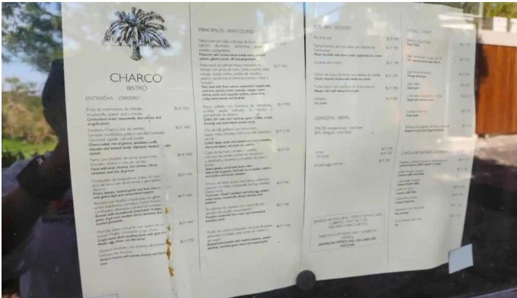
Charco bistro menu