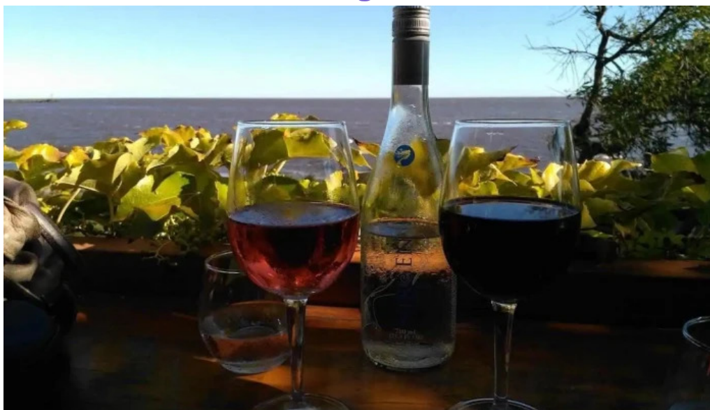
Charco bistro vino