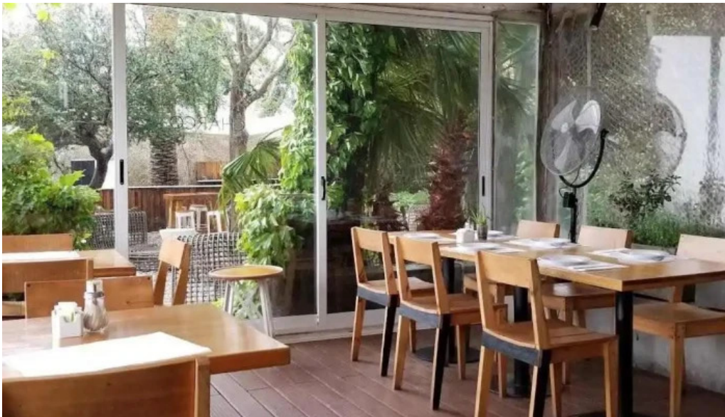
Charco bistro ambiente