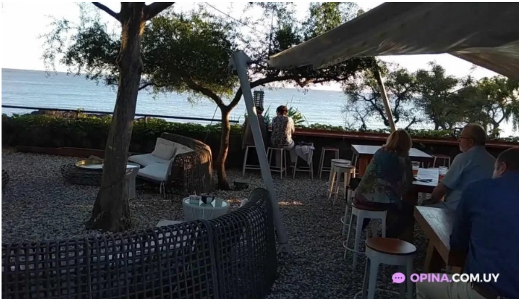
Charco bistro videos